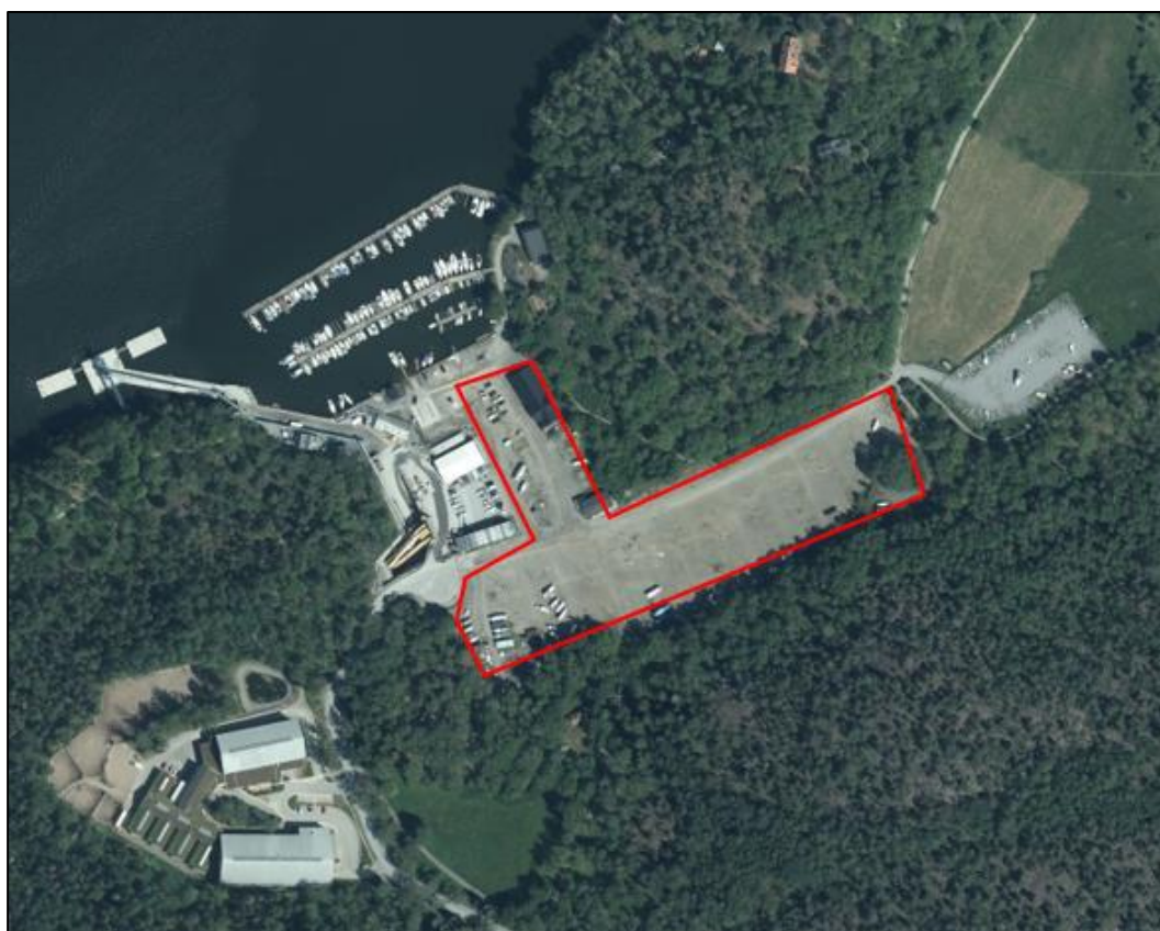
Figur 2. Undersökningsområdet markerad med röd linje.

Sätra varv ligger vid vattnet strax norr om Sätra, med strandlinje som vetter mot ön Kungshatt, se Figur 2. Fastigheten omfattas av Sätraskogens naturreservat samt Östra Mälarens vattenskyddsområde. Området är klassat av länsstyrelsen som potentiellt förorenat område, riskklass 1. Markytorna inom undersökningsområdet utgörs av grusade ytor. Den södra delen av området används som båtuppläggningsyta. Inom den norra delen av undersökningsområdet finns bland annat parkeringsytor och byggnader som används som bland annat servicebyggnad, mastförråd, garage och verkstad m.m (Stockholm stad, 2019).