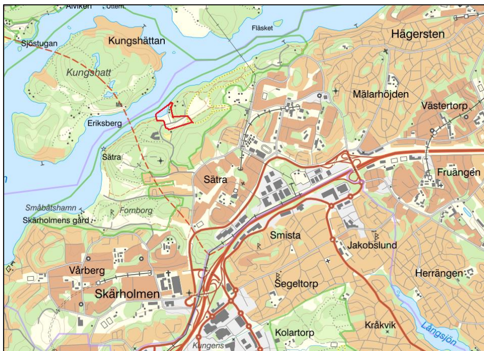
Figur 1 Lokalisering av Sättra varv, markerat i rött (Topografisk karta © Lantmäteriet, 2020).

Området som omfattas av föreliggande undersökning har tidigare använts som och används än idag som båtuppläggningsplatser. Syftet med undersökningen är att utreda om det förekommer föroreningar i mark relaterade till den verksamhet som har bedrivits på platsen.