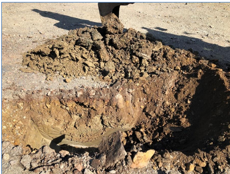
Figur 4. Provgrop 20GS04.