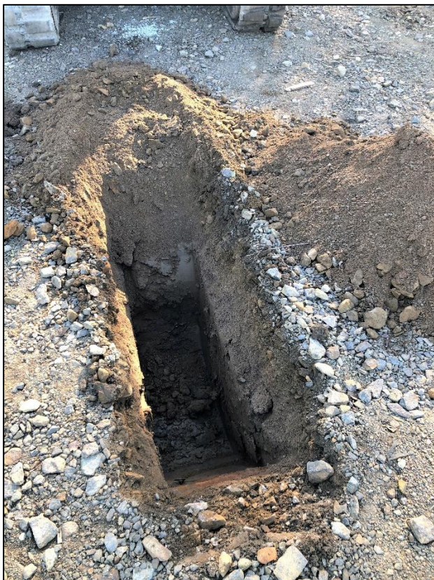
Figur 3. Provgrop 20GS01.