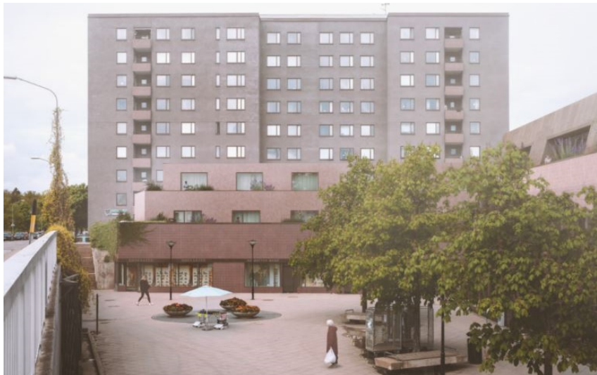
Vy från Selmedalsvägen väster över torget mot föreslagen påbyggnad centrumlokaler i öster.

Höghuset förhåller sig till den stora skalan som representeras av de nio våningar höga skivhusen, vars repetitiva struktur av enkla, likadana huskroppar har en påtaglig betydelse för karaktären på området. Med det som utgångspunkt placeras ett högt, slankt hus vid torget, på ett avstånd till befintliga skivhus liknande det inbördes avståndet mellan skivhusen. Huset föreslås placeras snedställt mot Selmedalsvägen, i samma vinkel och på ungefär samma avstånd som befintliga skivhus längs Selmedalsvägen och får därmed en likartad relation till gatan. För att bidra till slankhet, skuggspel och för att anknyta till skivhusens rektangulära form är punkthusets volym uppdelad i två delar som är inbördes förskjutna. Ovan regleras med planbestämmelser.