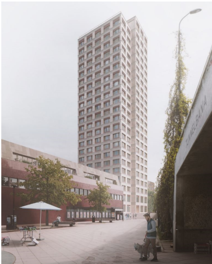
Vy från gångtunnel vid Hägerstens torg österut mot föreslaget bostadshus i 24 våningar. Till väster i bild påbyggnad på befintlig centrumbyggnad.

De delar av befintliga byggnader som ska bevaras är klinkerfasader, öppningar för skyltfönster, horisontella fönsterband och entréöppningar. Även underhåll ska utföras i överensstämmelse med originalutförande eller på ett sätt som är typiskt för byggnadernas tillkomsttid. Ovan regleras med planbestämmelser.