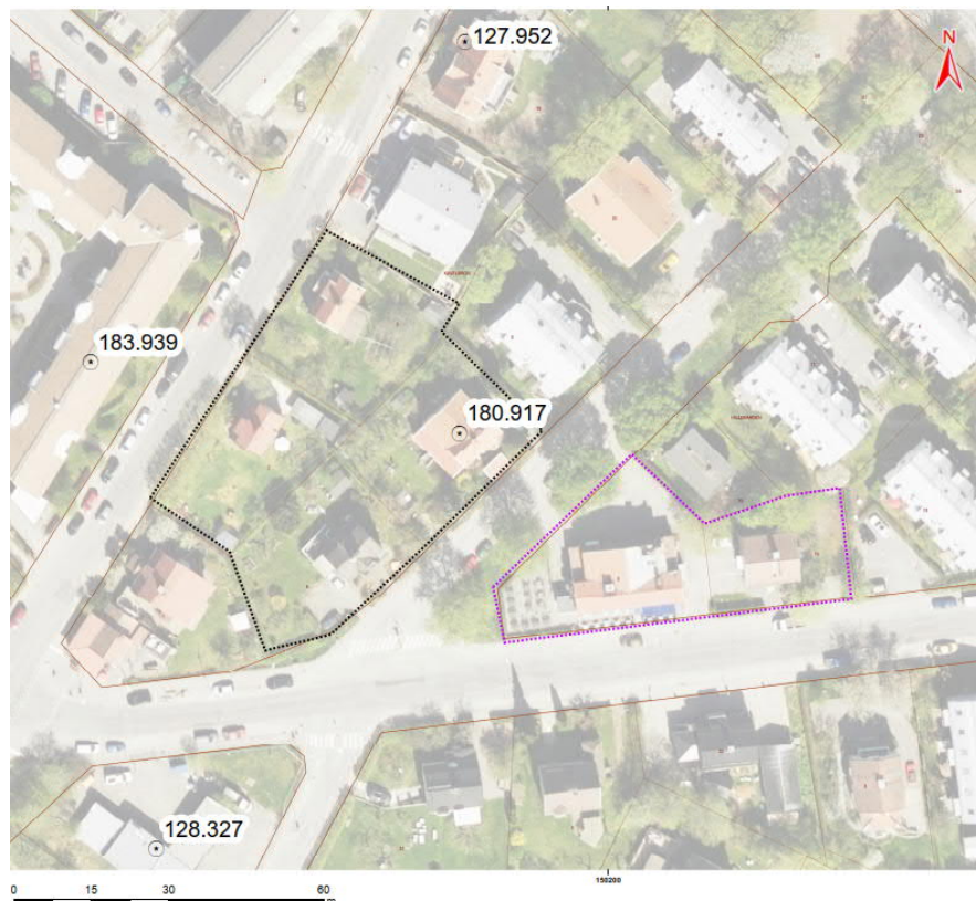
Figur 2. Översiktskarta som visar närliggande identifierade objekt i EBH-stödet.

på halter av kobolt över KM men under riktvärdet för mindre känslig markanvändning (MKM). Kobolt är dock naturligt förhöjt i lera i delar av Mälardalen vilket gör att den analyserade halten kan vara naturlig. Uttagna grundvattenprov visar generellt på låga halter. Ofiltrerade prov visar på förhöjda halt avseende bly, dock inte filtrerat prov. Vid bedömning av halter i grundvatten ska jämförelse göras med filtrerat prov.