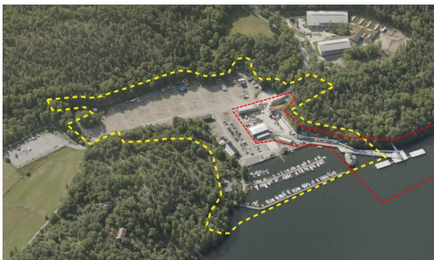
Snedbild som visar planområdet och dess omgivning. Planområdet är markerat med gul streckad linje. Trafikverkets arbetsområde är markerat med röd streckad linje.

Inom fastigheten Båtvaggan 1 finns idag fyra varvsbyggnader (förrådsbyggnader, servicehus, garage mm) uppförda med tidsbegränsade bygglov från 2013/2014 för att ersätta de varvsbyggnader som rivits i samband med Trafikverkets etablering. Inom området finns även ett antal tillfälliga anläggningar i form av bodar, verkstadstält mm, samt en tillfällig hamn för att sjövägen kunna transportera bort bergmassor från tunnelbygget. Dessutom omfattar planområdet torpet Rostock och ett befintligt klubbhus invid vattnet tillhörande Sättra båtsällskap, samt två mindre förrådsbyggnader och ett mindre pumphus i anslutning till befintlig brygganläggning.