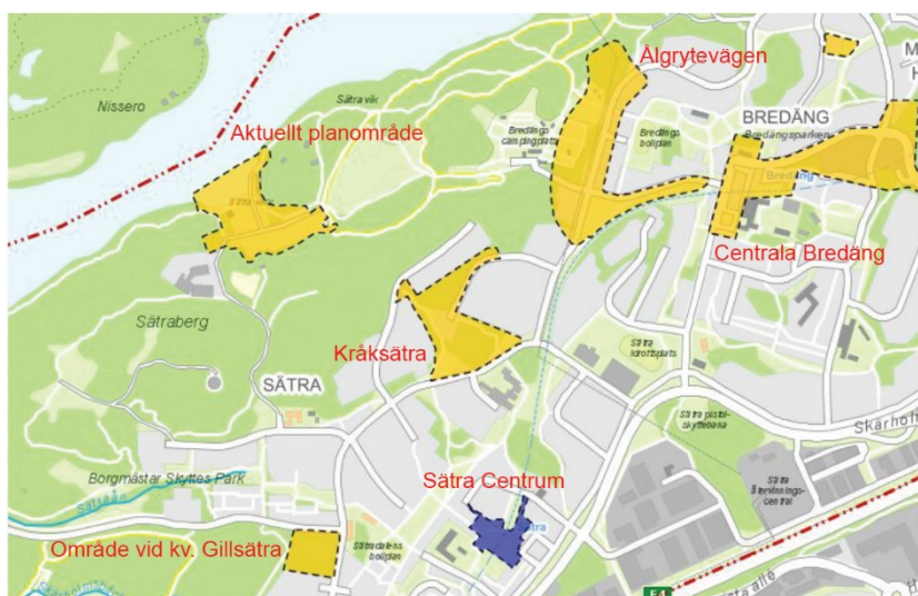
Karta över pågående planarbeten markerade med blått och gult.