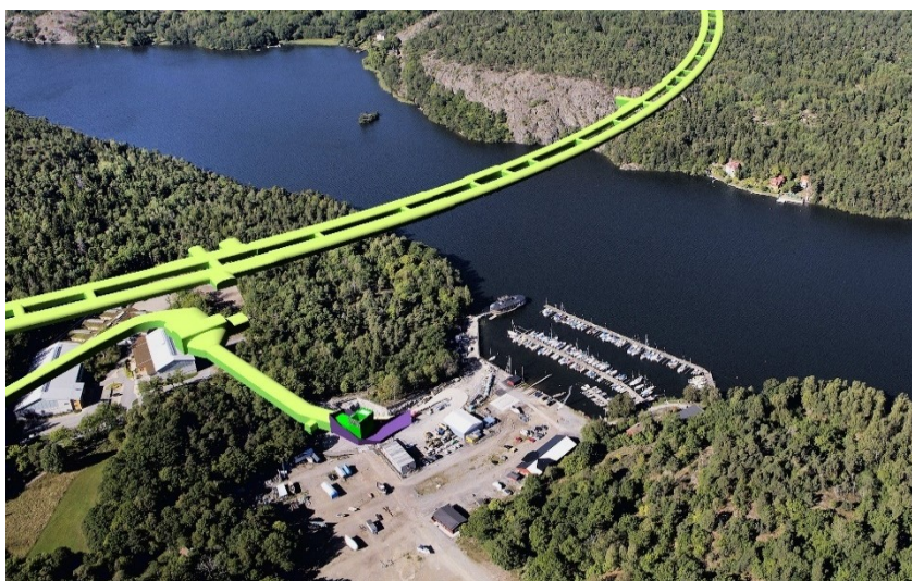
Fotocollage som illustrerar tunnelsystemet för del av Förbifart Stockholm, under marknivå, i ljusgrön färg. Föreslaget brandgasschakt samt betongtunnel illustreras i mörkgrön färg.