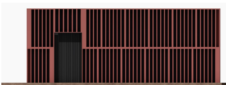
Fasadelevation som illustrerar en möjlig utformning och gestaltning av föreslagen teknikbyggnad (brandgasschakt). Bild: ON arkitekter.