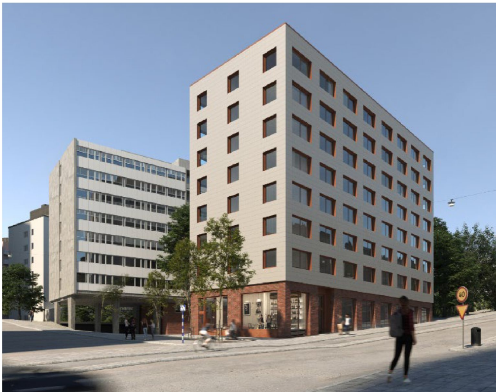
Figur 1 - Rio 7.

Projektet omfattar ett hus och bullret domineras av trafiken på Värtavägen där det förutom vanlig persontrafik även går många bussar.