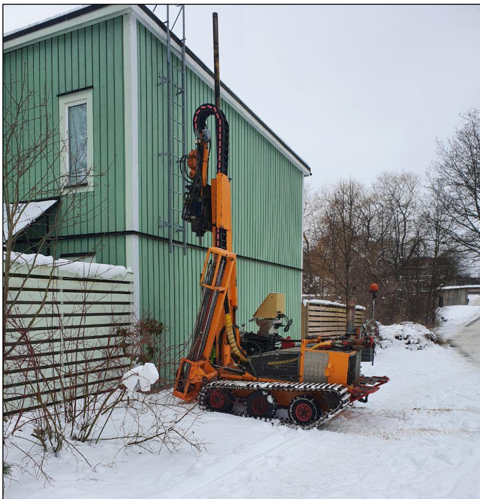
Figur 3: Provpunkt 3 med en illustration av rådande väderförhållanden.

Provtagning skedde den 19 februari. Området är dominerat av hårdgjorda ytor omgivna av flerfamiljehus och vad som ser ut att kunna vara en gammal kontorslokal, området för provtagningen befinner sig i en svagt sydligt lutande sluttning. Enstaka anlagda grönområden finns mellan de hårdgjorda ytorna. Lufttemperaturen under dagen uppmättes till omkring 5 grader. Ingen nederbörd. Tunt snötäcke (<5cm) se, (figur 3). Fyllnadsmassorna bestod av sandigt material med mindre klaster (~3cm) fullt utspridda i markmatrisen. Lerlagret som framträdde cirka en meter ned var grått och hade låg till inget organiskt innehåll – Leran uppskattas vara av glacial typ.