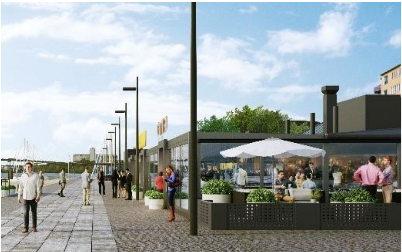
Perspektivbild sedd från öster. Bilden visar den tilltänkta uteserveringen på den befintliga byggnadens östra sida.

Inom drivmedelstationens område möjliggörs det för biogashantering, och funktioner omdisponeras och utformas för att inte störa utblickar och förbättra framkomligheten för trafik. Vid kajen planeras en sjöbensinstation på ponton.