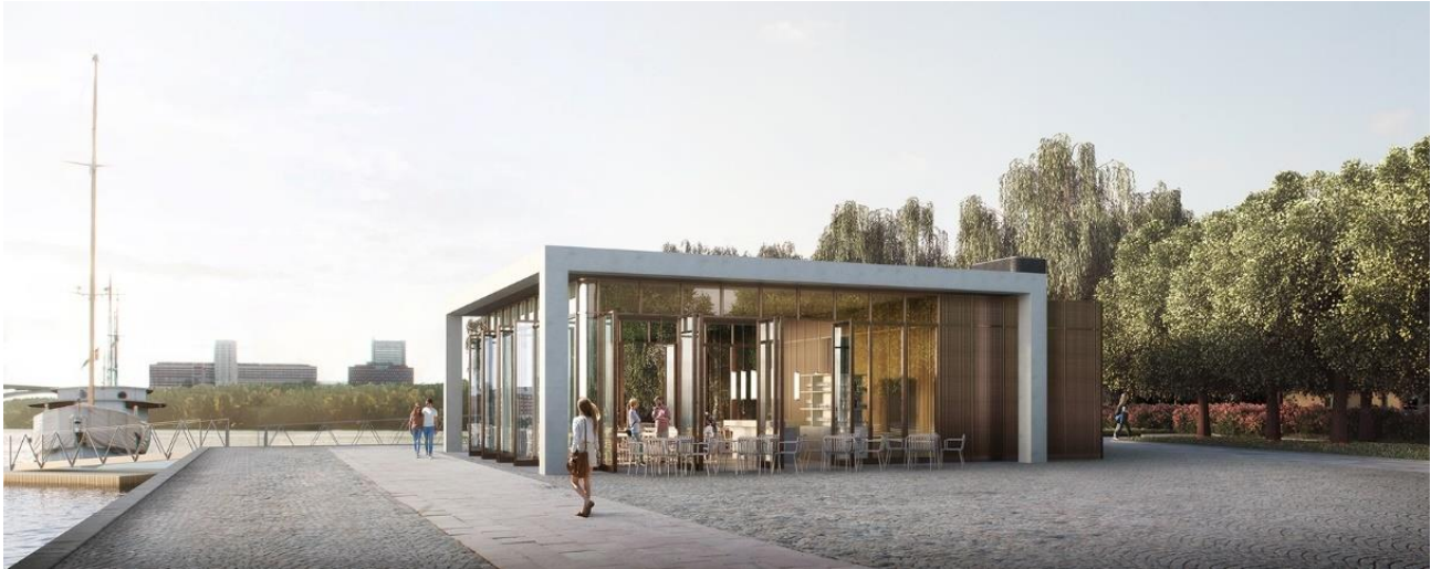
Perspektivbild sedd från öster. Det nya hamnkontoret med restaurang (Bild: Andreas Martin-Löf Arkitekter)

hörna mer publik. Öster om huset finns möjlighet till uteservering. Byggnaden är indragen från kajkanten för att inte försämma framkomligheten eller utsikt för gående.