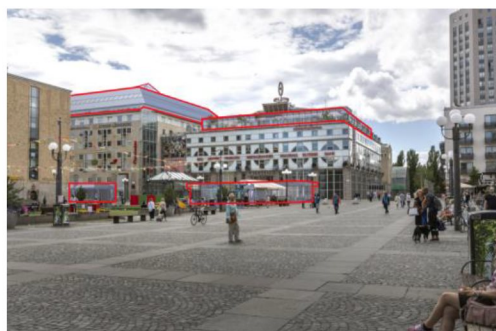
Vy från Götgatan