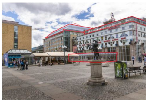
Vy från Medborgarplatsen