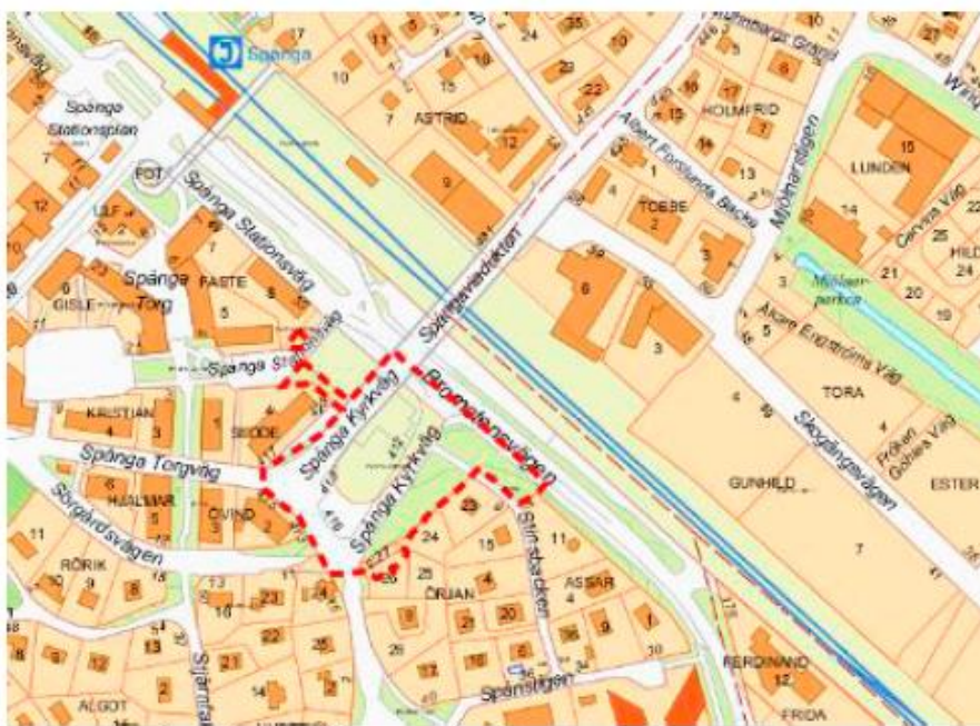
Karta som visar planområdets avgränsning.