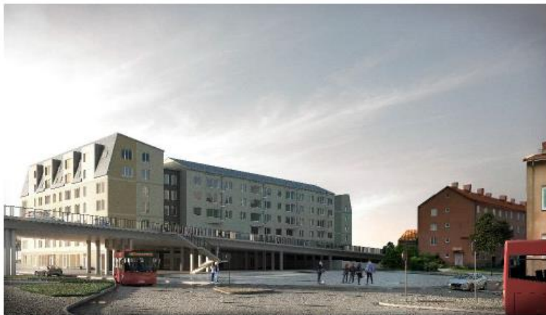
Möjlig utformning av kvarteret, vy från Spånga bussterminal. (Brunnberg & Forshed)

Kvarteret dockas mot viadukten och ger möjlighet till entréer både från viadukten och från utrymmet under viadukten. Krav på genomsiktlighet i fasad mot utrymmet under viadukten ställs i detaljplanen i syfte att öka graden av trygghet på platsen.