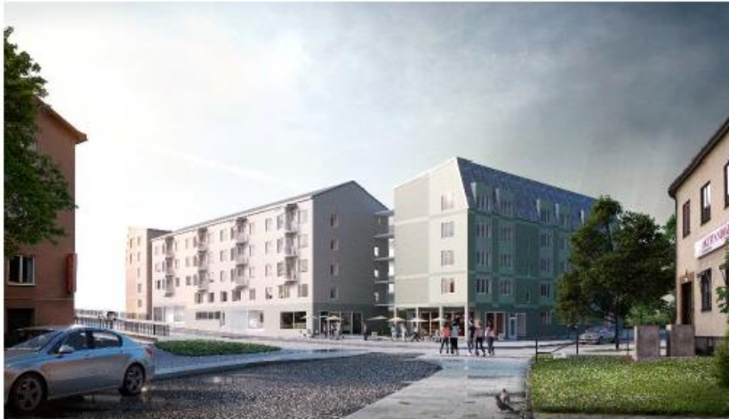
Möjlig platsbildning i fonden av Spånga Torgväg. (Brunnberg & Forshed)

Kvarteret dockas mot viadukten och ger möjlighet till entréer både från viadukten och från utrymmet under viadukten. Krav på genomsiktlighet i fasad mot utrymmet under viadukten ställs i detaljplanen i syfte att öka graden av trygghet på platsen.