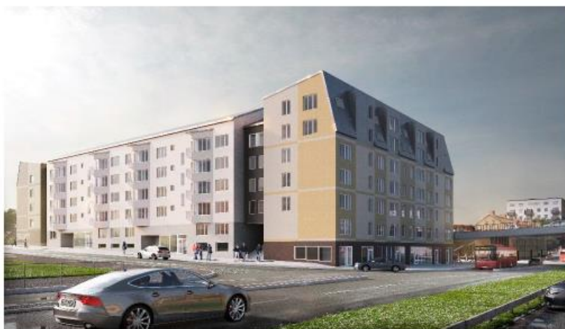
Möjlig utformning av kvarteret, vy från Bromstensvägen. (Brunnberg & Forshed)