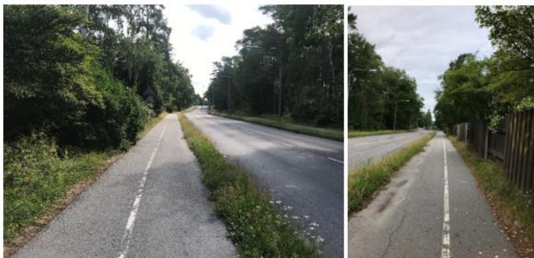
Figur 6 Foto till vänster på Västerled taget västerifrån i riktning österut. Foto till höger taget på Västerled österifrån i riktning västerut (Geografiboken till höger i bild).

Väster om planområdet löper Abrahamsbergsvägen mellan Abrahamsbergs centrum och Västerled. Abrahamsbergsvägen har ett trafikflöde på 2600 ÅDT 3 och är en dubbelriktad gata med ett körfält i varje riktning, kantstensparkerings på östra sidan om körbanan och gångbana på vardera sida om körbanan. Körbanans bredd är cirka 7 - 7,5 meter bred (inklusive parkering) och gångbanornas bredd är cirka 2 meter. Abrahamsbergsvägen har på större delen av gatusträckan hastighetsgränsen 50 km/h. Förbi förskolorna, dvs intill planområdet Geografiboken 1, är dock hastighetsgränsen 30 km/h.