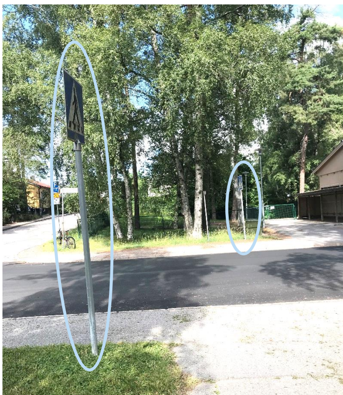
Figur 7 Övergångsställe över Abrahamsbergsvägen. Övergångsstället är omålat och stolparna med vägmärken är inte parallellt placerade. Fotot är taget från Geografiboken ut mot Abrahamsbergsvägen.

Invid Geografiboken finns 15-minutersparkering på Abrahamsbergsvägen, antagligen avsett för de två förskolorna i området. Inom planområdet finns ingen avsedd bilplats för hämta/lämna till förskolan. Uppskattningsvis sker det via korttidsparkeringen på Abrahamsbergsvägen eller spontan uppställning vid infarten på fastigheten på parkeringsplatsytan.