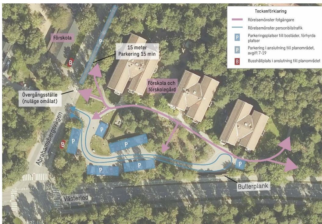
Figur 3 Uppskattat rörelsemönster inom detaljplaneområdet.

Kvartersgatan mellan byggnaderna och parkeringsplatserna är en smalare asfaltsbelagd sträcka med en bredd på cirka 3 meter. I den östra änden, intill vändplanen bedöms den vara något bredare än 3 meter då den sammanfaller med asfalterad gångbana. I den västra änden bedöms den vara 3 meter eller lite smalare och avgränsas med större stenar mot gräset intill.