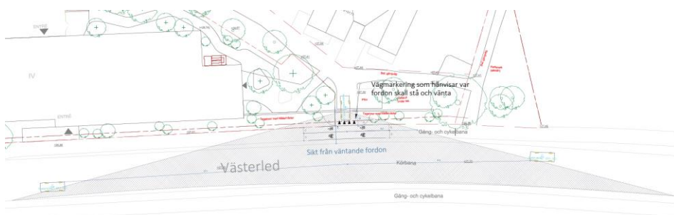
Figur 14 Sikten har studerats vid utfart på Västerled.

Utfarten till Västerled innebär att en gång- och cykelbana korsas. Nedan redovisas siktförhållandena vid utfarten med en tänkt port, se Figur 14. Fordon från utfarten kan stå och vänta utan att blockera gång- och cykelvägen och uppfyller VGUs standard om sikt vid korsning (VGU Tätort, SKL och Trafikverket, 2015). För att förtydliga hänvisningen var fordon skall stå och vänta föreslås en vägmarkering M13 Stopplinje eller M14 väjningsplikt vid utfarten. Vägmarkeringar på gång- och cykelbanan bör även förstärkas, läs mer om detta i kommande avsnitt.