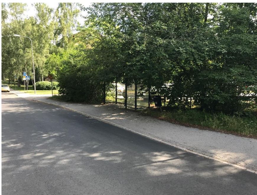
Figur 8 Foto på busshållplats på Abrahamsbergsvägen för trafik mot Alvik (hållplatsen på östra sidan om körbanan).