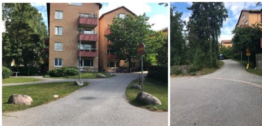
Figur 4 Fotot till vänster visar entrén till den asfaltsbelagda sträckan västerifrån på fastigheten. Det högra fotot visar entrén österifrån till den asfaltsbelagda sträckan.

Kvartersgatan är endast avsedd för servicefordon då den är skyltad med vägmärke C3 1 med tilläggstavla i östra änden och vägmärke C1 2 i västra änden. Detta innebär att boende inte tillåts köra på denna gatusträcka.