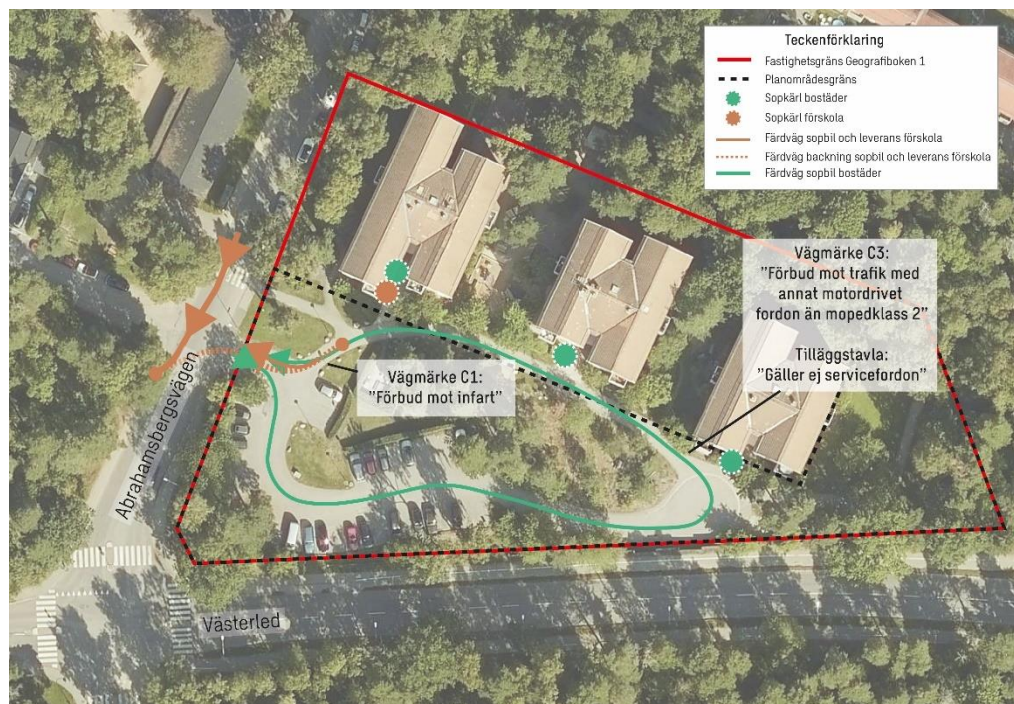
Figur 5 Uppskattat rörelsemönster för servicefordon på fastigheten.

Sophämtning sker en gång i veckan för bostäderna och förskolan (onsdagar), vilken färdas enligt grön pil i figuren nedan. Hämtning av förskolans matavfall sker en gång i veckan (torsdagar), som färdas enligt orange färdväg i figuren nedan. Leveranser till förskolan sker enligt uppskattning av förvaltare varje dag som i flesta fall backar in som orange pil i figuren nedan.