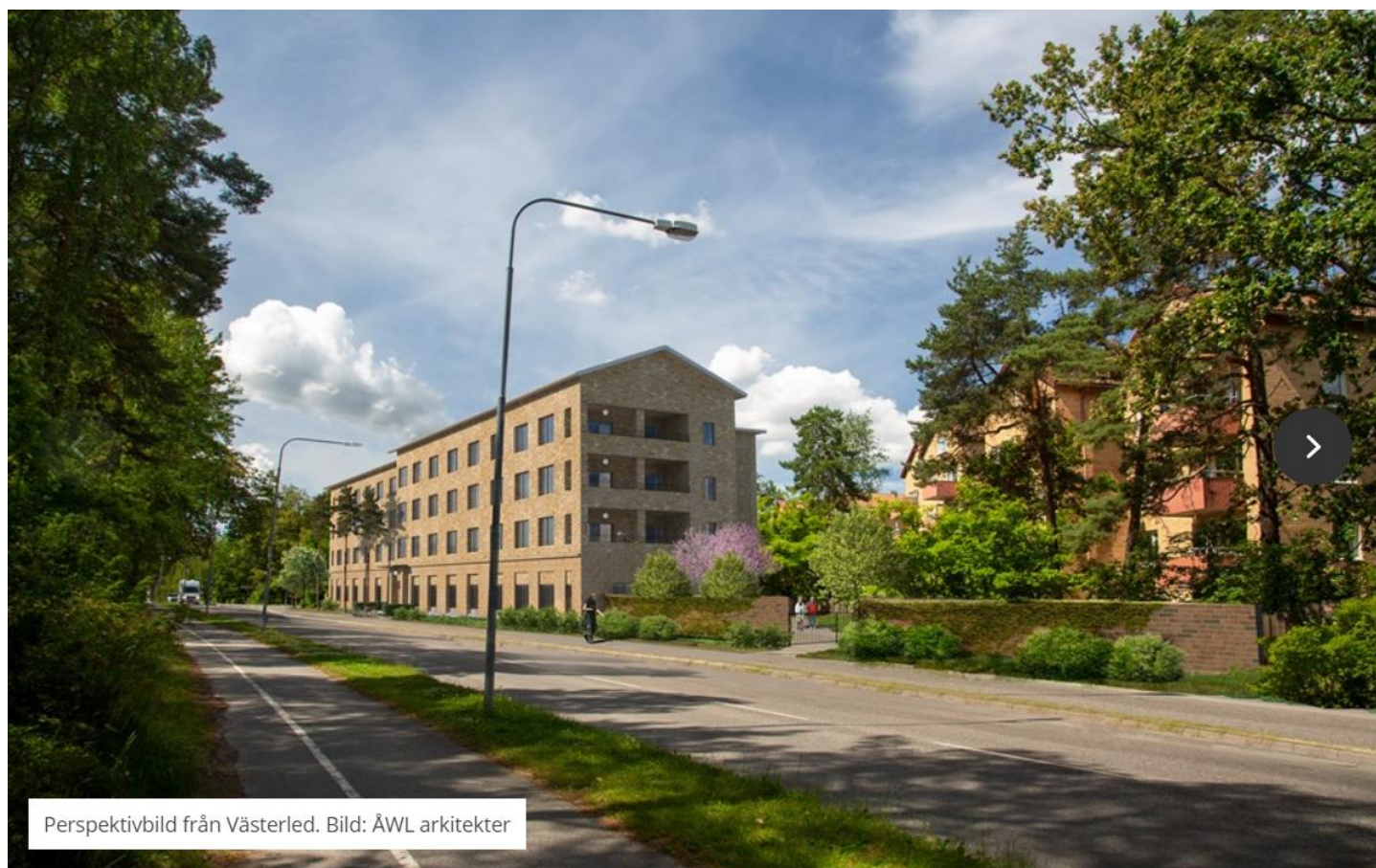
Perspektivbild från Västerled. Bild: ÅWL arkitekter