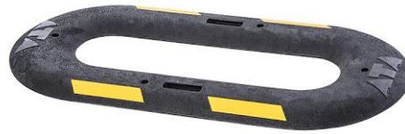
Figur 10 Förslag på fartgupp som sänker fordons hastigheter. Ett fartgupp av denna sort kan relativt enkelt placeras och tas bort utan större omfattande åtgärder (Källa vänster bild: flexibump.se. Källa höger bild: ATA.se).

Placering av vägmärke A15, varning för barn: