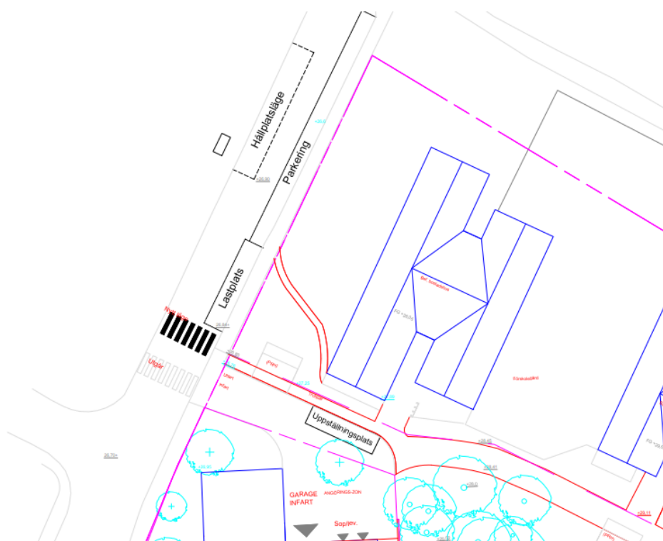
Figur 15. Abrahamsbergsvägen får ny utformning när utfarten till Geografiboken flyttas. Här är ett exempel på placering av övergångsställe, hållplatsläge och lastplats.

I planförslaget flyttas infarten från Abrahamsbergsvägen några meter norrut vilket dels innebär att det befintliga övergångsstället behöver flyttas norrut. Planförslaget innebär även att busshållplatsen på västra sidan om körbanan flyttas norrut. Anledningen till hållplatslägets flytt är dels det flyttade övergångsstället, dels att en eventuell lastplats på Abrahamsbergsvägen kan göra det trångt i körbanan om hållplatsen ligger mitt emot. Se Figur 15 för ett exempel på utformning av Abrahamsbergsvägen.