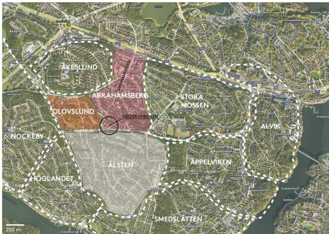
Figur 2 Geografiboken ligger södra Bromma och angränsar till områdena Abrahamsberg, Olovslund och Ålsten.

Geografiboken 1 är ett planområde på ca 4300 kvm som ligger i södra Bromma intill Västerled och Abrahamsbergsvägen. Planområdet ligger cirka 850 meter från Abrahamsbergs tunnelbanestation på gröna linjen samt cirka 650 meter från station Olovslund på Nockebybanan.