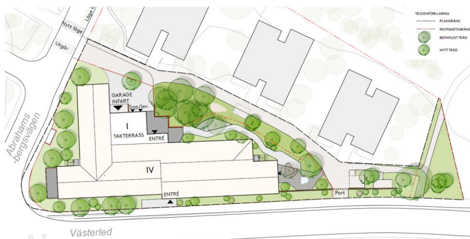
Figur 9 Illustrationsplan, planförslag Geografiboken 1. Kvarteretsgatan förses med en utfart mot Västerled.

Planförslaget innebär ett nytt vårdboende på fastigheten som innefattar cirka 80 bostäder. Vårdboendet är även en arbetsplats för personal. Under detaljplaneprocessen har angöring till vårdboendet diskuterats och vilken lösning som är mest trafiksäker och trygg med hänsyn till befintliga hyresrättsbostäder samt förskolan på fastigheten vilket har landat i följande planförslag.