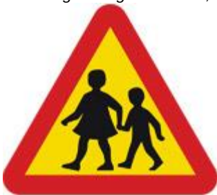
Figur 11 Förslag på placering av vägmärke A15. Märket anger en vägsträcka där barn ofta korsar eller uppehåller sig på eller vid vägen (bildkälla: Transportstyrelsen.se).

Placering av vägmärke A15, varning för barn: