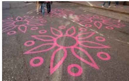
Figur 12 Inspiration till förslag på lekfull vägmålning från projektet Framtidsgator i Stockholms stad. En lekfull vägmålning kan förtydliga att barn finns i området.

Kvartersgatans utfart mot Västerled förses med en port. Porten är förslagsvis automatisk för att samtliga fordon (tex matvaruleveranser till hyreshuset längst in) ska kunna köra ut på Västerled. Porten är en del av den bullerskyddande muren mot Västerled.