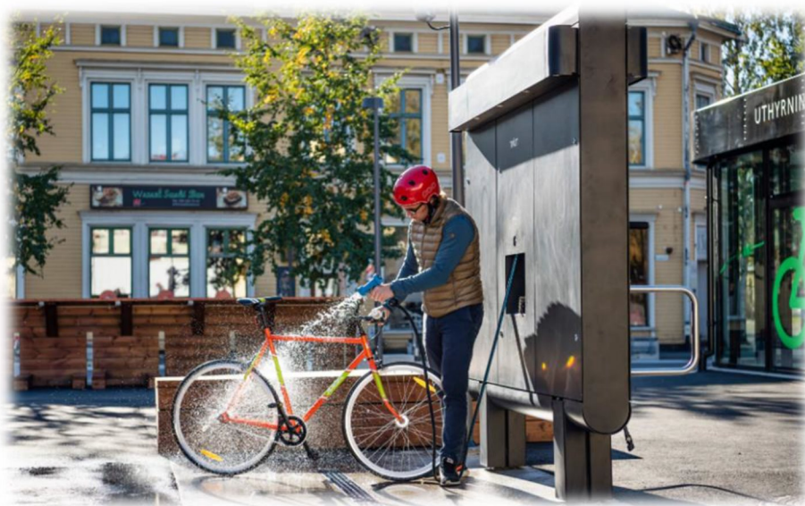
Figur 2. Exempel på servicestation.