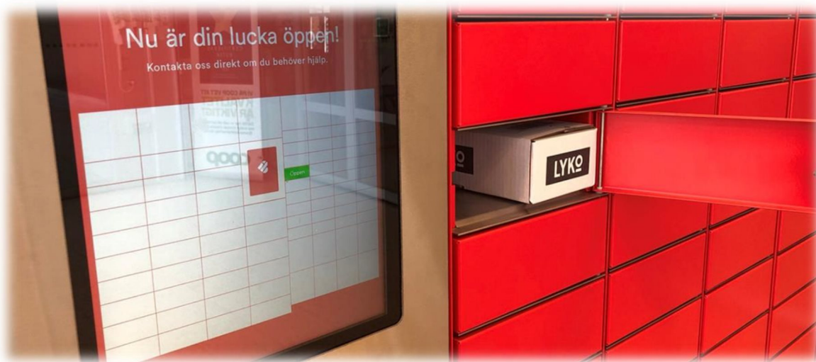
Figur 3. Exempel på leveransskåp.

Leveransskåpen kommer att utrustas med lås som öppnas med kortläsare alternativt med mobiltelefonen. Skåpen kommer att placeras så att de är enkla och smidiga att nå för de boende. För att tjänsten ska fungera på bästa möjliga sätt kommer det att finnas skåp i olika storlek. Små skåp för mindre paket och stora skåp för matkassar etc.