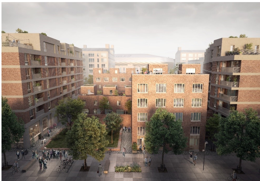
Exempel på uppbruten kvartersutformning inom kvarter Q. Till vänster i bild syns en fickpark. Bild: Jägnefält Milton.

Slakthusområdets gator har historiskt haft ett enkelt industriellt golv av gatsten eller asfalt. När Slakthusområdet omvandlas till en blandad stadsmiljö är det sammanhängande golvet ett karaktärsdrag som tas tillvara och vidareutvecklas. Alla trafikslag samsas och som gående ska det vara möjligt att röra sig fritt över hela ytan.