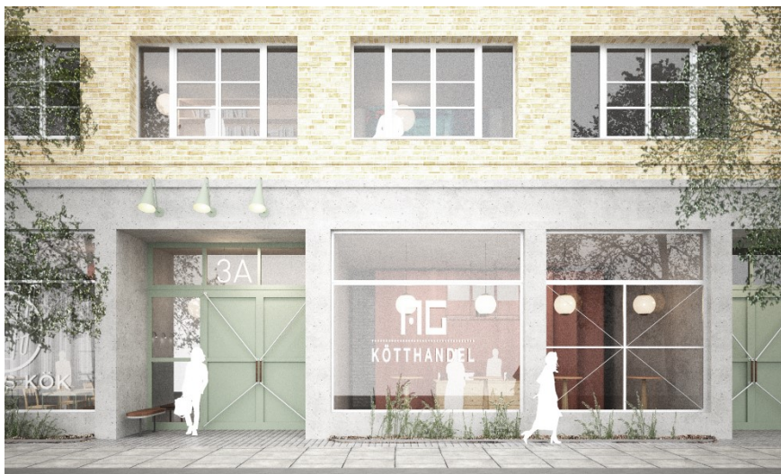
Exempel på markerad bottenvåning inom kvarter R. Bild: DinellJohansson.

Fasader i tillkommande bebyggelse ska vara regelbundna och enkelt uppbyggda för att uppfattas som en helhet och samspela med kvaliteter i den befintliga industriarkitekturen. Förhöjda och markerade bottenvåningar säkerställs genom bestämmelse på plankartan. Fönstersättningen är genomgående regelbunden vilket beskrivs i tillhörande gestaltningsprogram. Bevarade byggnader skyddas dels genom markanvändningsbestämmelsen och dels genom skydds- och varsamhetsbestämmelser.