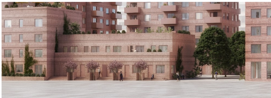
Exempel på stadsradhus i möte med gatan i kvarter L. Bild: Söderberg Söderberg.

Kvarteren i aktuell detaljplan är uppbrutna för att uppnå goda dagsljusförhållanden både i kvarteret och i gaturummet. Huvudsakligen har högre byggnader placerats i änden av de långsmala kvarteren. På det viset ges även smala gaturum i nord-sydlig riktning goda ljusförhållanden.