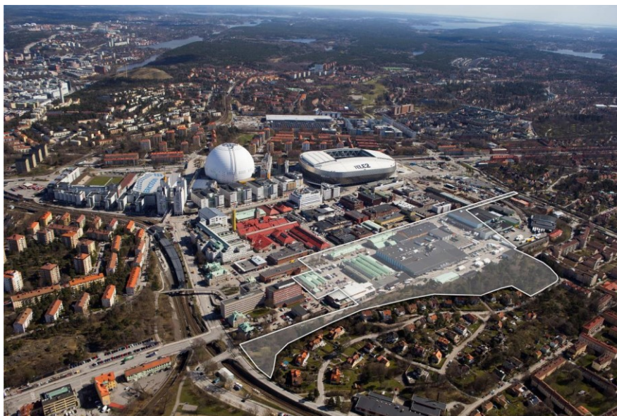
Karta som visar planområdets ungefärliga avgränsning.