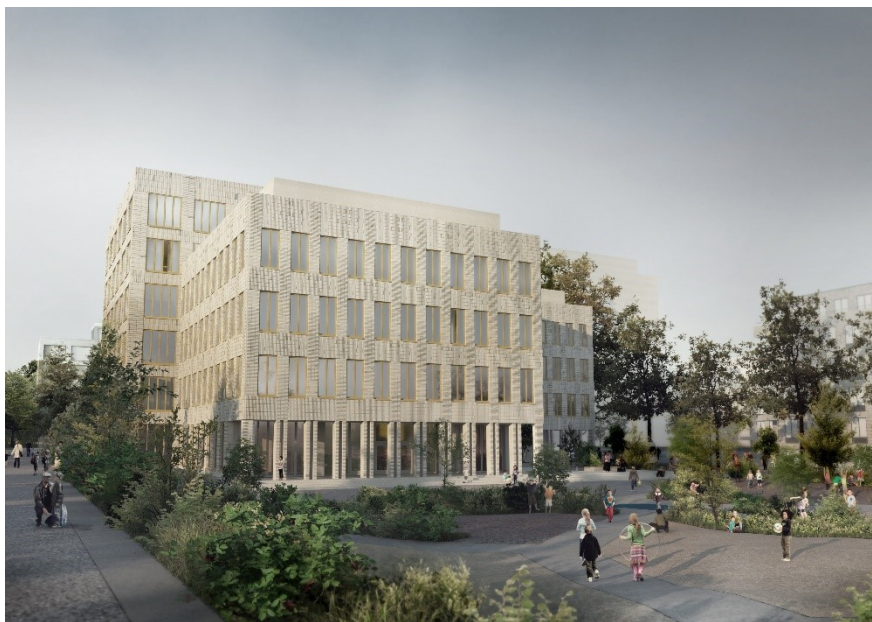
Ny grundskola i Slakthusområdet. Bild: Max Arkitekter.

Den befintliga naturparken (Frötallen) kompletteras med ett centralt parkrum, Fållan. Fyra så kallade fickparker planeras. Fickparkerna föreslås fördelas jämnt över området och integreras i kvartersstrukturen.