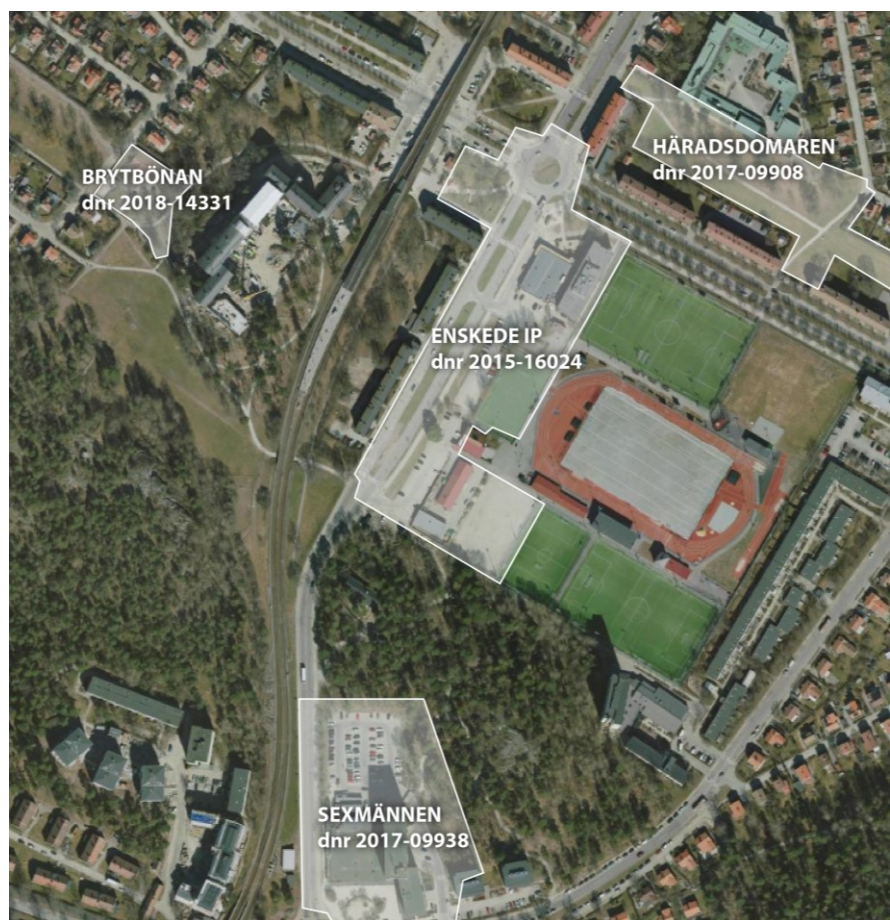
Pågående detaljplaner i närområdet

I närområdet pågår flera stadsutvecklings- och planprojekt. Närliggande Enskedevägen är i översiktsplanen utpekad som ett urbant stråk. Häradsdomaren, dnr 2017-09908, Enskede IP, dnr 2015-16024 och Sexmännen, dnr 2017-09938 är detaljplaneprojekt utmed Enskedevägen som tillsammans bidrar med drygt 600 nya bostäder. I andra änden av Enskedefältet pågår planarbeten innehållande cirka 600 nya bostäder längs Bägersta byväg. Slakthusområdet, Årstafältet och Årstastråket är stora stadsutvecklingsprojekt i närområdet som omfattar cirka 10 000 nya bostäder.