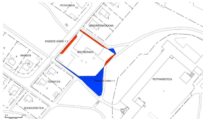
Illustrationskarta: Röda områden går från kvartersmark till allmän plats och blå områden förs från allmän plats till kvartersmark.