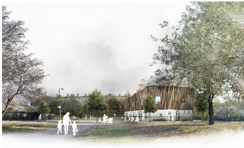
Möjlig utformning av nu förskolebyggnad i vy från Vårflodsparken. Illustration: Niras arkitekter

Samrådsförslaget bygger på att förskolan till sin storlek skiljer sig från kringliggande hus och av den anledning givits en egen utformning som tydligt skiljer sig från områdets egnahemsvillor med dess burspråk och allmogelistverk.