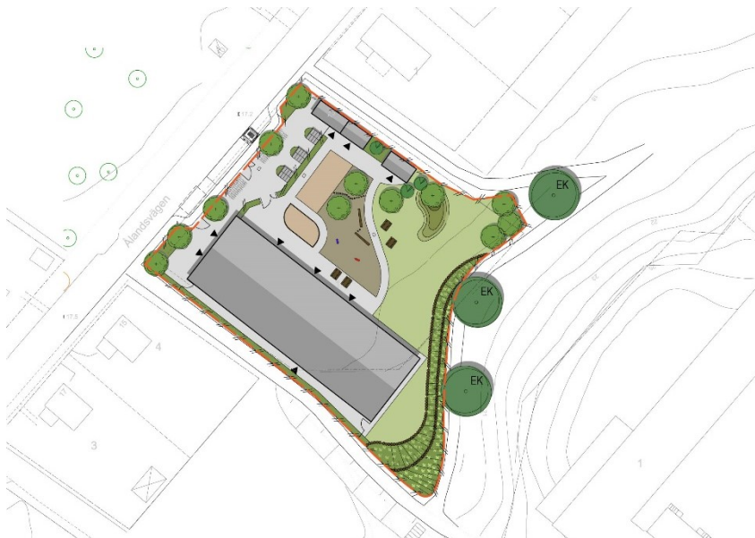
Ny byggnads placering och föreslagen utformning av gårdsmiljön. Illustration: ÅF