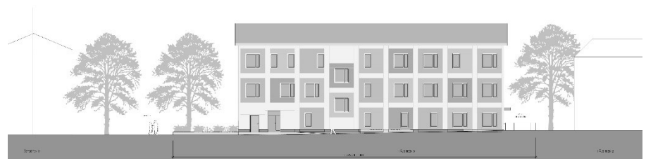
Föreslagen bebyggelse, sett från Grundtvigsgatan (Niras arkitekter, 2020).

Byggnaden kommer likt tidigare förskola att placeras med långsidan parallellt med Grundtvigsgatan. Placeringen har anpassats för att bevara siktlinjen mot parken.