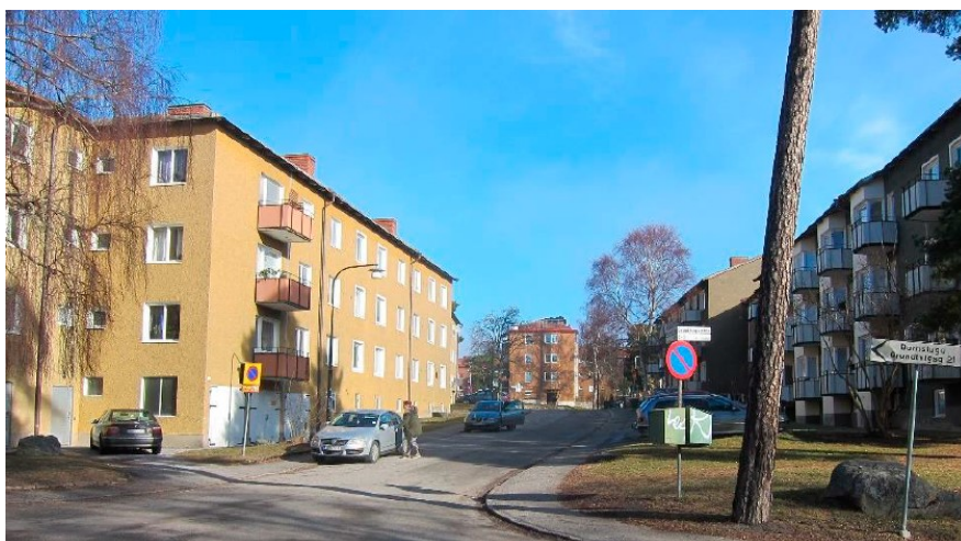
Korsningen Grundtvigsgatan och Kaj Munks väg. Bilden visar stadsbilden i området.

Byggnaderna är placerade utmed gatan och skapar på så vis ett tydligt gaturum. Gemensamt för området är lamellhusen som bildar halvt slutna gårdar. Långa terränganpassade gator är utmärkande för Blackeberg. Bebyggelsen följer den kraftigt kuperade terrängen och den ursprungliga naturen är bevarad både mellan husen och på gårdarna.