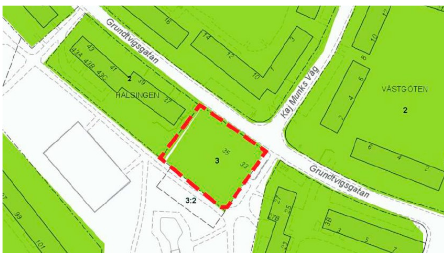
Grönklassad bebyggelse i närområdet, planområdets avgränsning markerat med rött.

Blackeberg är en tidstypisk representant för 1950-talets tunnelbaneförstad och karaktäriseras bland annat av lamellhus inbäddad i grönska. Hälsingen 3 ligger i ett område som är grönklassat av Stadsmuseet. Grön klassning är den näst högsta nivån och innebär att bebyggelsen är särskilt värdefull från historisk, kulturhistorisk, miljömässig eller konstnärlig synpunkt.