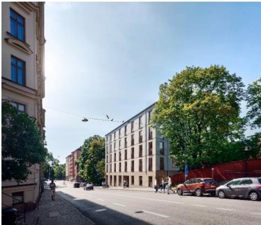
Det planerade huset sett från Renstiernas gata norrifrån (Belatchew arkitekter).

Möjlighet till boendeparkering för bil ordnas i Stigbergsgaraget, cirka 600 meter från planområdet, med ett lägesbaserat parkeringstal (cirka 0,4 platser per lägenhet). Föreslagna ny bebyggelse ska anordna cirka 90 cykelplatser i källarvåningen, vilket motsvarar cirka fem cykelparkeringsplatser per lägenhet.