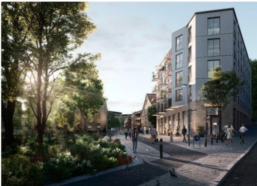
Det planerade huset sett från Renstiernas gata söderifrån (Belatchew arkitekter).