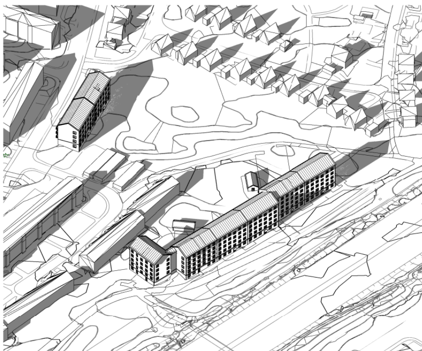
21 maj klockan 18.00