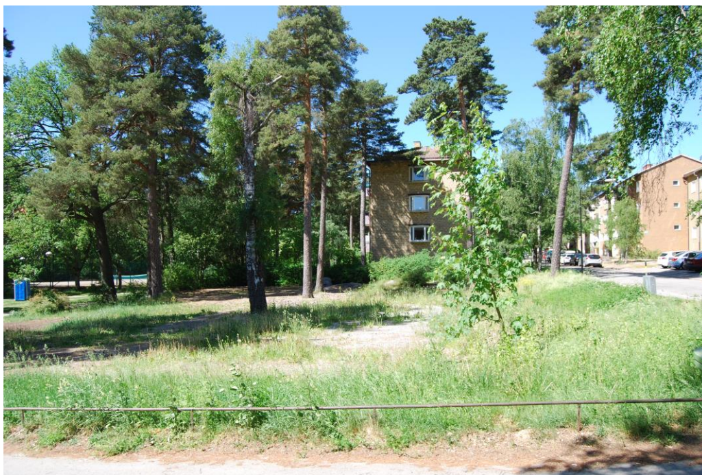
Förskoletomten mot nordväst, Grundtvigsgatan till höger i bild. Tomten sluttar svagt mot sydväst och parkstråket. Det finns flera mäktiga tallar på tomten.