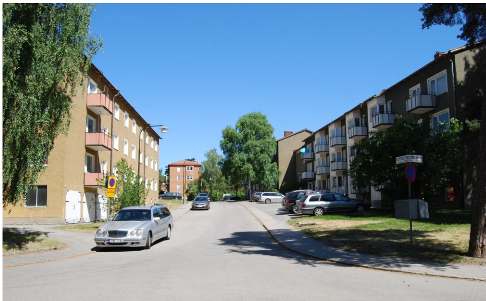
Korsningen Grundtvigsgatan-Kaj Munks väg. Kvarteren Upplänningen och Västgöten.