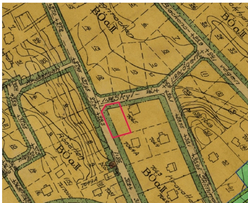
Utdrag ur gällande detaljplan PL 3310, aktuellt planområde är markerad med röd linje.