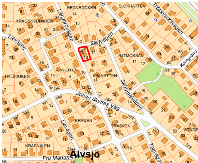
Fastigheten Kravatten 10, inom röd markering.

Planområdet omfattar fastigheten Kravatten 10 vars areal är 571 kvm. Kravatten 10 ligger inom stadsområdet Älvsjö och är belägen mellan gatorna Skylvägen, Långbrovägen och Skimmelvägen. Fastigheten är i privat ägo.