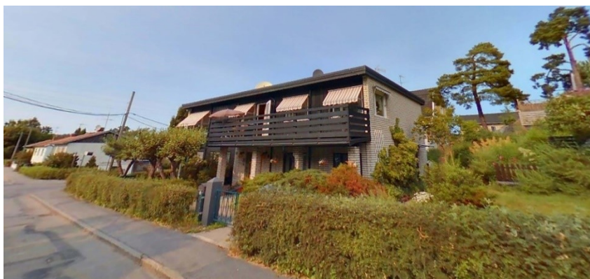
Vy från söder.

Befintligt bostadshus på fastigheten är idag inrett med tre bostäder. Bostäderna har separata entréer och är brandtekniskt avskilda. Det har tidigare konstaterats att bygglov inte kan ges i efterhand då gällande detaljplan endast tillåter två bostäder per fastighet.