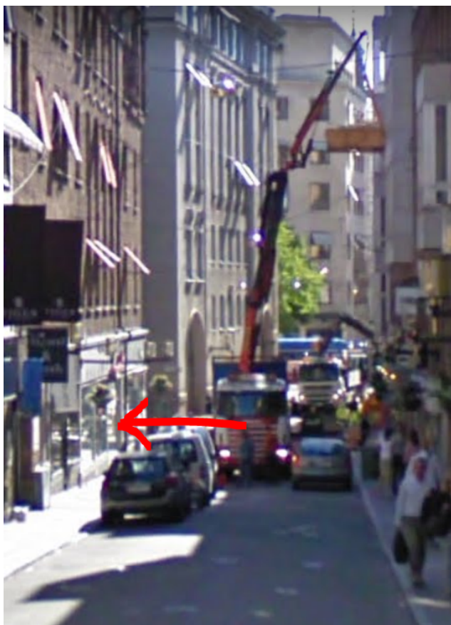
Röd pil visar var materialintag i stomkompletteringsskedet.

Beroende på vilken utformning av yttertaket som kommer att utföras så används olika metoder. Fasadernas öppningar kompletteras med fönster och partier när stagning är nere, restaureringen av fasaden går parallellt med stomkompletteringen.