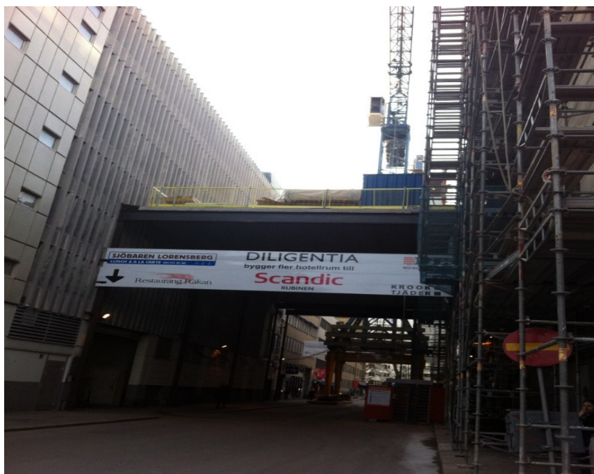
exempel på portal för logistik.