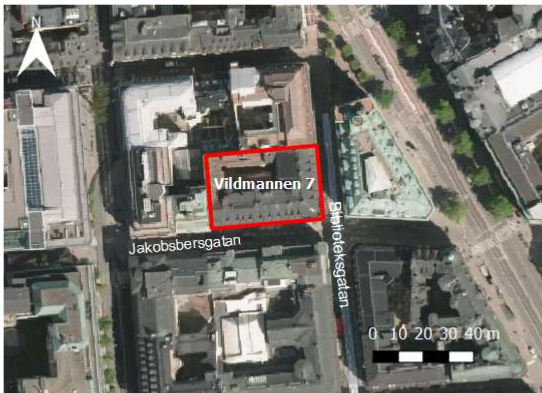
Figur 1. Översiktskarta som visar fastigheten Vildmannen 7 med röd markering.

Syftet med avfallsutredningen är att uppskatta ytbehov för avfallshantering samt antalet avfallstransporter som förväntas för fastigheten kv. Vildmannen 7. Fastigheten ligger i Norrmalm i Stockholm, se Figur 1 för lokalisering.