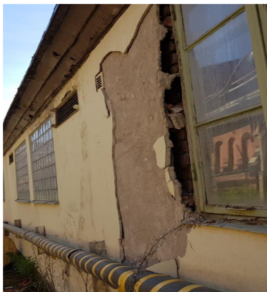
Bild 5. Samma område efter lagning maj 2019