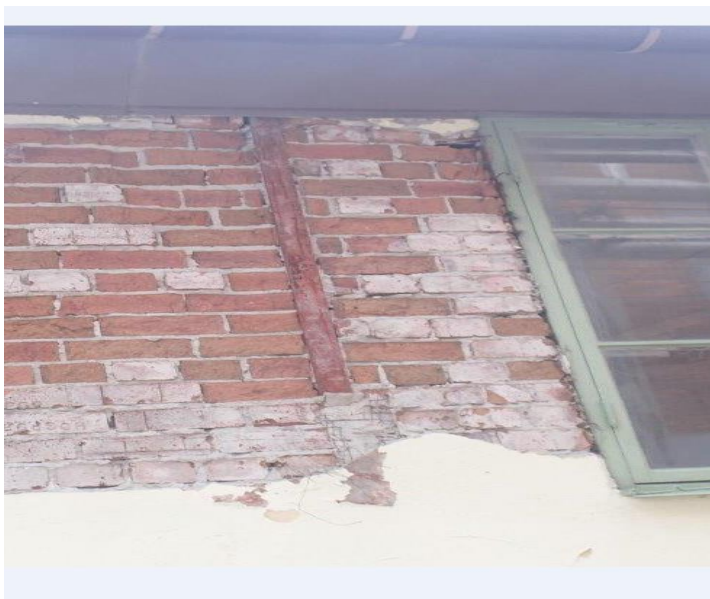
Bild 9. Norra fasaden 2014. Stålpelare ligger ytligt och utgör en köldbrygga.