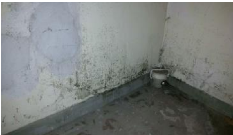
Bild 2. Påväxt på ytterväggar i källare

Källarytterväggarna uppvisar både saltutfällningar, påväxt och armeringskorrosion. Se bild 2 och 3. Betongplattan på mark uppvisar fuktskador.