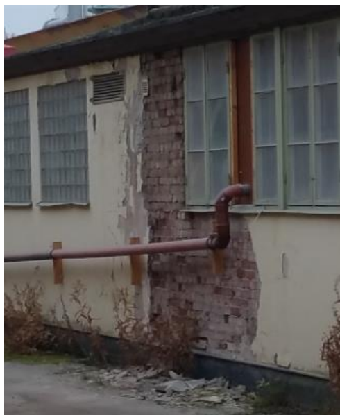
Bild 4. Putsskada 2014.

Samtidigt fortsätter väggarna att frysa sönder. Se bild 6 och 7.