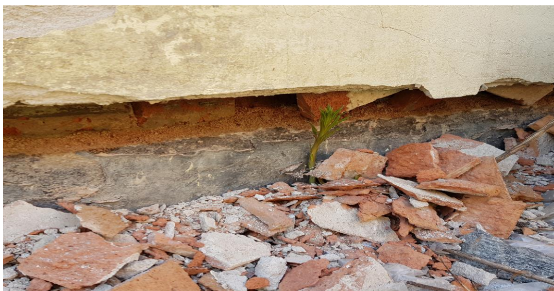
Bild 8. Samma fasad som på bild 5 från 2019. Teglet är genomblött och sönderfruset i maj 2019

Det verkar inte finnas något kapillärbrytande skikt mellan betongplattan och den murade väggen. Se bild 8.