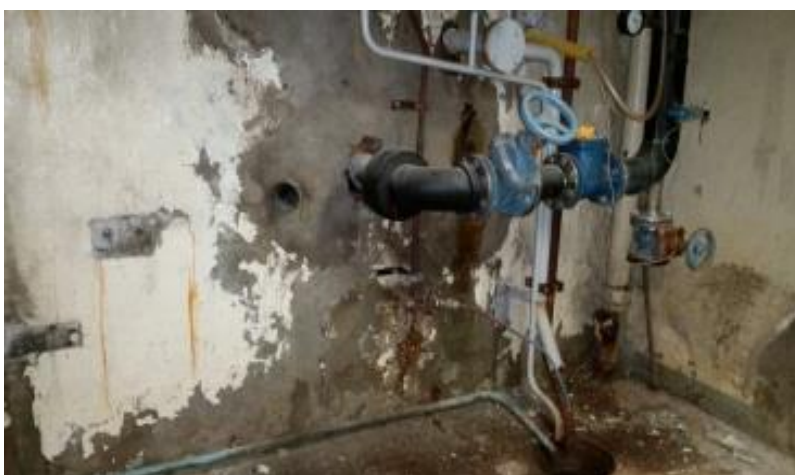
Bild 3. Rostsprängningar i källaren.