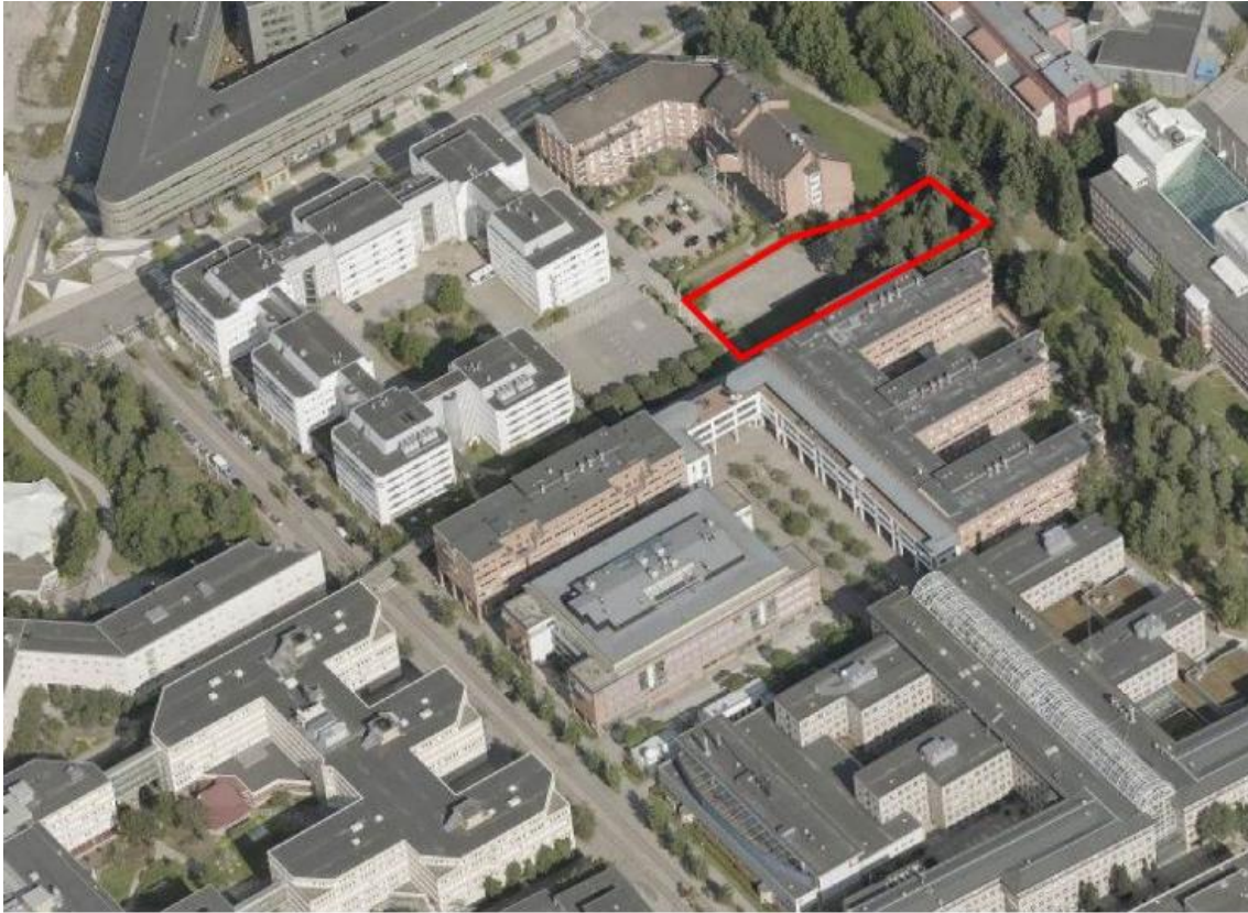
Figur 3. Vy över aktuellt planområde.