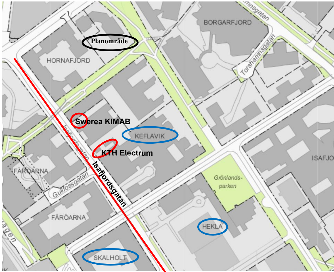
Figur 4. Riskkällornas och planernas lokalisering i förhållande till aktuellt planområde 11 . Den svartmarkerade är aktuellt planområde, de blåmarkerade de detaljplaner som nyttjas och de rödmarkerade är riskkällorna.