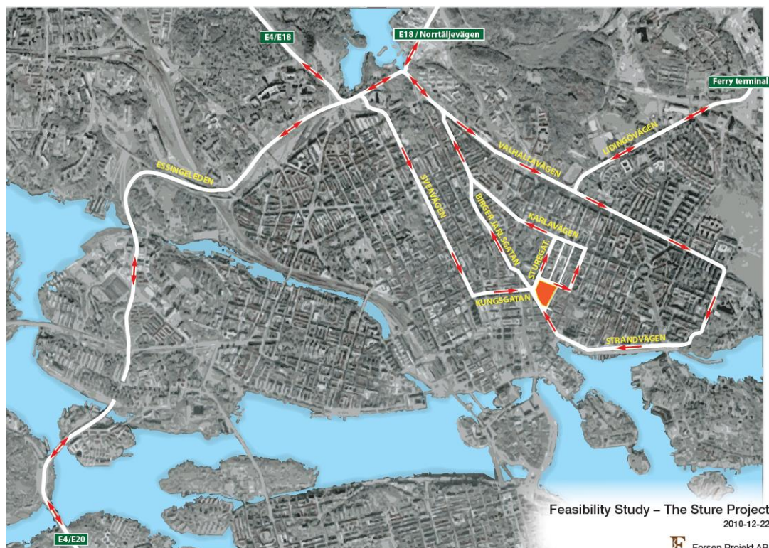
Figur 3 - Arbetsplatsens koppling till trafiknätet.

Under projektiden kommer trygghetsronder genomföras i närområdet kring byggarbetsplatsen. Trygghetsronderna syftar till att skapa en miljö kring arbetsplatsen där man skall känna trygghet och delaktighet. Frågeställningar som hanteras och dokumenteras i detta forum är belysning runt arbetsplatsen, avspärningar, tillfälliga konstruktioners påverkan på tredje man, informationsflöden ut till allmänheten m.m.