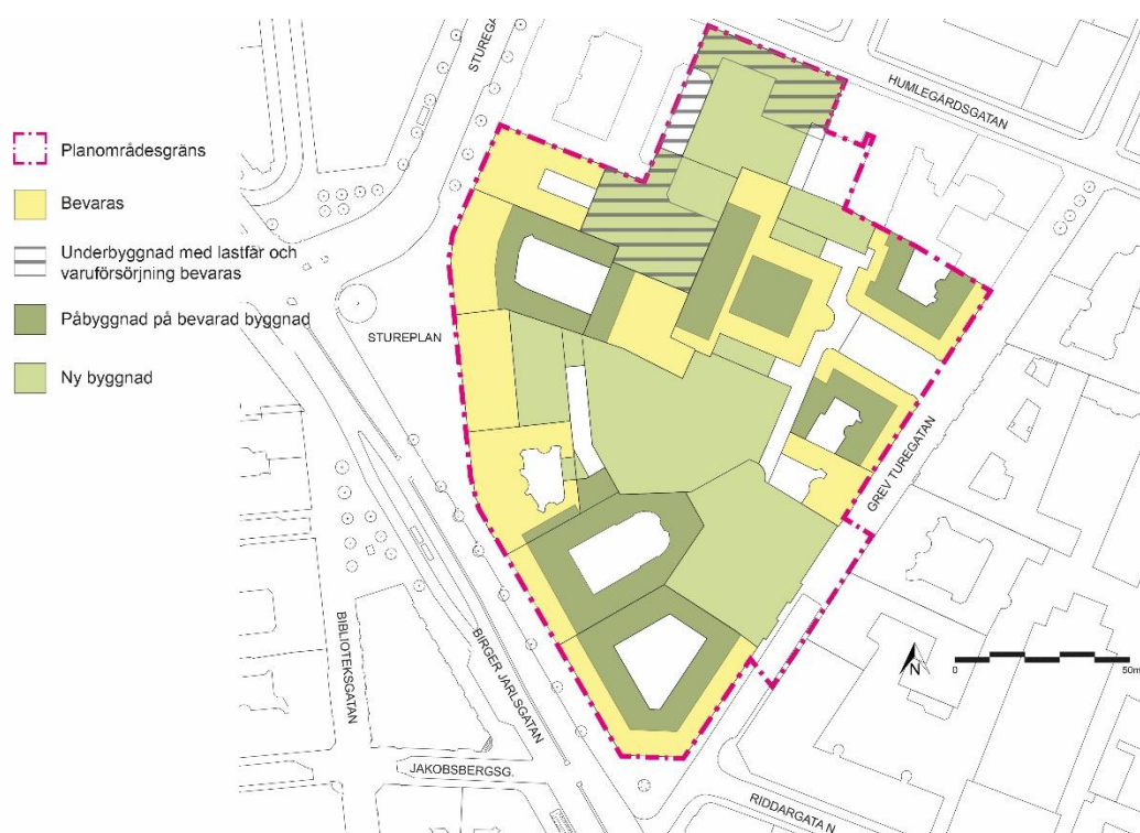
Figur 1. Bevarande och nybyggnation inom planområdet

Huvudprinciperna för genomförandet är att starta arbetena i den södra delen av planområdet först. Arbetena i den södra delen av planområdet omfattar både renovering av huskroppar som ska bevaras samt rivning och nybyggnation av nya huskroppar. Verksamheterna i den norra delen av kvarteret bedöms kunna fortsätta som normalt under byggnationen av den södra delen. För att möjliggöra detta kommer lastfaret med infart från Humlegårdsgatan att hållas öppet under hela genomförandet för att säkerställa en hållbar logistik kring och inom planområdet för pågående verksamheter.