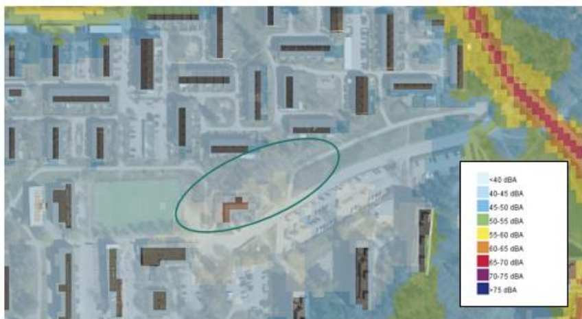
Karta 1 Utdrag ur Bullerkartläggning Stockholm för 2012 (miljöförvaltningen).

Enligt stadens bullerkartläggning ligger de ekvivalenta nivåerna under 40 dBA, men då har Falkholmsvägen inte räknats med. Miljöförvaltningen har inte några trafikflöden från Falkholmsgränd utan utgår från en schablon på 200 fordon per dygn. Beräkningar av bullernivåerna visar på ekvivalenta nivåer på 42 dBA vid 2 meters höjd och 45 dBA vid 9 meters höjd.