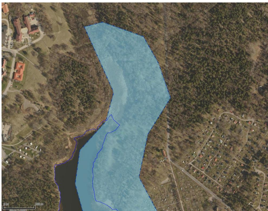
Strandskydd Orhem. Länsstyrelsens beslut 1999-06-03