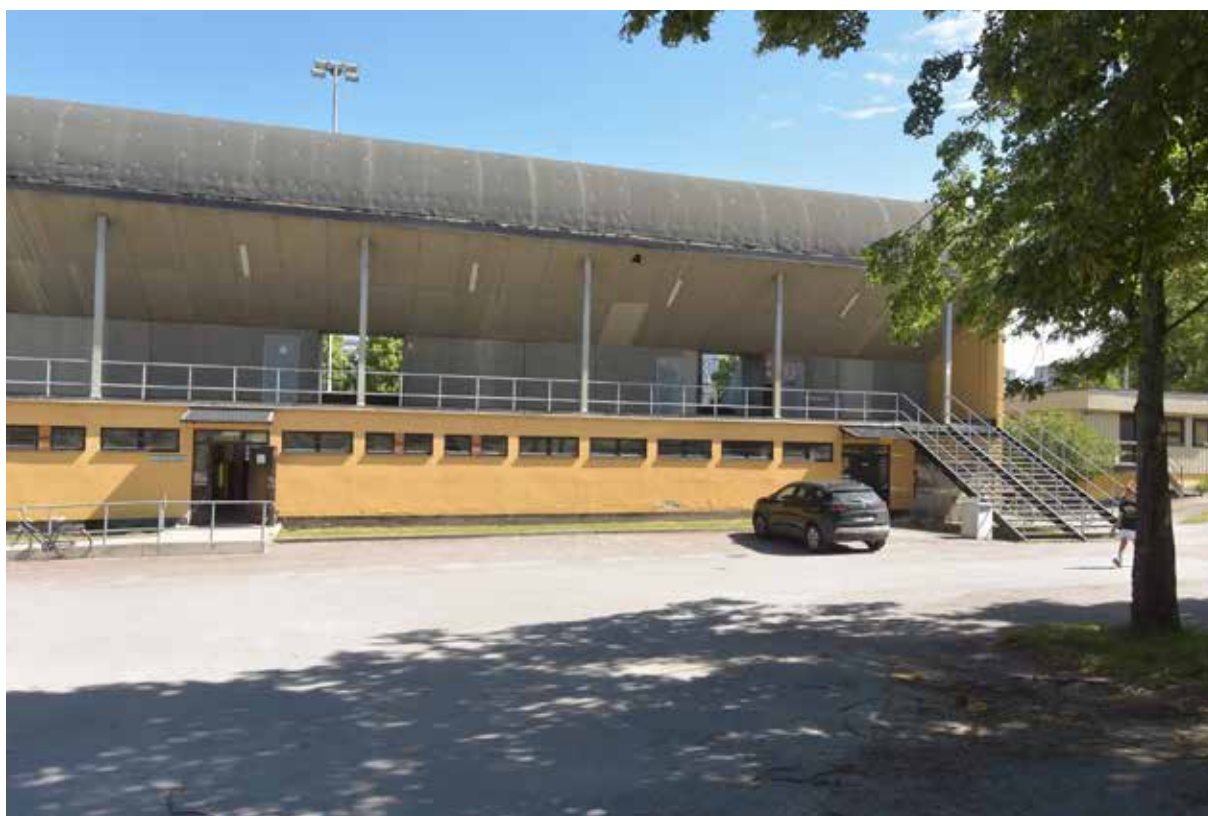
Läktarbyggnadens södra del. Invändigt byggdes denna om runt 1982 och troligen byttes även fönster och dörrar vid detta tillfälle. Notera den ena av de två fritrapporna till vänster.