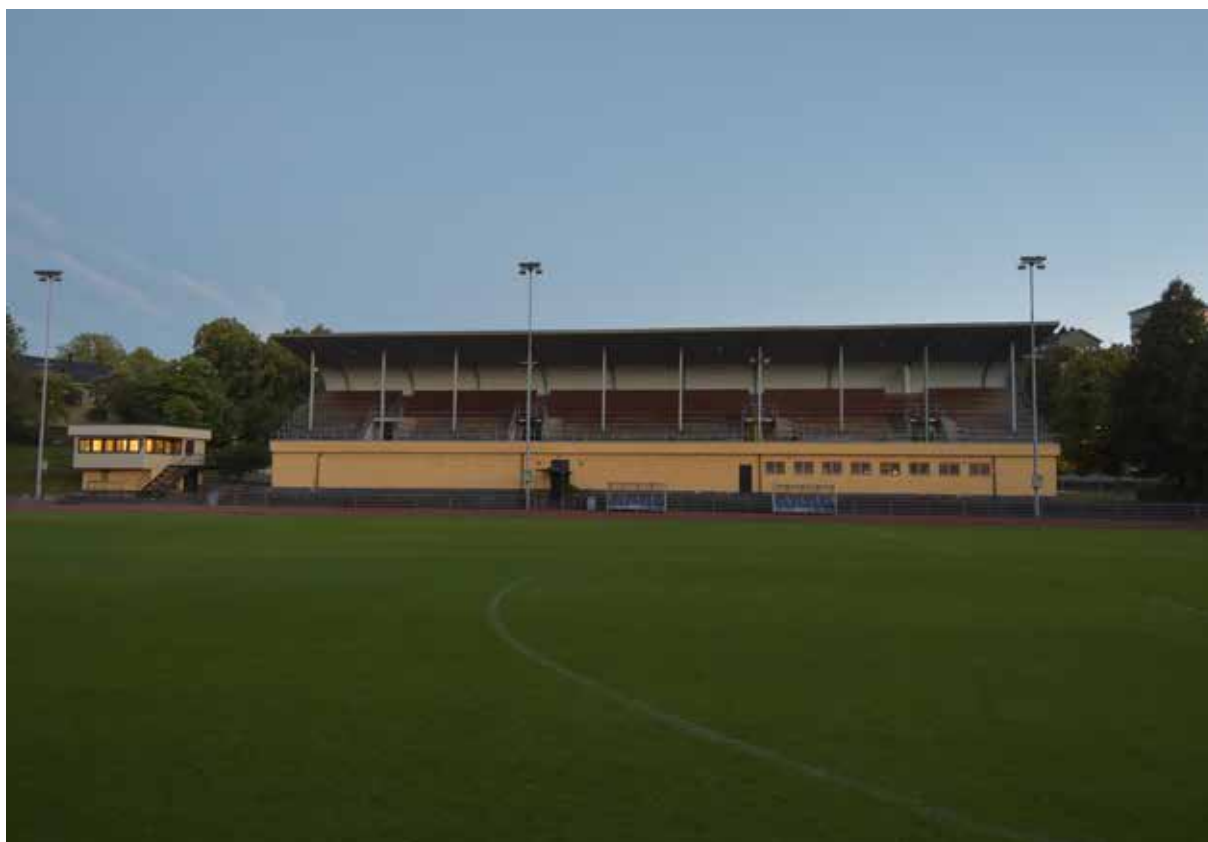
Läktaren sedd från nordost. Till vänster ligger måldomartornet.

Läktarbyggnaden är utförd i en mycket välgestaltad och dogmatisk funktionalism. Läktarna är stålkonstruktioner som står över den gjutna bottenvåningen som närmast är ett rätblock utfört i betong försett med fönsterband mot planen och entrésidan. Över bottenvåningen står läktaren, uppförd i en stålkonstruktion. Konstruktionselementen är pelare av H-balk, som bär lutande stålbalkar som utgör bärning för golvet. Läktarens konstruktionsdelar i metall är sammanfogade med nitförband med kupolnit. Konstruktionen har tvärgående stålbalkar med kortlingar av träbalk. Läktargradängerna är byggda av trä i trappstegsform, den bakre delen av sittytan på det ena planet utgör gångyta för nästa nivå.