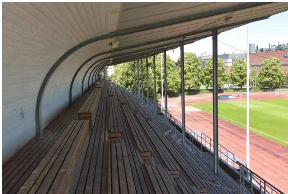
Vy mot nordväst. Läktarens tak utgörs av svängda stål balkar som är stöttade i framkant av stolpar av stålprofiler. Innertaket består av masonit. Inbrädningen till vänster i bild är möjligen sekundär. Läktargradängerna av trä.