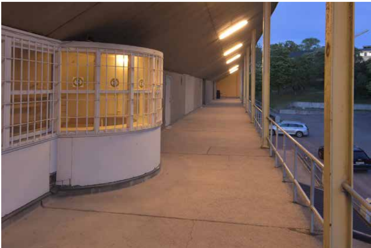
Läktargången, den halvrunda byggnaden är en serveringskiosk och garderobe. I den finns en mathiss ner till köket.

Läktarplanets baksida utgör en publikgång med öppningar till de fyra uppgångarna till läktaren. Detta utrymme har karaktären av en stor altan där den lutande läktaren bildar ett tak. Taket är eternitklätt och mot golvet noterar man fint utförda avtäckningar i kopparplåt. Räckena på trappan och läktargången består av svetsade stålrör. Mot norr finns det under läktaren en låg inbyggd serverings- och garderobskiosk. Den östra delen utgörs av en serveringskiosk med ett rundat burspråk med serveringsluckan i mitten. Den västra delen utgörs av en garderob, som på en teater. Denna betjänas via sash-windows. Inne i serveringskiosken finns även en mathiss ner till köket i läktarbyggnadens bottenvåning.