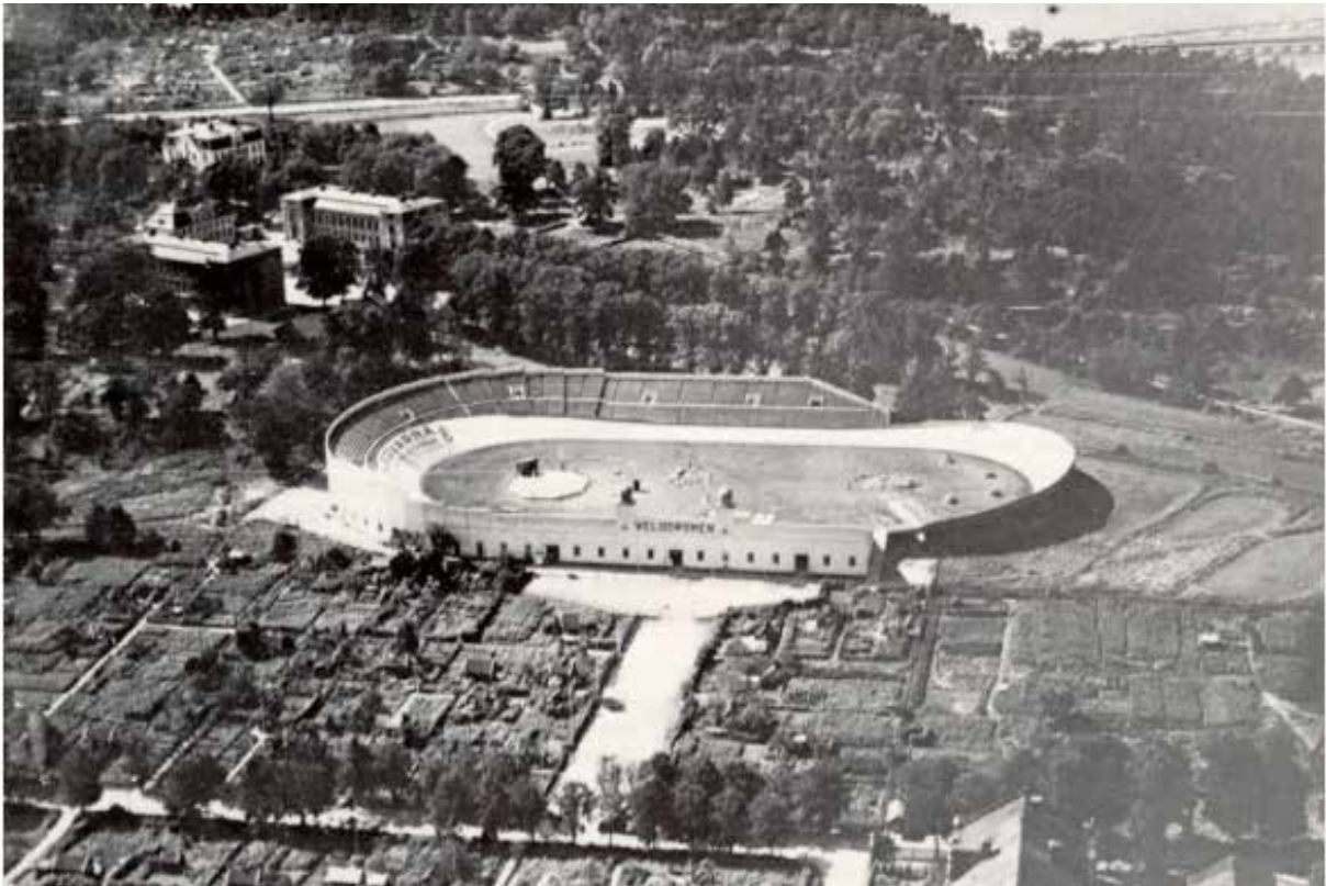
Flygfoto av cykelvelodromen som fanns på platsen åren 1923-1931. Lägg märke till trädallen som leder upp till Kristinebergs slott, vid tiden barnhem.