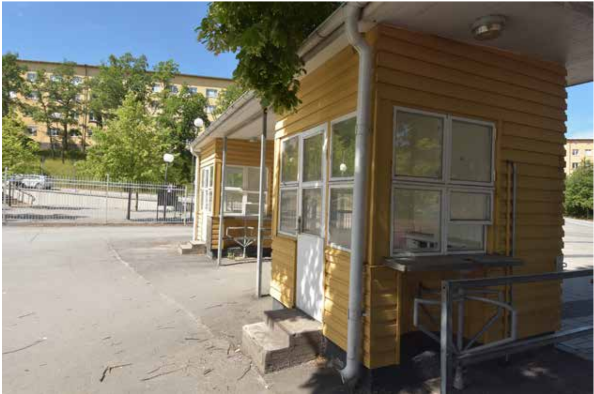
Biljettkioskerna sedda från insidan av området. Kioskerna har inga fönsteröppningar ut mot gatan. Biljettluckorna är hitåt. Notera vändkorset som går in i en nisch i väggen.