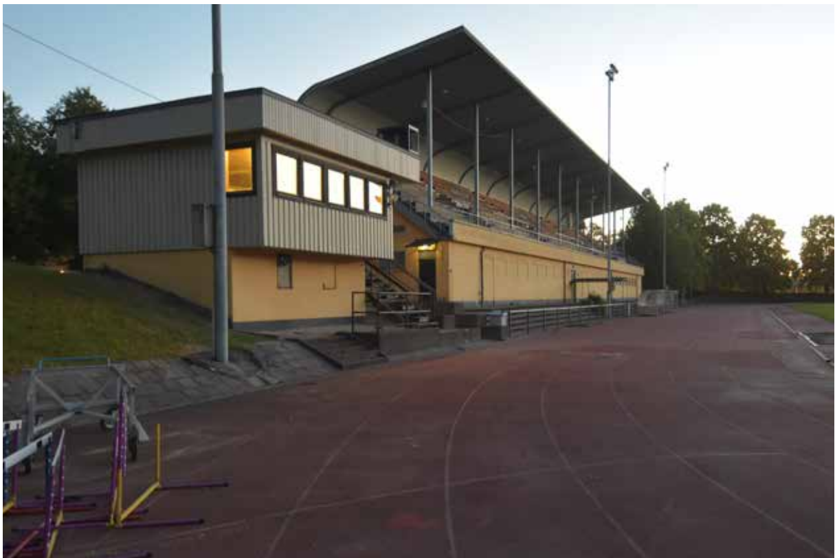
Måldomartornets och läktaren. Byggnaderna relaterar på ett likartat sätt till banorna. Måldomartornet har anpassats till läktaren genom sockelväningens kulör och frontfasadernas läge.

Intill läktaren ligger den så kallade regibyggnaden, eller måldomartornet vilket uppfördes kring 1980. Byggnaden ritades av Spifa idrottsplatskonsult. Detta är en byggnad från vilken man kan bevaka målgången vid löpartävlingar. Mot banan finns ett hörn som ligger exakt i mållinjens förlängning, där fanns en målkameras. I byggnaden finns också ett speakerrum och en expedition. Byggnaden är uppförd på en gjuten sockel i souterräng med betongfasader, och har ytterfasader av lockpanel. Taket har parapetkant och det är belagt med papp. Från löparbanorna leder en trappa upp till byggnaden. Interören består av golv av platismatta, målade väggar av spånskiva och innertak av glesmonterad furupanel.