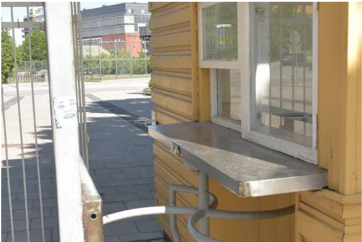
Entrén till idrottsplatsen med biljettluckan.