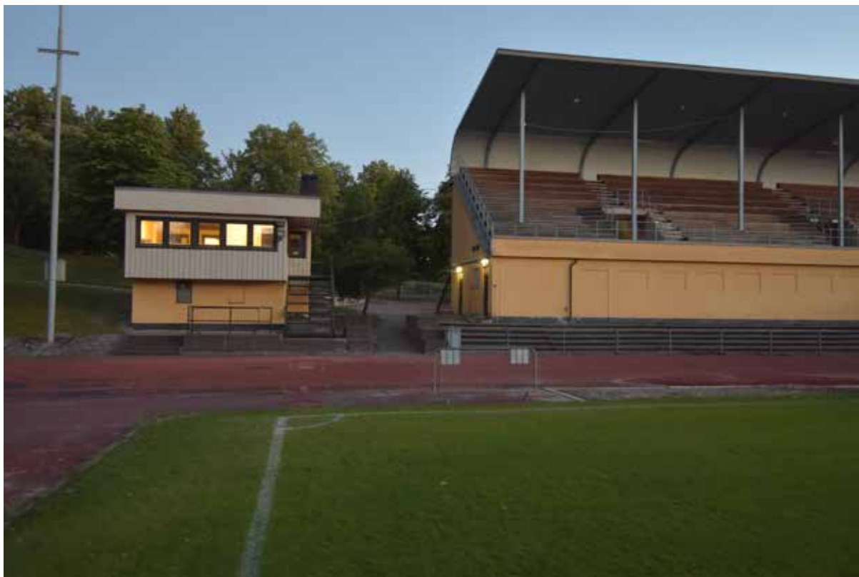
Måldomartornet och läktaren södra del från fotbollsplanen.