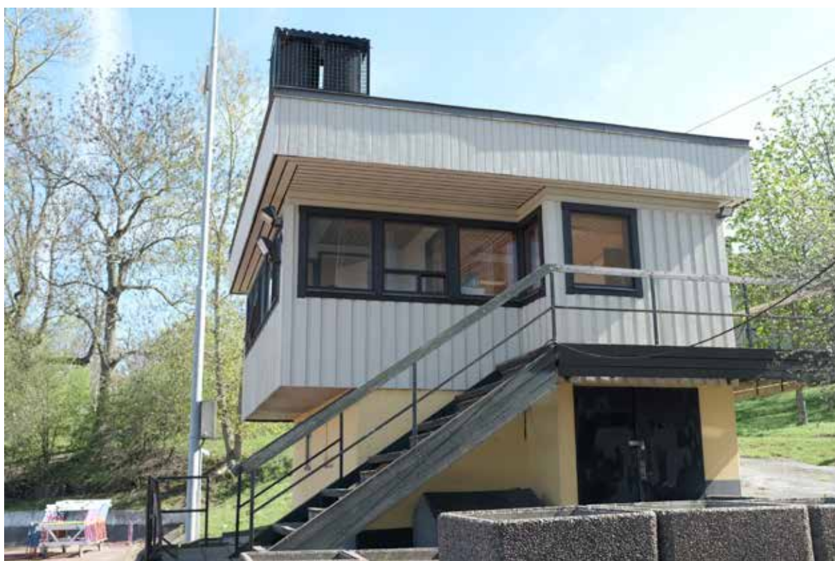
Måldomartornet sett från norr, i burspråket ovan trappan så satt målkameran.