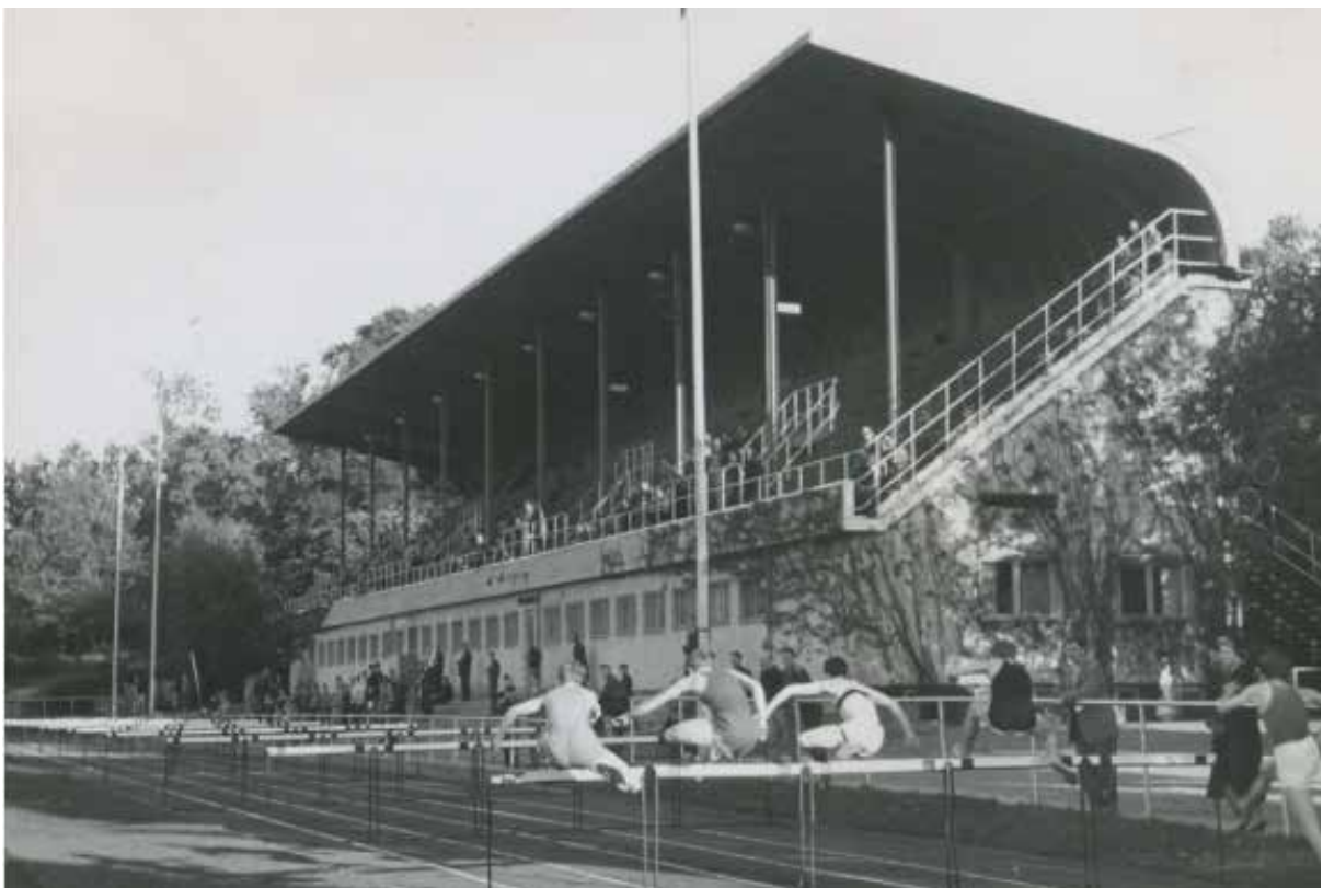
Häcklöpning på Kristinebergs idrottsplats, troligen 1930-tal.