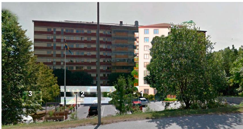
Inlämnat bildcollage som visar den föreslagna alternativa placeringen av punkthuset.

sankmark där. Servicehuset lider redan av problem med stora sättningar i fastigheten som en följd av detta. Den alternativa placeringen av huset förmodas även skapa en gårdsliknande inramning. 2