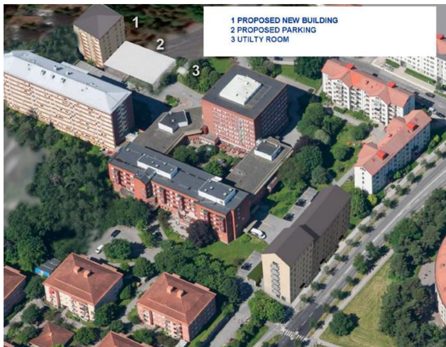
Inlämnat bildcollage som visar det alternativa förslaget.

Stadsbyggnadskontoret bedömer att det inte var möjligt att gå vidare med det alternativa förslaget, då tomträttsinnehavaren inte vitsat intresse för att bygga bostäder där i dagsläget. Detta är det huvudsakliga skälet till att alternativet inte är möjligt att pröva i denna planprocess.