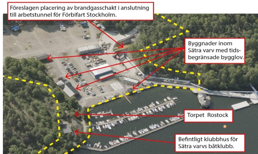
Flygfoto med markeringar av befintlig bebyggelse samt föreslagen placering av teknikbyggnad i anslutning till Förbifart Stockholm.