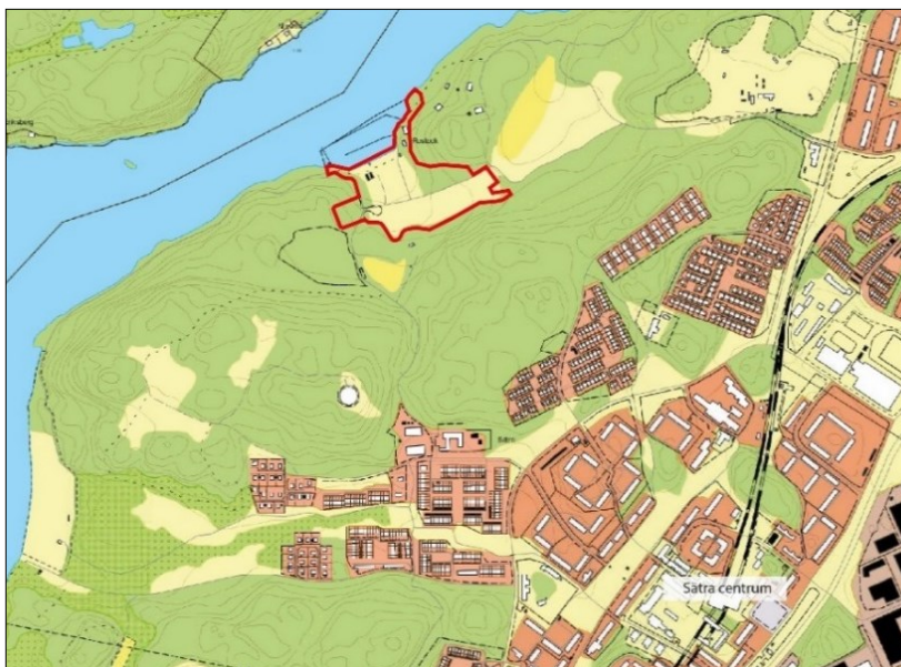
Orienteringskarta med ungefärligt planområde markerat i rött.