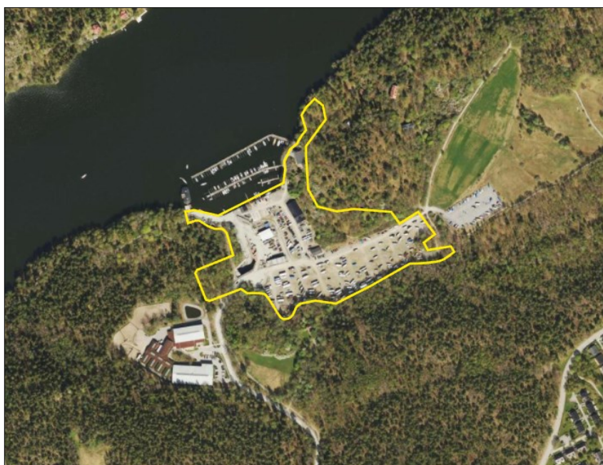
Ortofoto från 2016 med ungefärligt planområde markerat med gul linje.

I öster och i söder avgränsas planområdet av skogs- och ängsmark inom Sätterskogens naturreservat. I väster avgränsas planområdet av Mälarhöjdens Ridskola samt skogsmark, och mot norr av vattenområden inom Mälaren med befintlig brygganläggning inom Sättra varv.