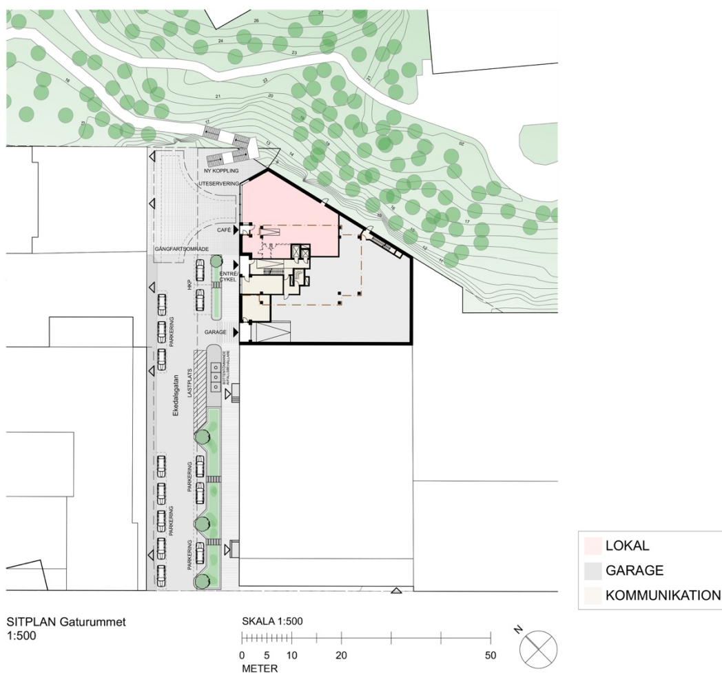
Figur 1 Situationsplan för Ekedalsgatan med radie för back-vändning inritad. Utanför vändytan går det att möblera, skapa sittplatser och eventuell uteservering.

Ekedalsgatan skyltas från Lindhagensgatan som återvändsgata där vändplan saknas för att minska felkörningar och onödig trafik. Området närmast fasad vid Gångaren 10 fredas från backande fordon genom pollare. Markbeläggningen kan användas för att ytterligare signalera låg hastighet och avsedd användning.