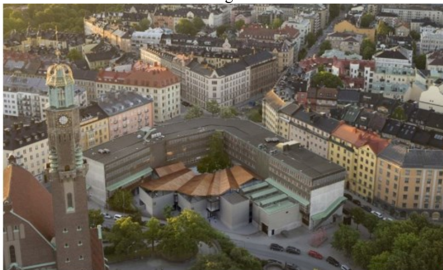
Fotomontage som visar lågdelen nya tak.

Byggnaden kommer att öppnas upp för publika matrelaterade mindre verksamheter samt biutrymmen, cykelrum och teknikrum i markplan. Då verksamheterna är småskaliga beräknas de inte alstra mer biltrafik eller någon större ökning av transporter som varuleveranser och avfallshämtning.