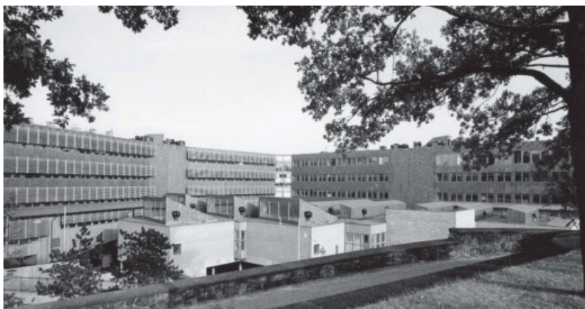
Lågdelen före branden. Det kopparklädda taket hade stora lanterniner.

En brand 2011 totalförstörde den låga ateljédelen. Av lågdelen finns bara verkstadsdelen i byggnadens sydvästra ände kvar förutom betongstensmurarna längs fasadernas ytterliv. Hösten 2015 flyttade Arkitektskolan vid KTH sin verksamhet från byggnaden till nya lokaler inom KTH Campus.