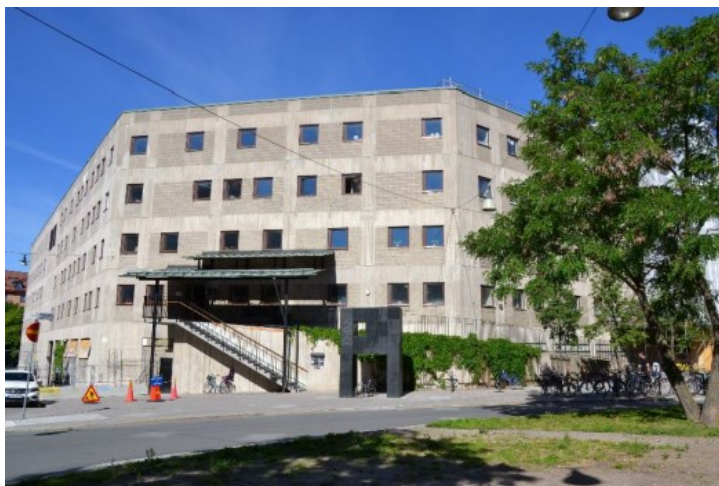
Entréfasad till före detta Arkitekturskolan.