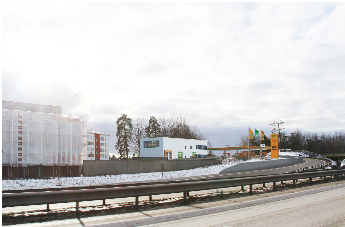
illustration ny station sedd från Södertäljevägen