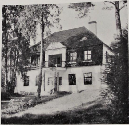
Ägare: Lundin, Margit, fru.

Läge: Villa Lövdala, Fagersjö. Byggnadsår: 1911–12. Byggnadsmaterial: Tegel. Storlek: 9 rum och kök samt 2 hallar, badrum, serveringsrum och garage. Uppförd för ägarens räkning. Arkitekt: Ingenjör Lundin. Anmärkningar: Tomten planerad och plante- rad av ägaren med fru. Vackra terrassanläggningar samt pergola och simbassäng.