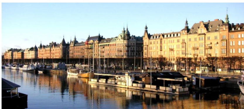
Vy från Djurgårdsbron

Strandvägen och dess kaj är en av Stockholms mest praktfulla och storslagna gatumiljöer. Bostadsbebyggelsen, lindallén och den stenlagda kajen ger ett välordnat och sammanhållet avslut på stenstaden.