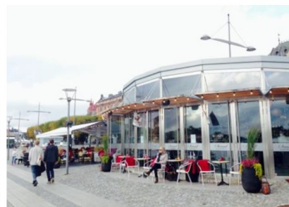
Bilder på väl gestaltade verksamheter som bidrar positivt till stadsbilden.