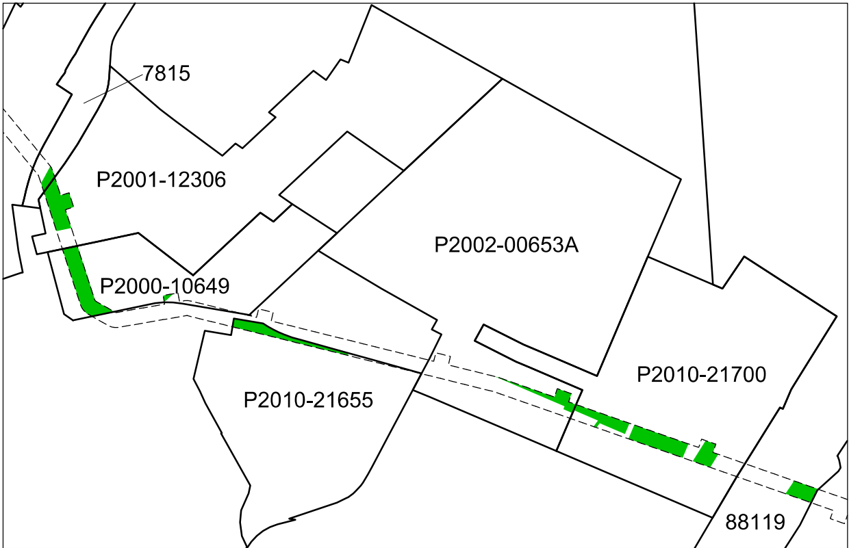
Angivna detaljplaner som berörs av ÄDp Eolshäll till Sickla, del 6. Ändring under mark görs inom de grönmarkerade områdena. Ändring görs endast på kvartersmark.