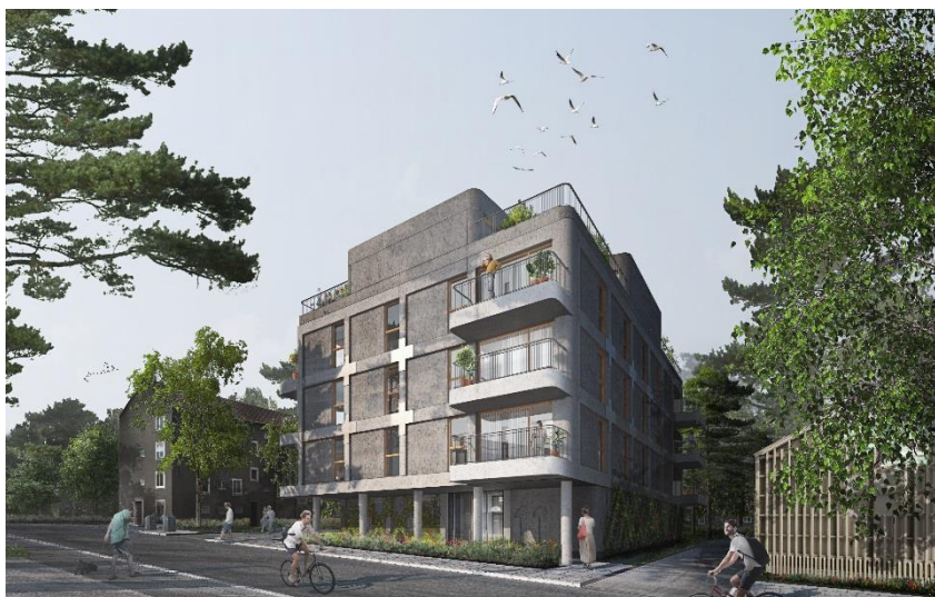
Vy från Vikstensvägen.

Den föreslagna byggnaden är ett lågt punkthus som placerar sig utmed Vikstensvägen med en tydlig bostadsentré mot gatan. Byggnaden har en egen identitet samtidigt som den inordnar sig i de stora dragen i Kärrtorps struktur. Byggnaden har förgårdsmark mot gatan, den ramar in gården samtidigt som den håller öppet kopplingar och siktlinjer mellan gata och gård. Byggnaden har fem våningar vilket ger 17 lägenheter, med 2- och 4-rumslägenheter.