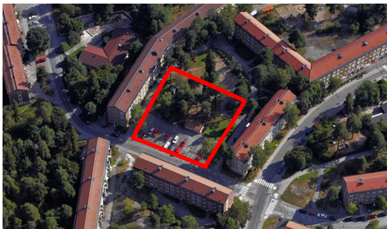
Flygfoto från norr, ungefärligt planområde markerat med röd linje.