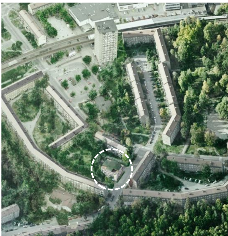
Vy från söder. Den föreslagna byggnaden inringad.