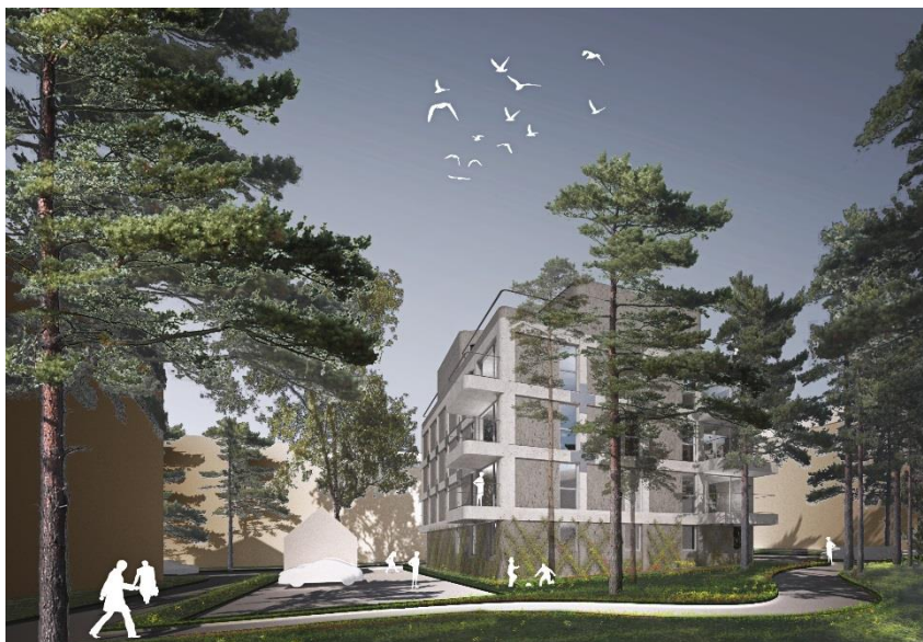
Vy från gården.

Gårdens grönska bevaras i så stor utsträckning som möjligt. I detaljplanen skyddas några tallar som är viktiga för gårdens karaktär. Det finns fler träd som har en positiv inverkan på gården, dessa ska bevaras i största möjliga mån. Berghällen sydöst om den nya byggnaden kommer att finnas kvar. Upprustning av gården kommer att ske i samband med genomförande av projektet.