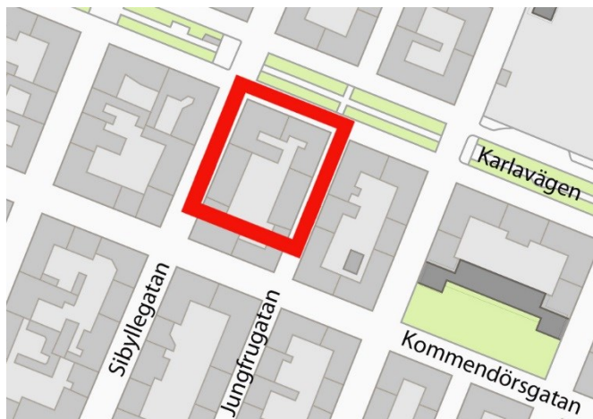
Planområdet markerat med en röd rektangel.

Planområdet omfattar fastigheten Ynglingen 10 i sin helhet, belägen mellan Sibyllegatan, Karlavägen, Jungfrugatan och fastigheterna Ynglingen 1 och 2. Planområdet omfattar cirka 3250 m 2 och ägs av Fabege Stockholmsynglingen AB.