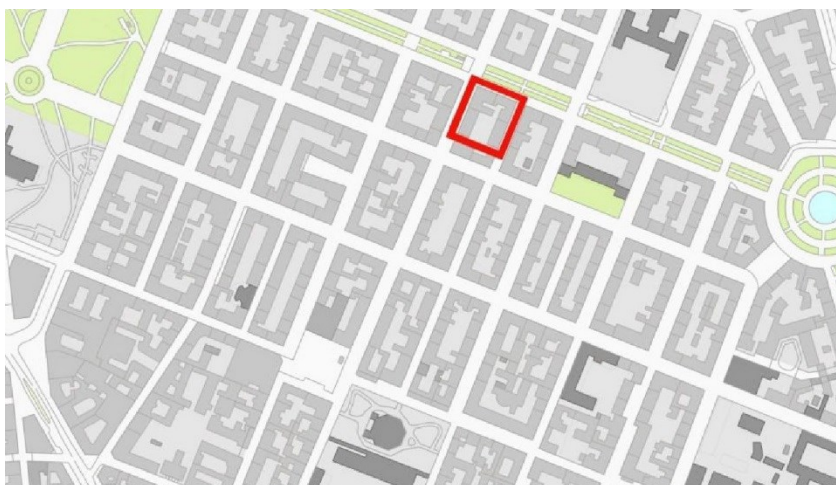
Planområdet markerat med en röd rektangel.