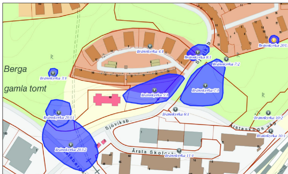
Figur 1. Fornlämningar i området. Brännkyrka 5:1, 6:1, 7:1 och 8:1 utgör det så kallade Bergagravfältet. Utredningsområdet motsvaras av Brännkyrka 5:1. Utdrag ur FMIS, återges här ej skalenligt.

Seniorgården AB har inlett ett detaljplanearbete för delar av fastigheten Årstaberg 1. Stiftelsen Kulturmiljövård (KM) fick förfrågan att genomföra en utredning etapp 1 och 2. Detta innebar att arbetet inleddes med en arkivstudie (etapp 1) på Antikvarisk-topografiska arkivet (ATA), och att fältarbete (etapp 2) skulle genomföras så fort marken var snö- och tjälfri. Fältarbetet i form av etapp 2 kom inte att genomföras då det vid arkivstudien visade sig att nu aktuell yta inom fornlämningen Brännkyrka 5:1 redan var undersökt och borttagen av Stockholms stadsmuseum 2003.