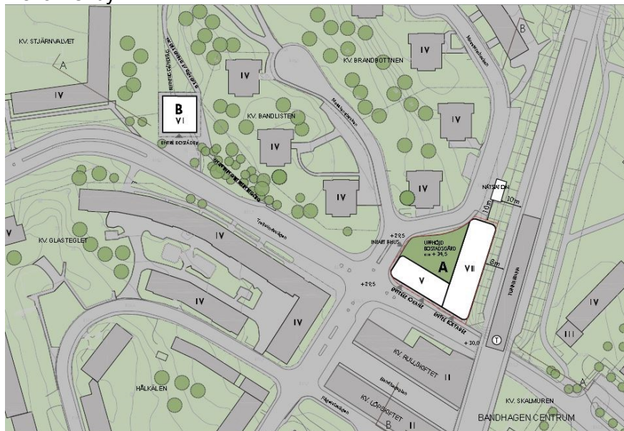
Bilden visar ett förslag från Wallenstam på möjlig ny bebyggelse inom del av Örby 4:1

I Wallenstams markanvisade område i del av Örby 4:1 föreslås i det östra läget närmast tunnelbanespåren en ny byggnad med en "V-form" (Hus A i situationsplanen ovan). Byggnaden består av en 5 våningar hög del mot Trollesundsvägen, och en 7 våningar hög del längs med tunnelbanespåren, då läget bortvänt från vägen bedöms kunna vara lämplig för en något högre höjd. Bottenvåningen i denna