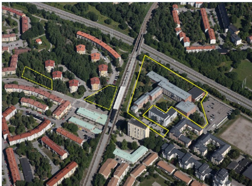
Ovan: Flygfoto med ungefärlig avgränsning av det aktuella planområdet nära Bandhagen C.

Ett program för en del av Trollesundsvägen "Program för område utmed Trollesundsvägen i Bandhagen" togs fram under 2013, vilket omfattar projekten Diabilden, Färgfilmen, Kopieramen, Framkallningen och Lådkameran. Detta planområde ingår inte i programområdet, men är beläget i mycket nära anslutning, varför programmet utgör ett viktigt underlag.