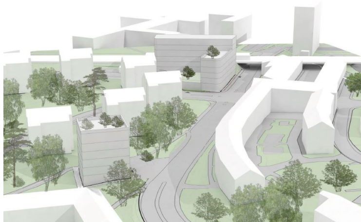
Skiss över föreslagen ny bebyggelse inom Örby 4:1 (grå byggnader)

Punkthuset relaterar till befintlig punkthustypologi med sina dimensioner i fotavtryck och höjd samt indrag från gatuliv, men kan genom sin gestaltning utgöra ett nytt, självständigt tillskott på platsen. Gestaltning och utformning studeras i det kommande planarbetet.