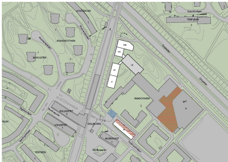
Bilden visar ett av Svenska Hus förslag på möjlig ny bebyggelse inom Ramsökaren 2 & 4. Brun skraffering visar förslag till placering av garage, blå skraffering visar placering av sophanteringslösning.

Inom Svenska Hus markanvisade område föreslås en ny byggnadskropp längs med Trollesundsvägen och en tillbyggnad på det befintliga huset inom Ramsökaren 2.