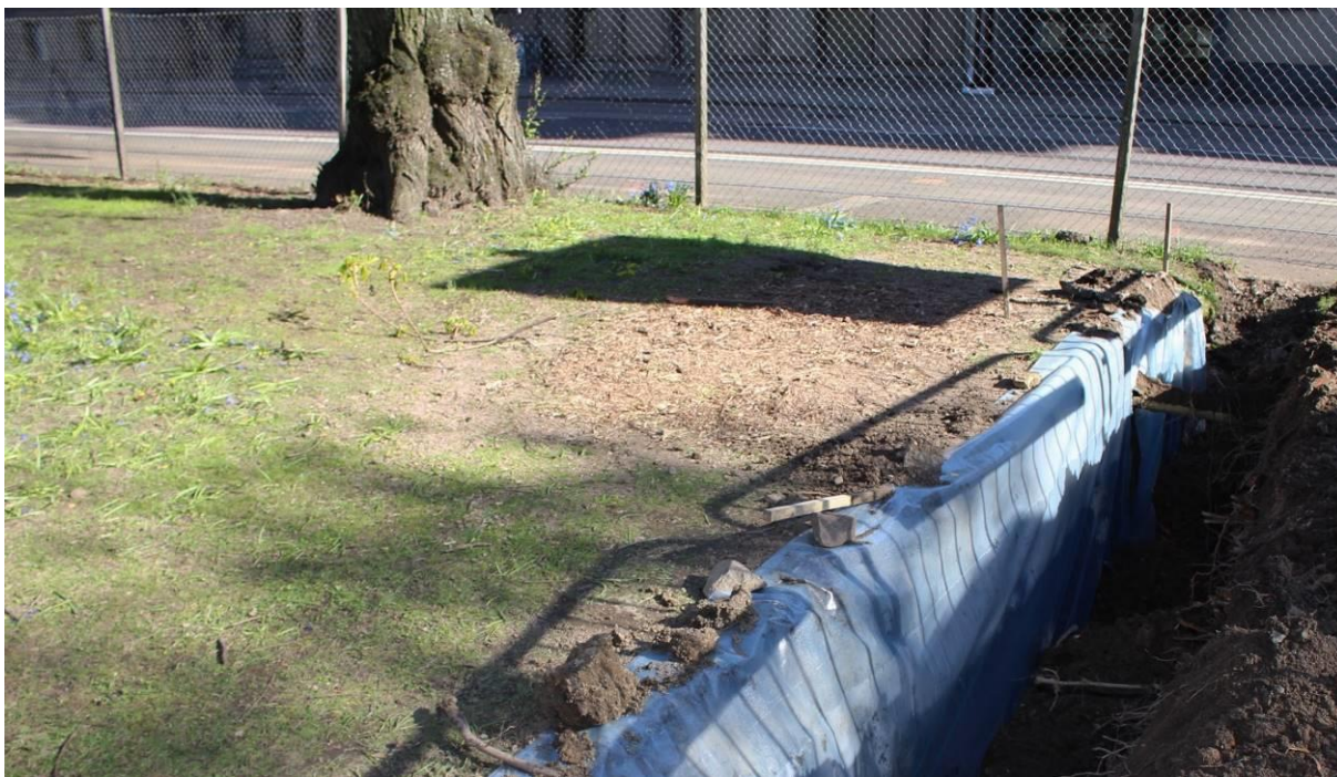
Bild 5. Rotdraperi av plast vid schaktvägg för att motverka uttorkning av jord och beskurna rötter.