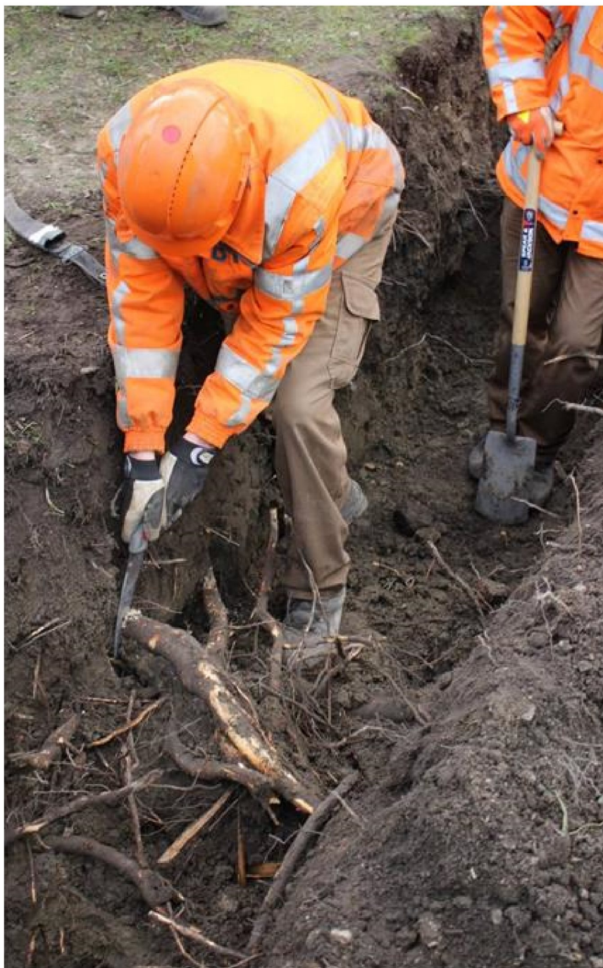
Bild 3. Trädrötter som måste avlägsnas vid schakt beskärs med beskärningsverktyg (handsåg).

VIÖS AB Kaunasvägen 42 352 49 Växjö Telefon 0470-65784 Telefax 0470-XXXXXX