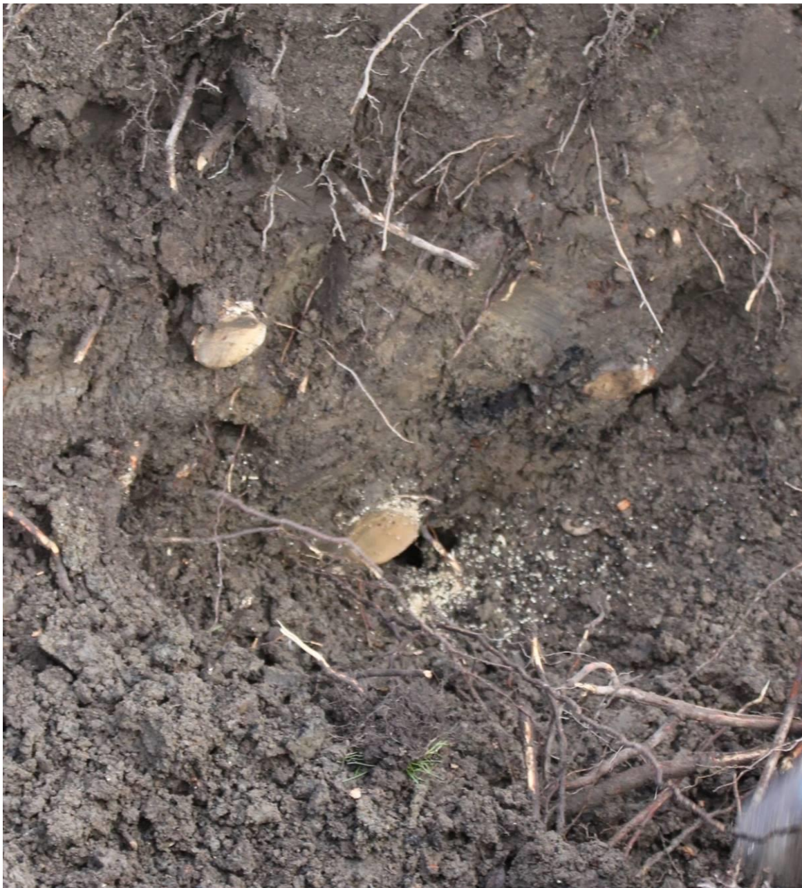
Bild 4. Korrekt beskurna rötter vid schakt.

Vid schakt med frilagda eller kapade trädrötter där återfyllning ej sker inom en timme ska rötterna täckas för att behålla fuktigheten. Detta ska göras i form av ett rotdraperi uppbyggt av t.ex. presenning, plast, geotextil eller juteväv (Bild 5). Täckningsmaterialet ska avlägsnas före återfyllning.