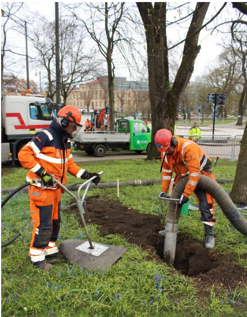
Bild 2. Skonsam schakt med tryckluft och vakuumsugning nära träd.

Vid avlägsnande av berg intill träd (avstånd 5-10 m från ytterkant av stammen) ska försiktig sprängning utföras (sprängning med tät sömnad). Alternativt kan vajersågning användas. Rötter som friläggs, oavsett vald metod, ska alltid hållas fuktiga och vid behov vattnas tills det att återfyllning av schaktgrop skett. Vid schakt där grövre rötter måste avlägsnas ska dessa kapas med beskärningsverktyg (sekatör eller såg) (Bild 3 & 4).