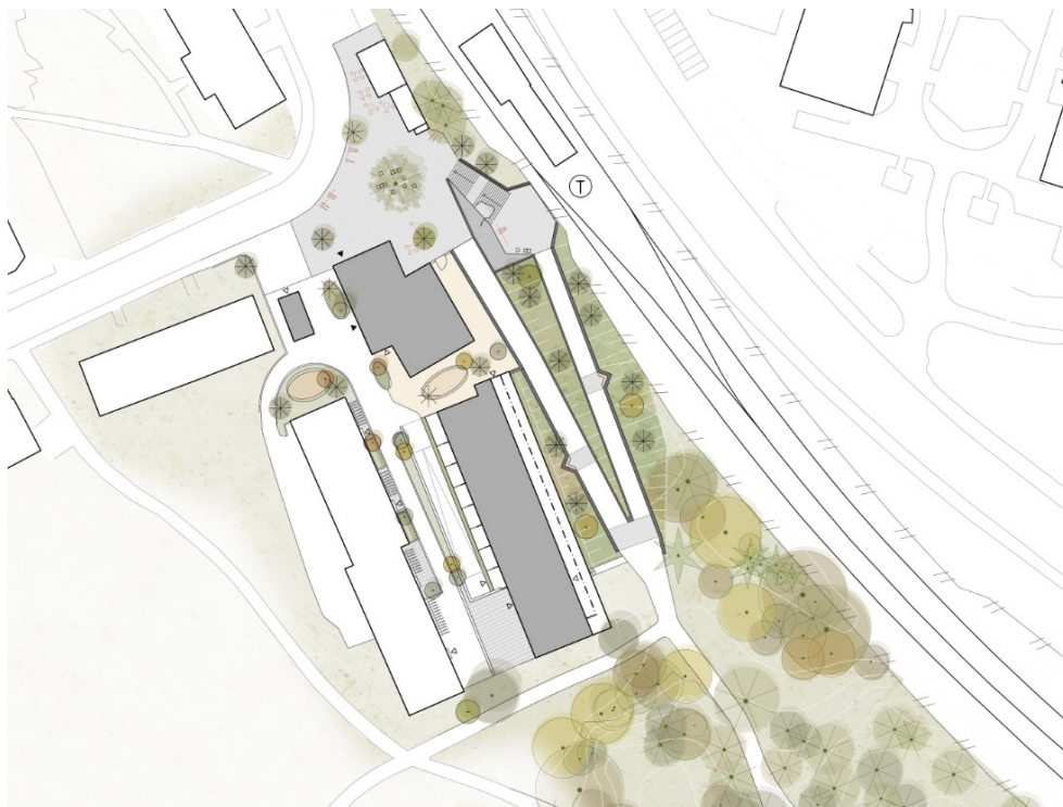
Illustrationsplan över bebyggelse vid kv Kavringen (bild: LAND Arkitektur)

Följande kvalitetsprogram för gestaltning utgör ett komplement till planbestämmelser och planbeskrivning i detaljplan för Kavringen 1 mm avseende bebyggelse vid kv Kavringen. Upprättandet av kvalitetsprogrammets motiveras av bebyggelsens exponerade läge vid tunnelbaneentrén och närheten till Hökarängen centrum och dess kulturhistoriskt värdefulle bebyggelse, som kräver särskild omsorg om gestaltningen – helhet såväl som detaljer. Syftet är att lägga fast en kvalitetsnivå som staden och byggherren gemensamt enats om. Inom ramarna för denna kan sedan mindre förändringar göras, om de kan ske med bibehållen eller högre kvalitet. Kvalitetsprogrammet godkänns av stadsbyggnadsnämnden i samband med antagande av detaljplanen och utgör därefter vägledning för projektets bygglovprövning.