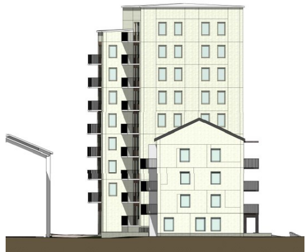
Fasad mot söder.