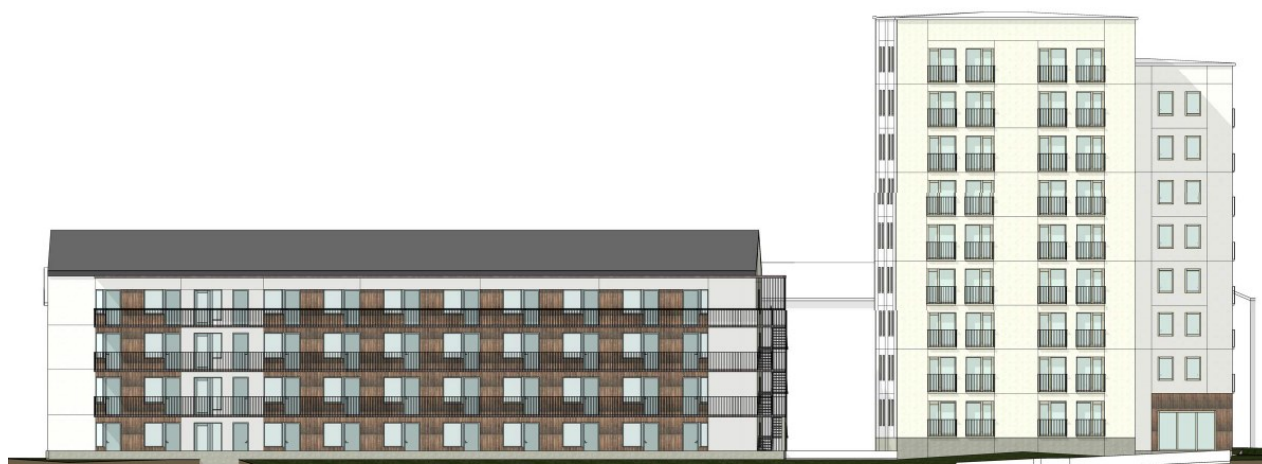
Fasad mot öster, mot tunnelbanan.

Passagen och gården utformas så att miljön får en enkel, småskalig och lummig karaktär och avslutas med en gårdsplan i öster mot naturen. Nya träd och planteringar är med och skapar en grön miljö och skyddande yta mot lägenheter på bottenplanen. Mot spåren och den planerade nya tunnelbanerampen återskapas naturmarksplanteringar. En varierad topografi och inslag av natursten har för avsikt att stärka det naturliga uttrycket längs promenaden. Mark och bebyggelse skall anordnas så att man uppnår en mjuk övergång mellan byggnad och den återskapade naturmarken. Parkmark och bebyggelse skall anordnas så att man uppnår en mjuk övergång mellan byggnad och naturmark där stram tomtavgränsning undviks.