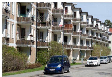
Referensexempel på balkonger. Till vänster smidesräcke. Till höger exempel från Hökarängen på snedställda balkonger som bildar en tydlig rytm i fasaden. (bild: White).