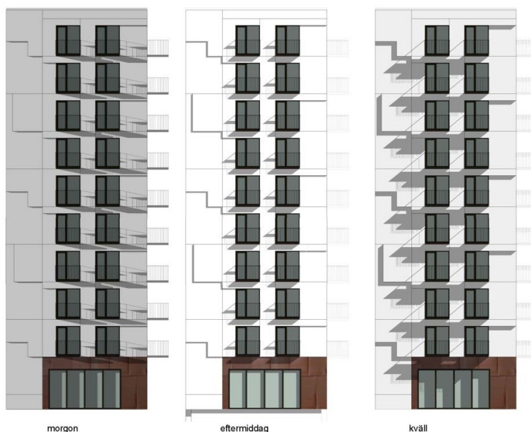
Relieferna skapar ett skuggspel på fasaden. Bilderna visar hur relieferna får punkthusets fasad mot torget/Sirapsvägen att förändras över dygnet. (bild: White).