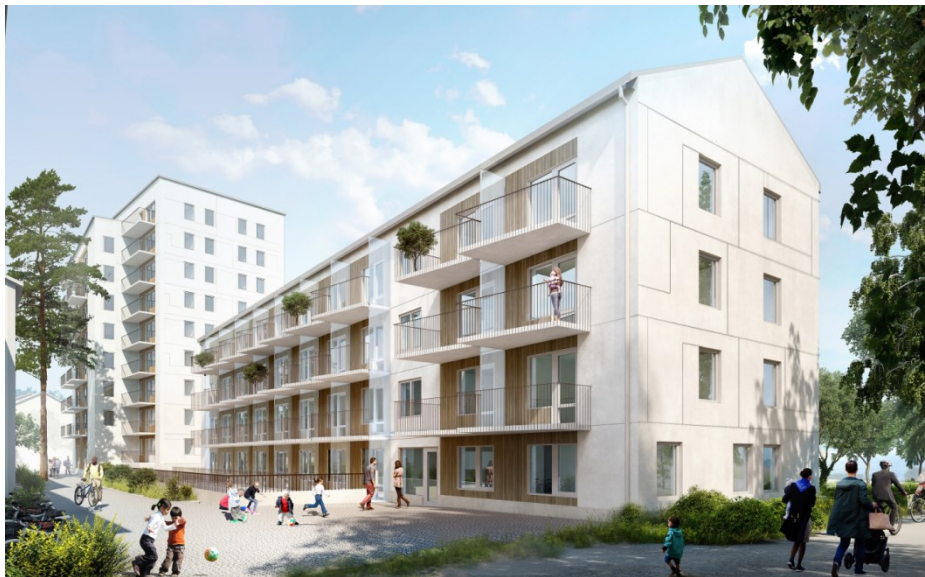
Illustration över lamellhuset med balkonger mot väster.