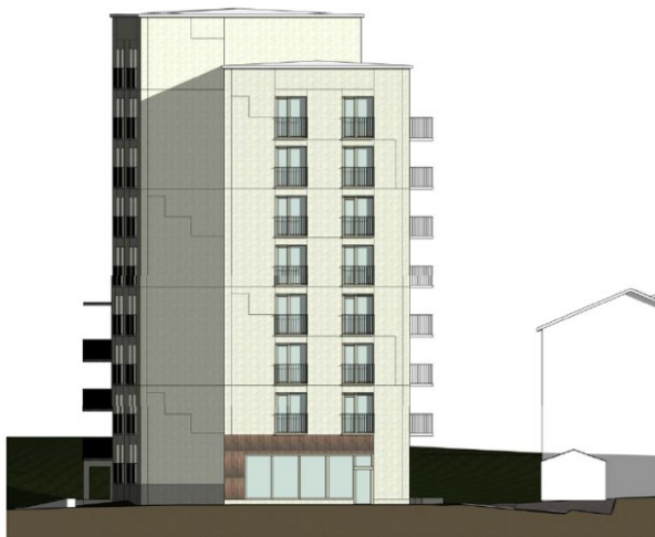
Fasad mot norr.