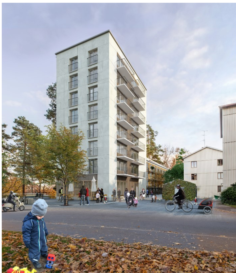
Illustration över punkthuset och framförliggande entrétorg. (bild: White).

Bottenvåningen får en takhöjd om 3.9 m, vilket gör det möjligt att här ha publik verksamhet, café eller liknande. Lokalen skall ha stora glaspartier och entré mot torget, så att den tydligt skiljer ut sig från bostäderna. Bottenvåningen markeras med träbeklädnad. Träpanelen är hyvlad och har någon form av profilering, som till exempel karosseripanel.