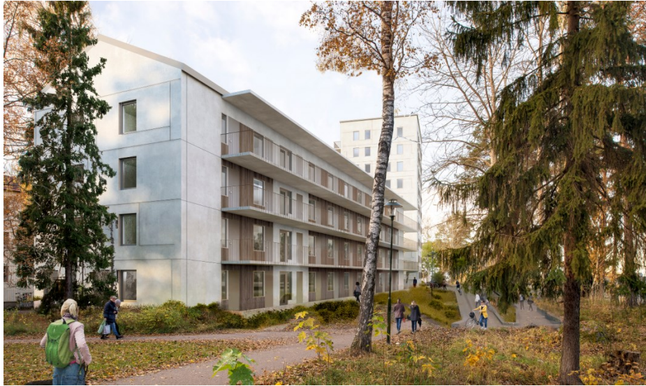
Illustration över lamellhuset med lofigångar mot öster.