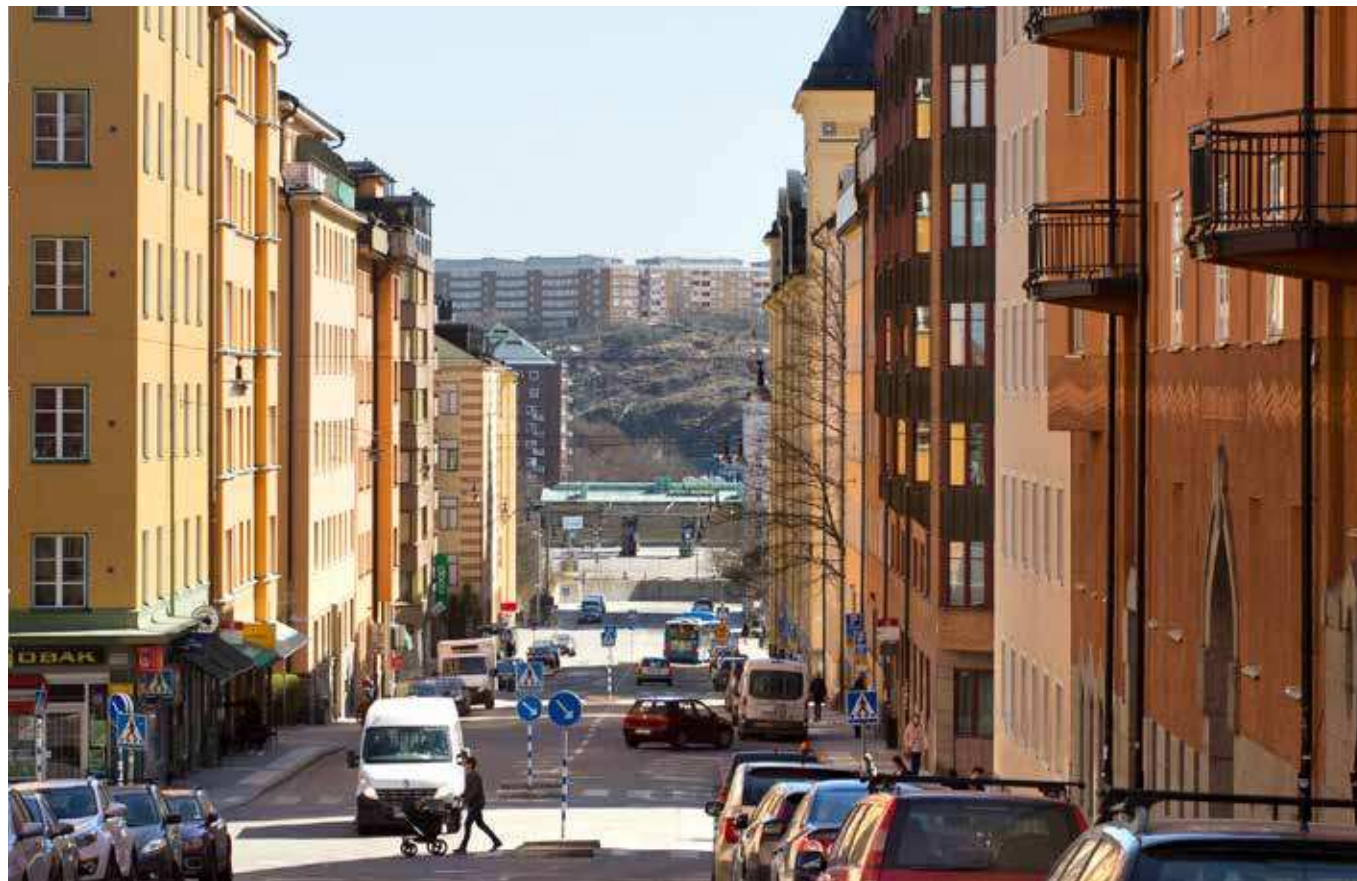
Vy från Bondegatan (vy 10).