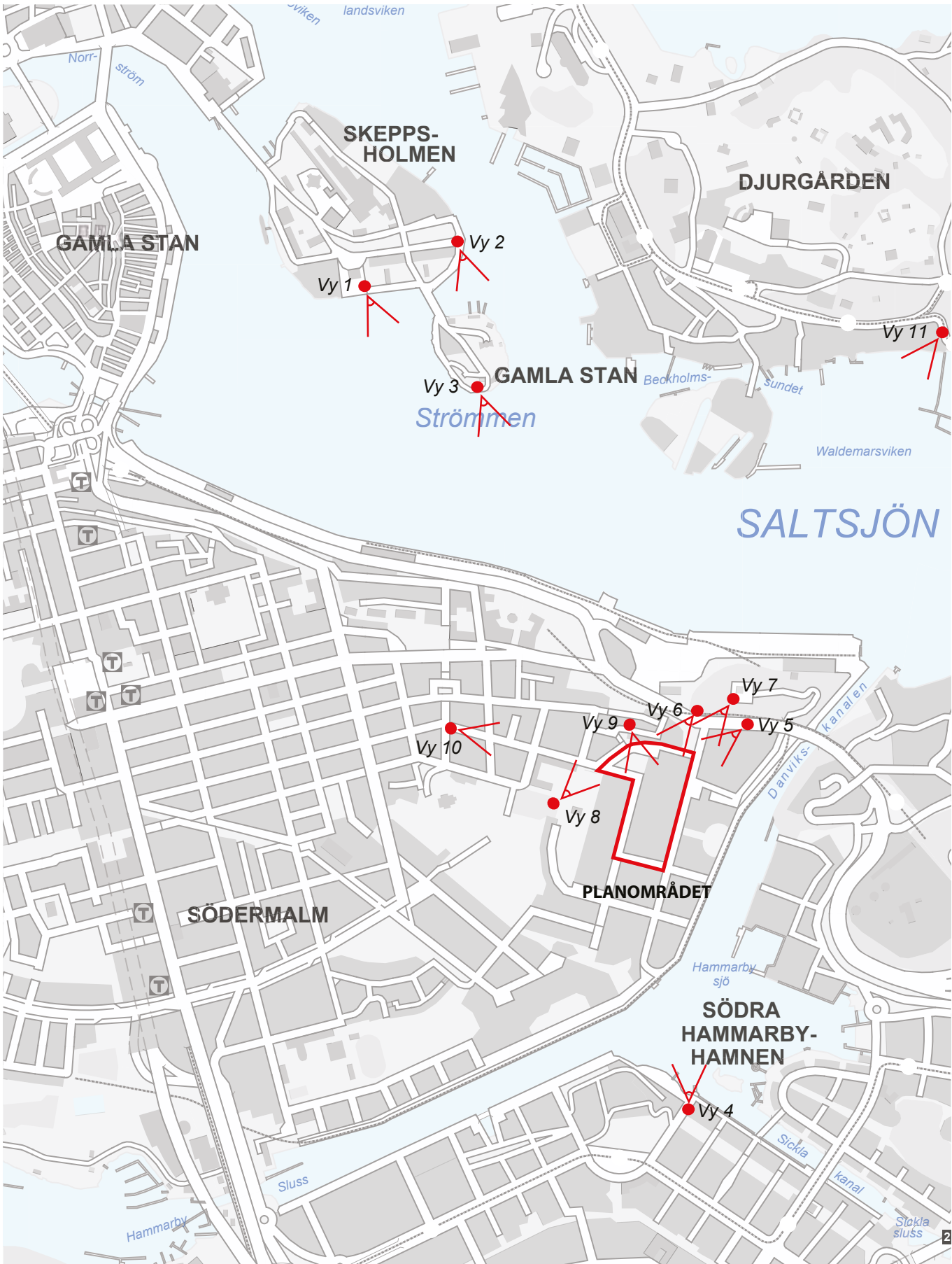
Vyer framtagna med montage.