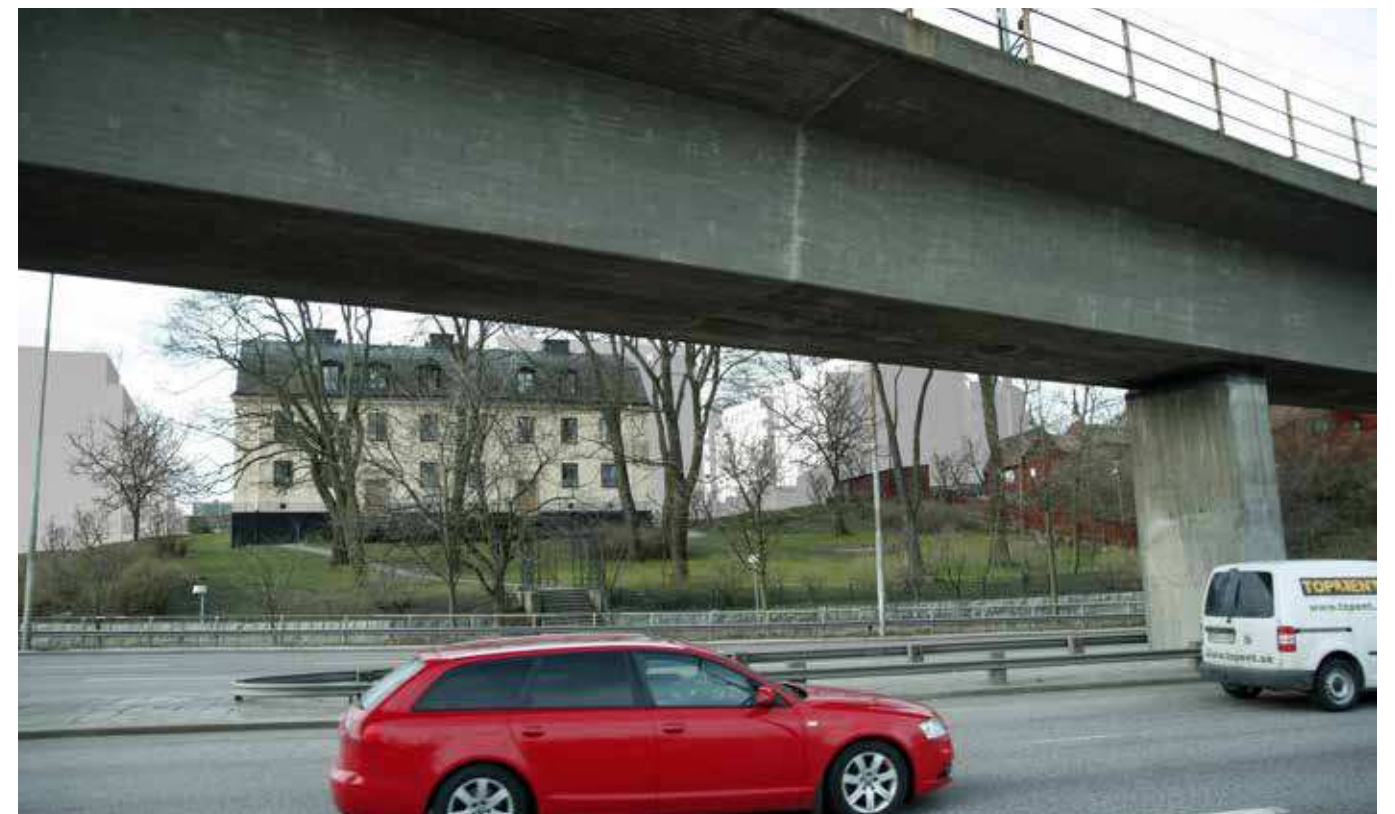
Vy från Londonviadukten (vy 6)..Montage med ny föreslagen bebyggelse.