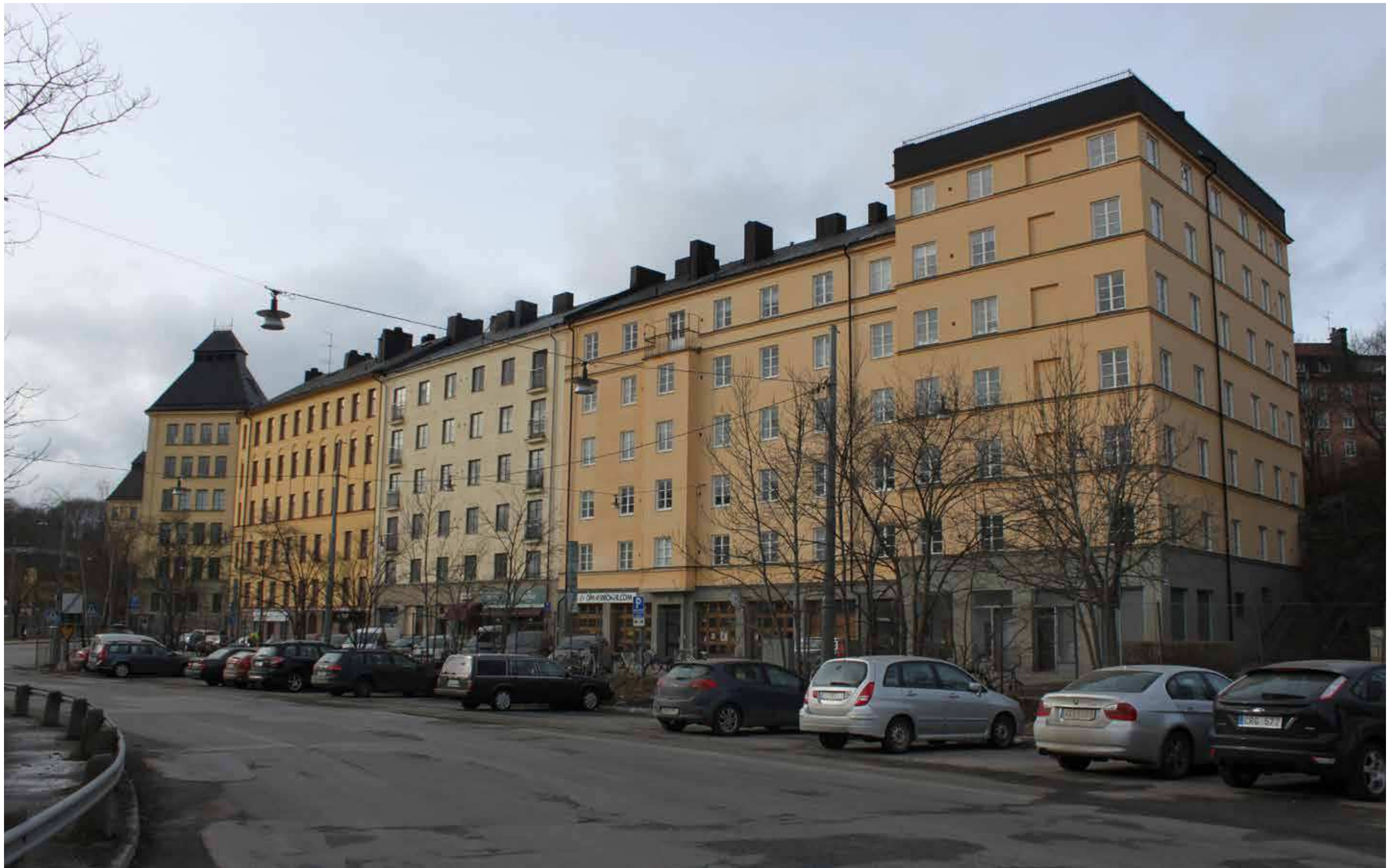
Kvarteret Gruvans klassiska stenstadsbebyggelse mot den tänkta boulevarden Ringvägen som stenstadens yttre gräns.