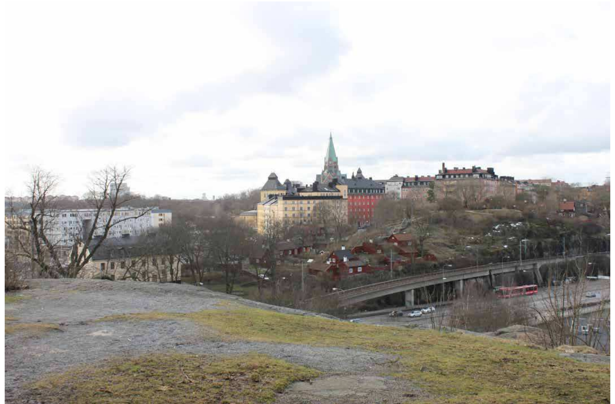
Vy över stadsdelsområdet från Fåfången. Söder om Londonviadukten reser sig Gröna gården, Åsöberget samt stenstadsbebyggelse med Sofia kyrka och skola.

* med femvånings stenhus avses byggnader med fem hela våningar samt bottenvåning och vind.