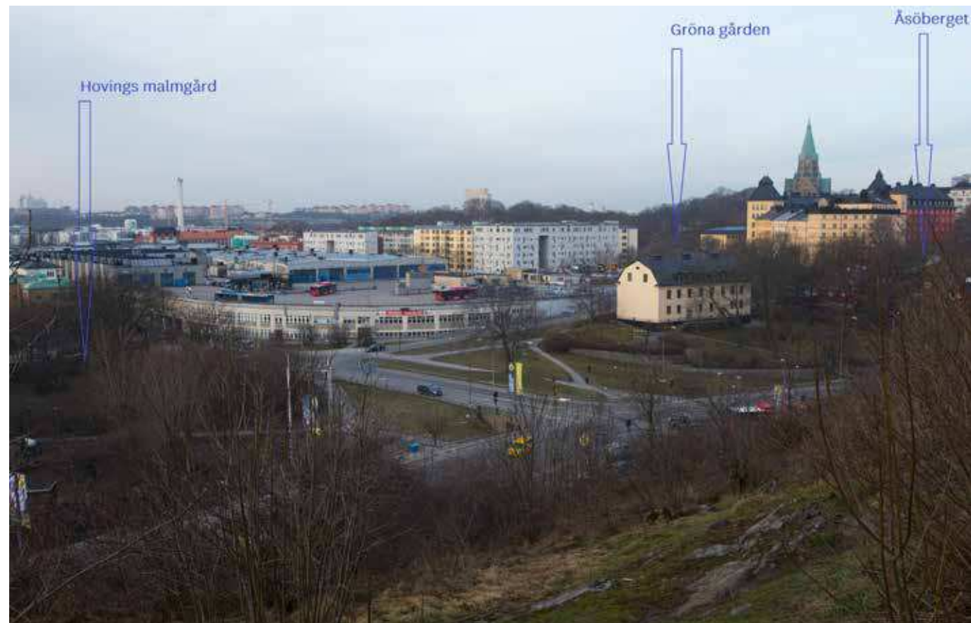
Vy från Fåfängan (vy 7).