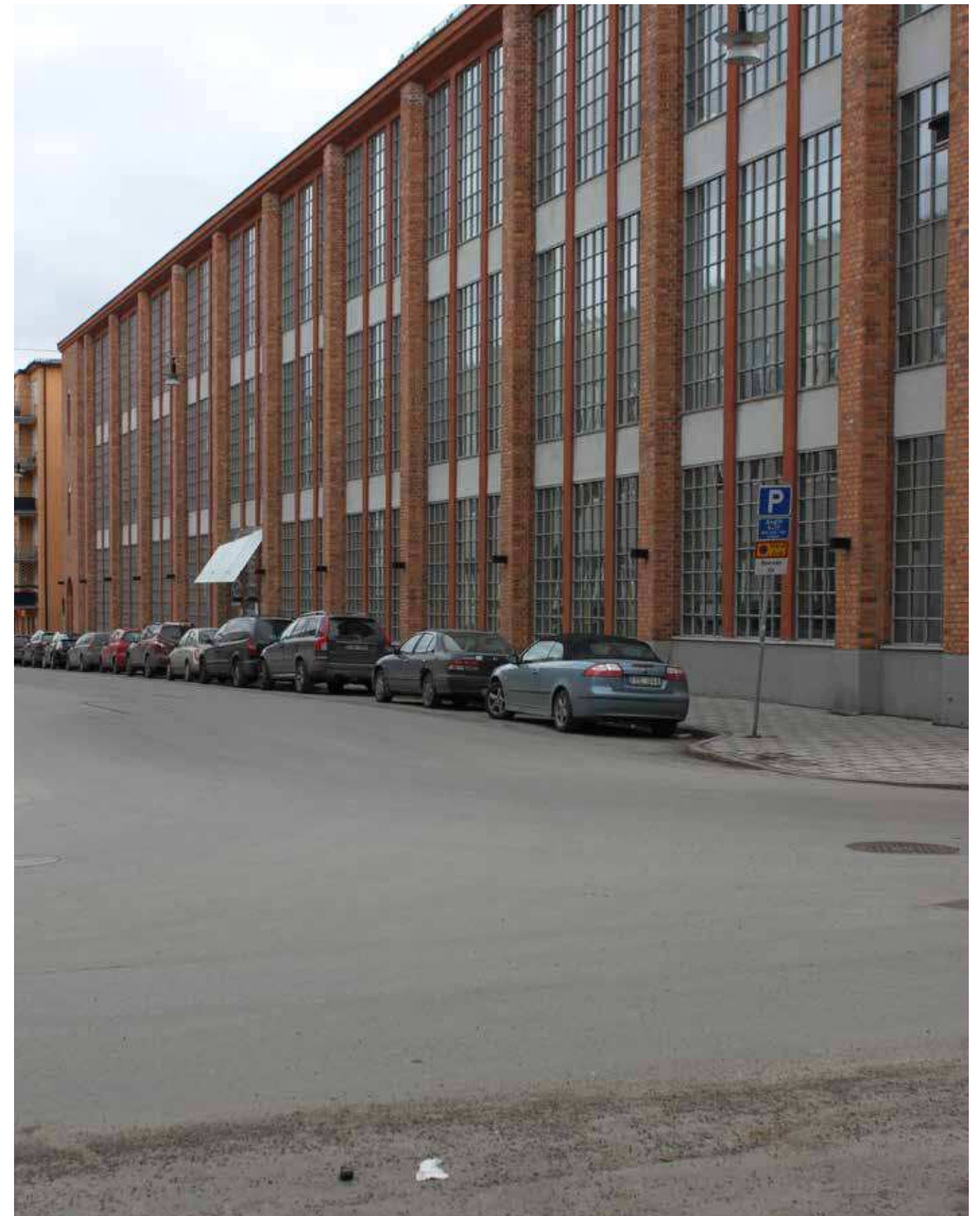
Stockholms bomullsspinneri.