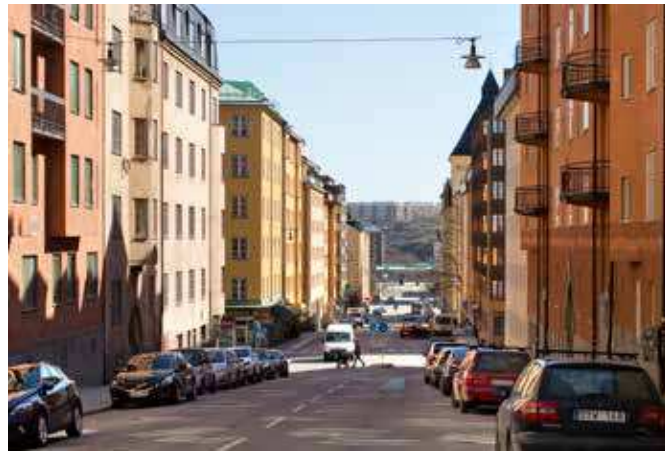
Vy från Bondegatan österut (vy 10).