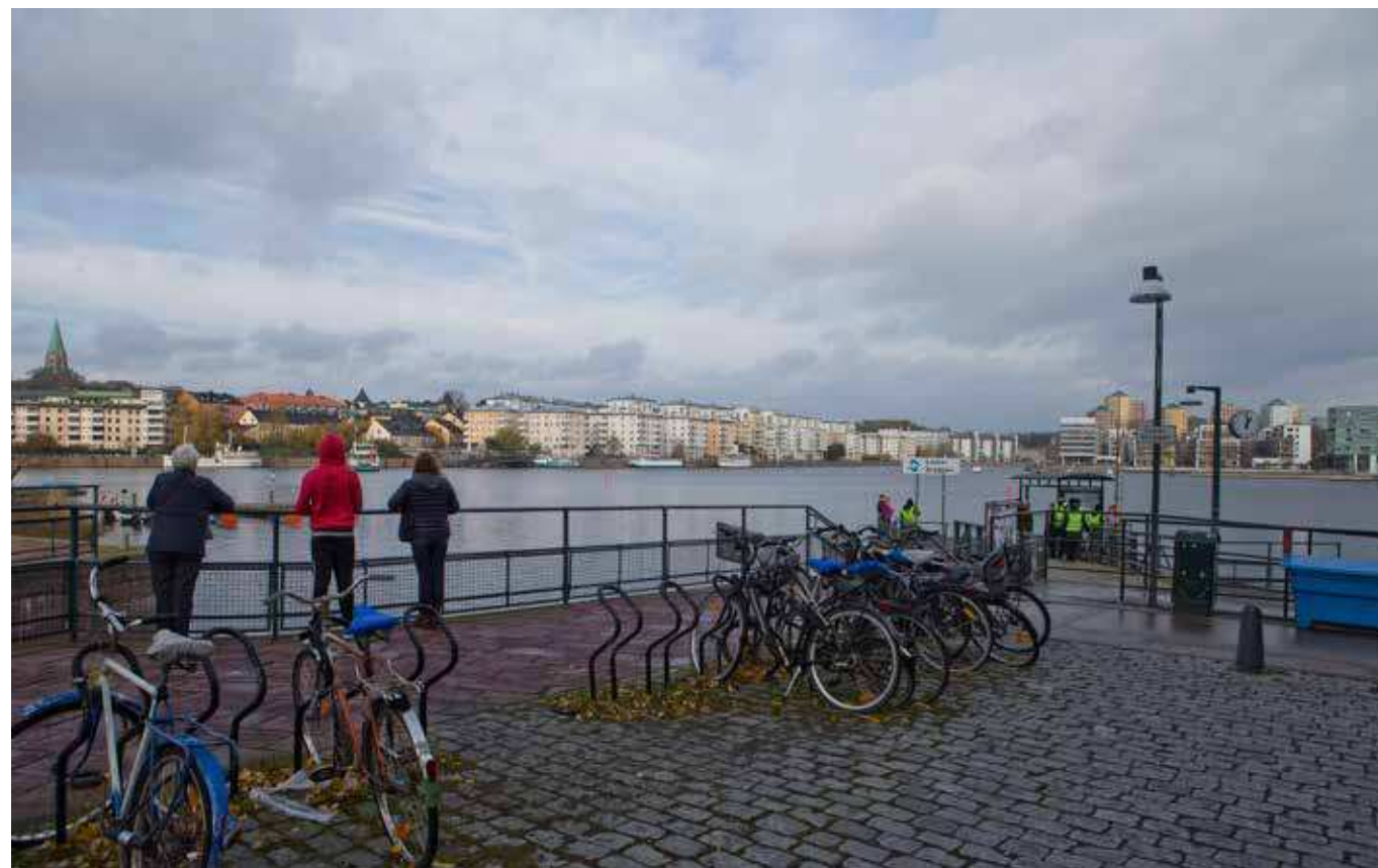
Vy från Hammarby sjö (vy 4).