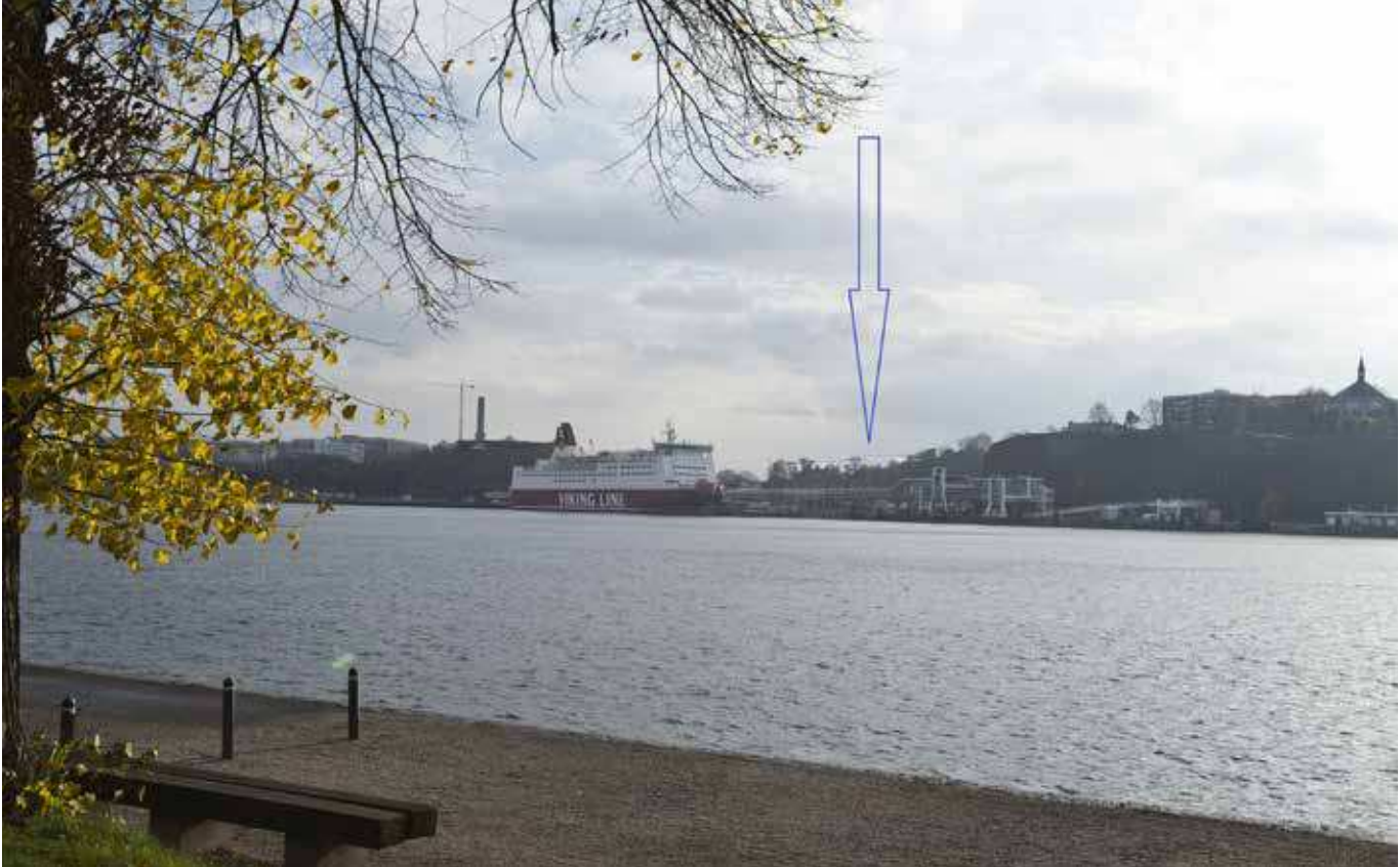
Vy från Kastellholmen (vy 3). Montage med ny föreslagen bebyggelse.