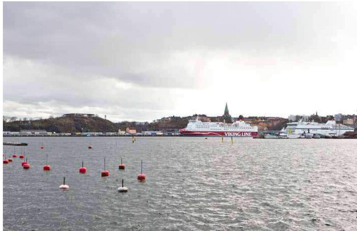
Vy från Waldemarsviken, Djurgården (vy 11).