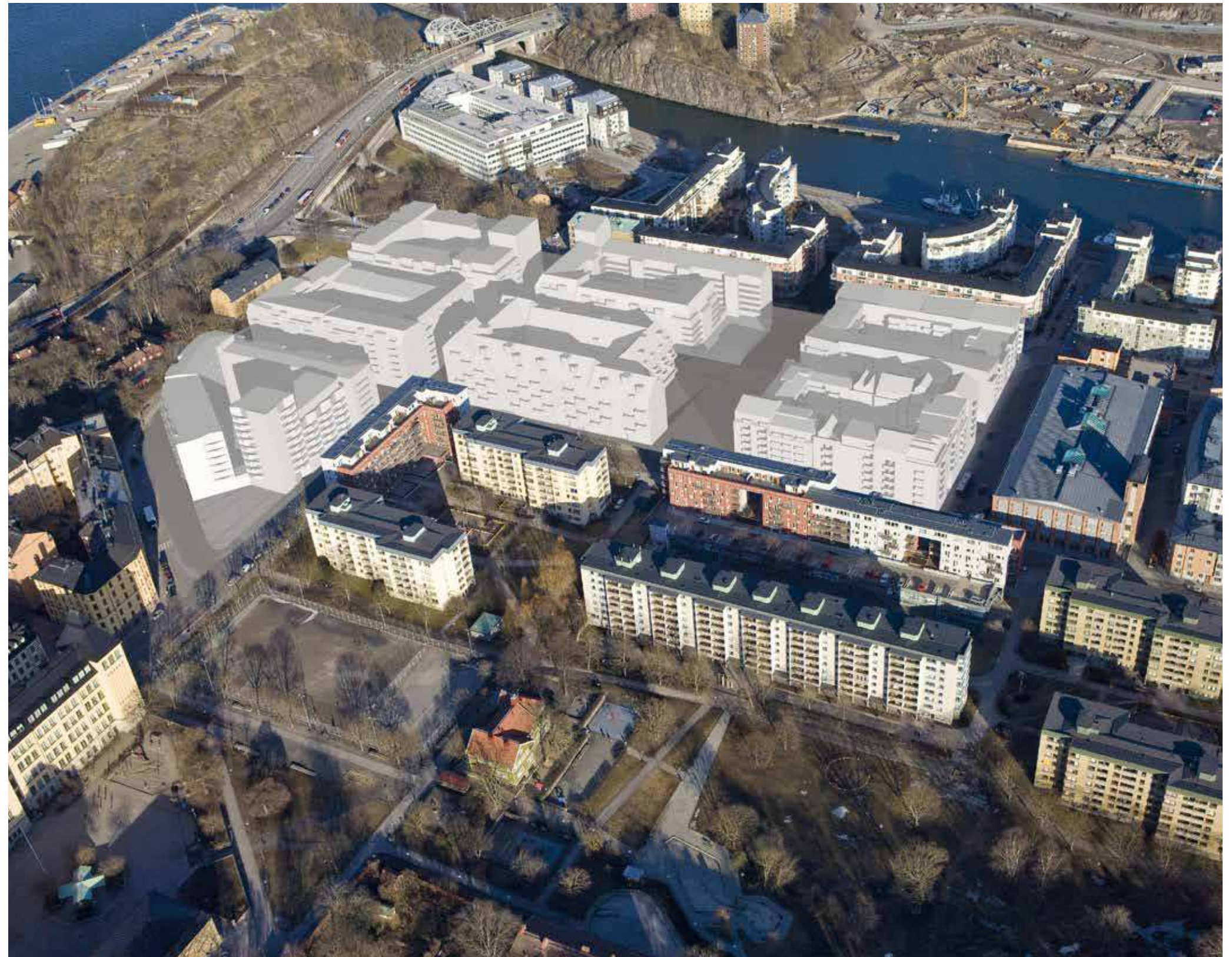
Flygfoto över kvarteret Persikan med "monterad" föreslagen ny bebyggelse.

*med 5 våningar avses här fem hela våningar samt bottenvåning och vind.