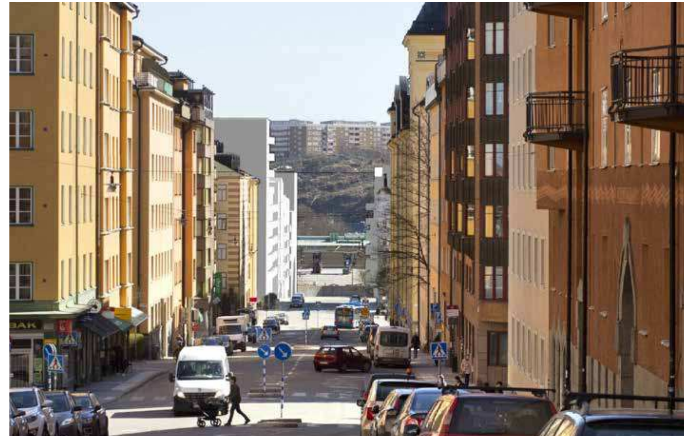
Vy från Bondegatan (vy 10). Montage med ny föreslagen bebyggelse.