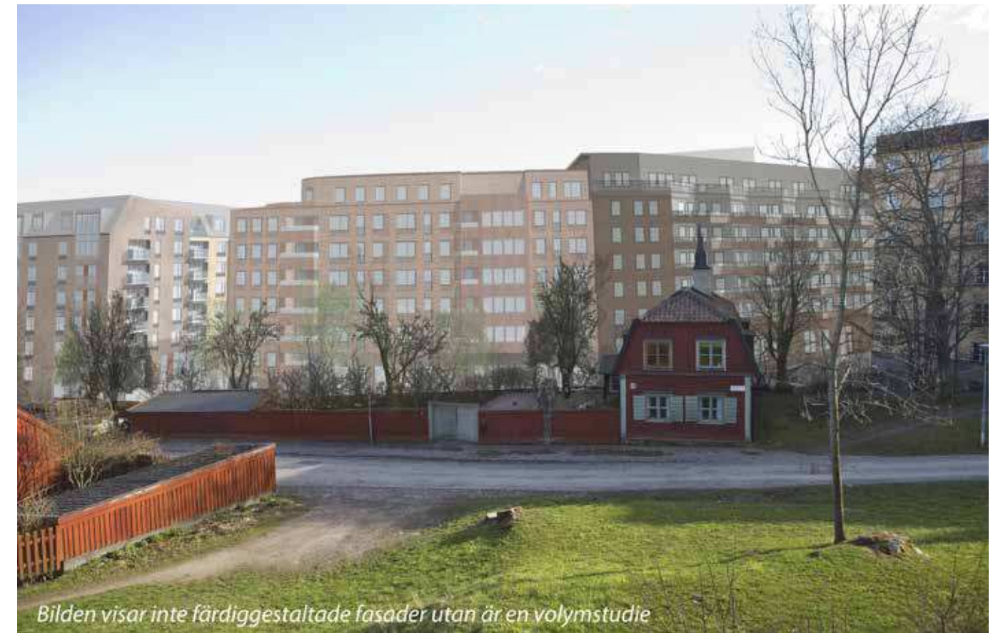
Vy från Åsöberget åt söder (vy 9). Montage med ny föreslagen bebyggelse.