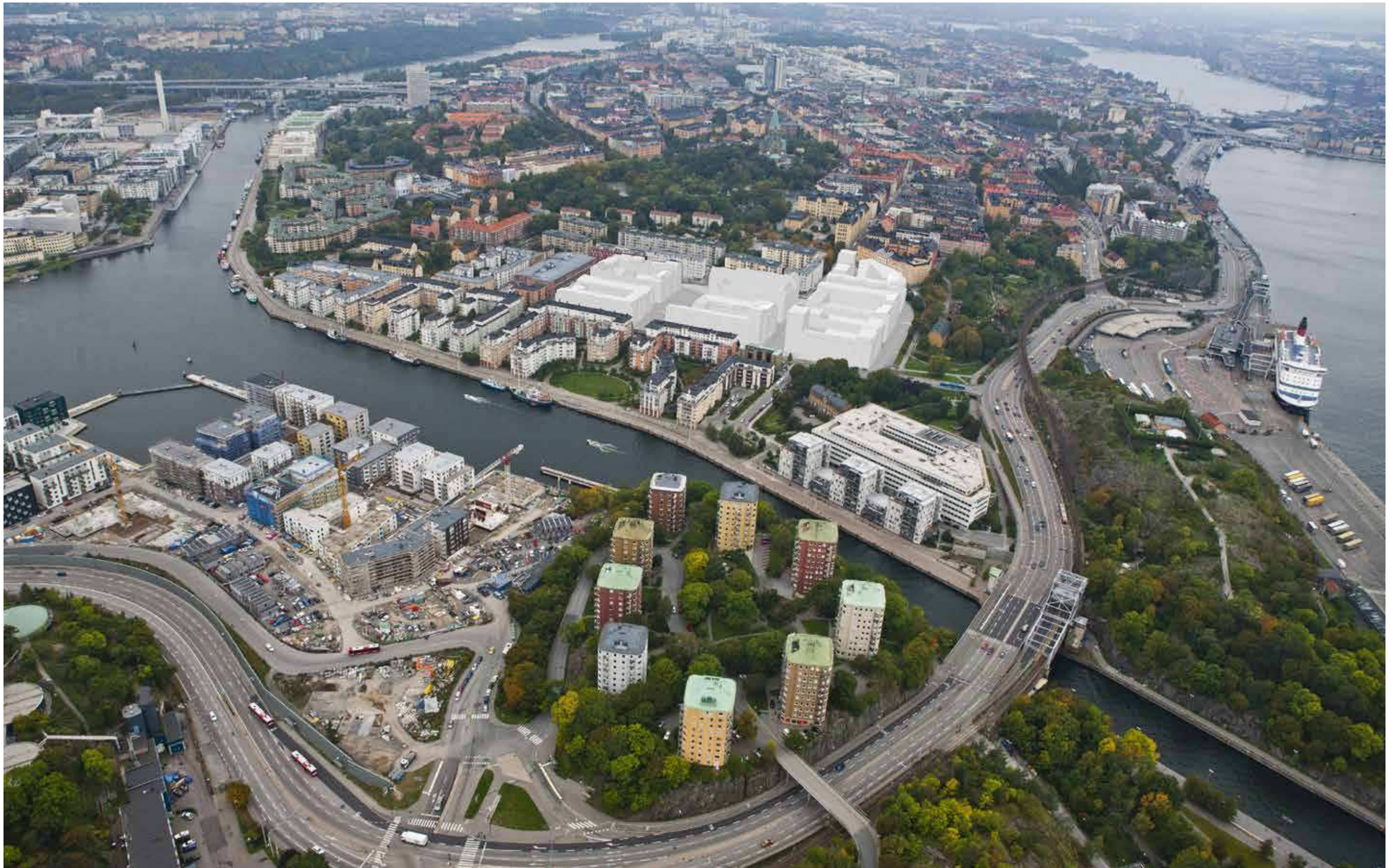
Flygfoto över östra Södermalm med monterade föreslagna byggnadsvolymer.