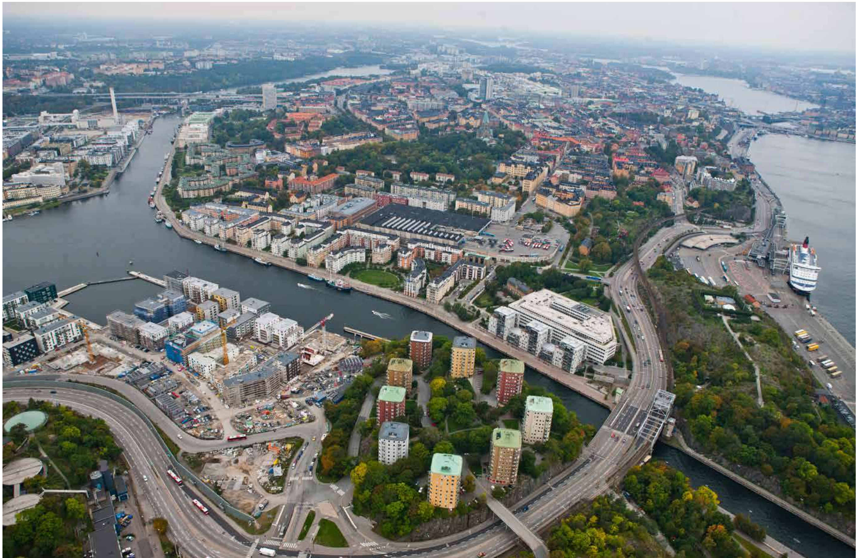
Flygfoto över kvarteret Persikan på östra Södermalm. SL's bussdepå upptar idag flera tidigare utlagda stadskvarter.