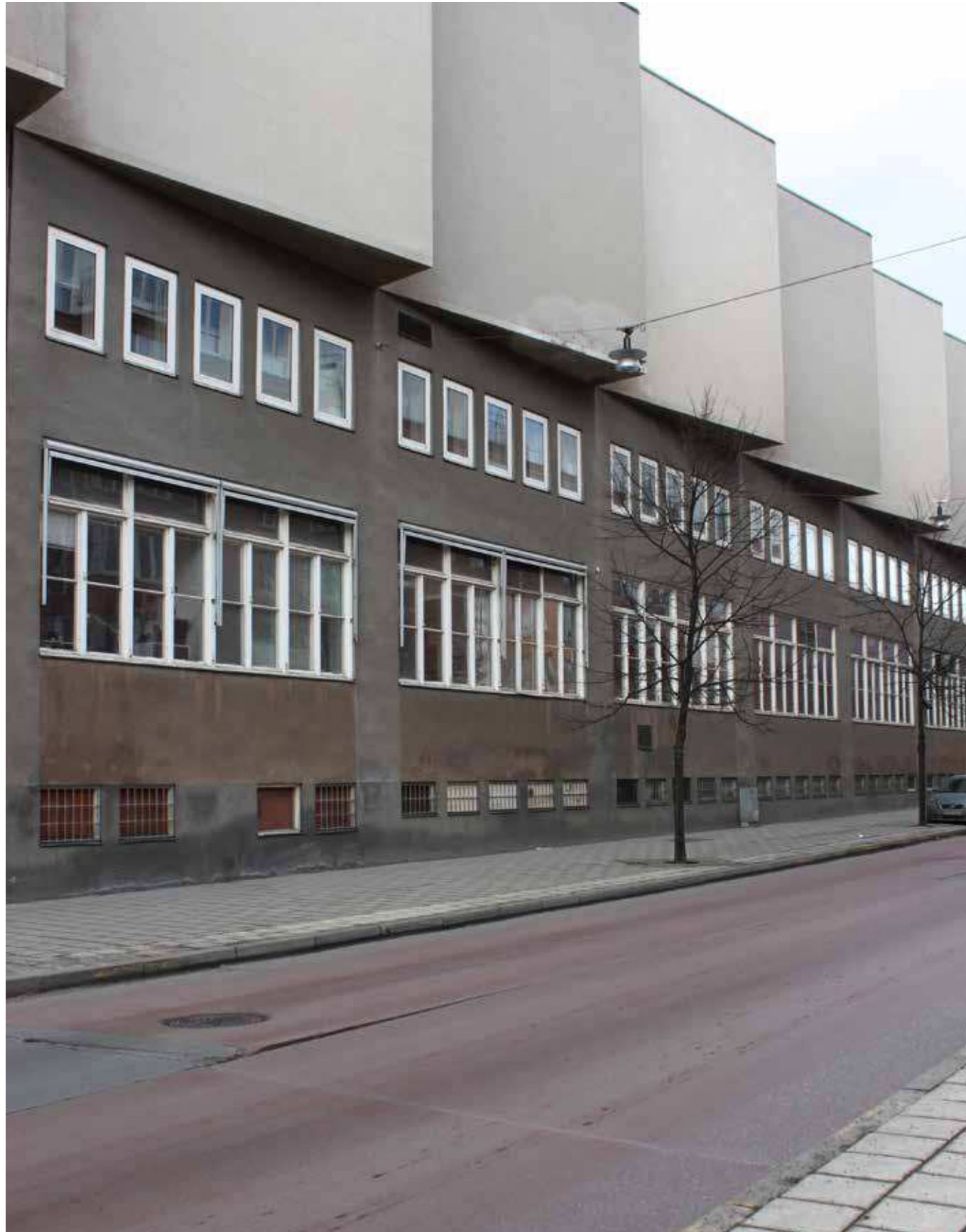
SL's bussdepån i kvarteret Persikan.