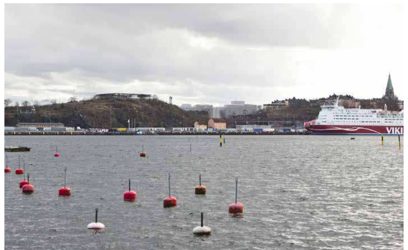
Montage med ny föreslagen bebyggelse i kvarteret Persikan. Vy från Waldemarsviken, Waldemarsudde, Djurgården.