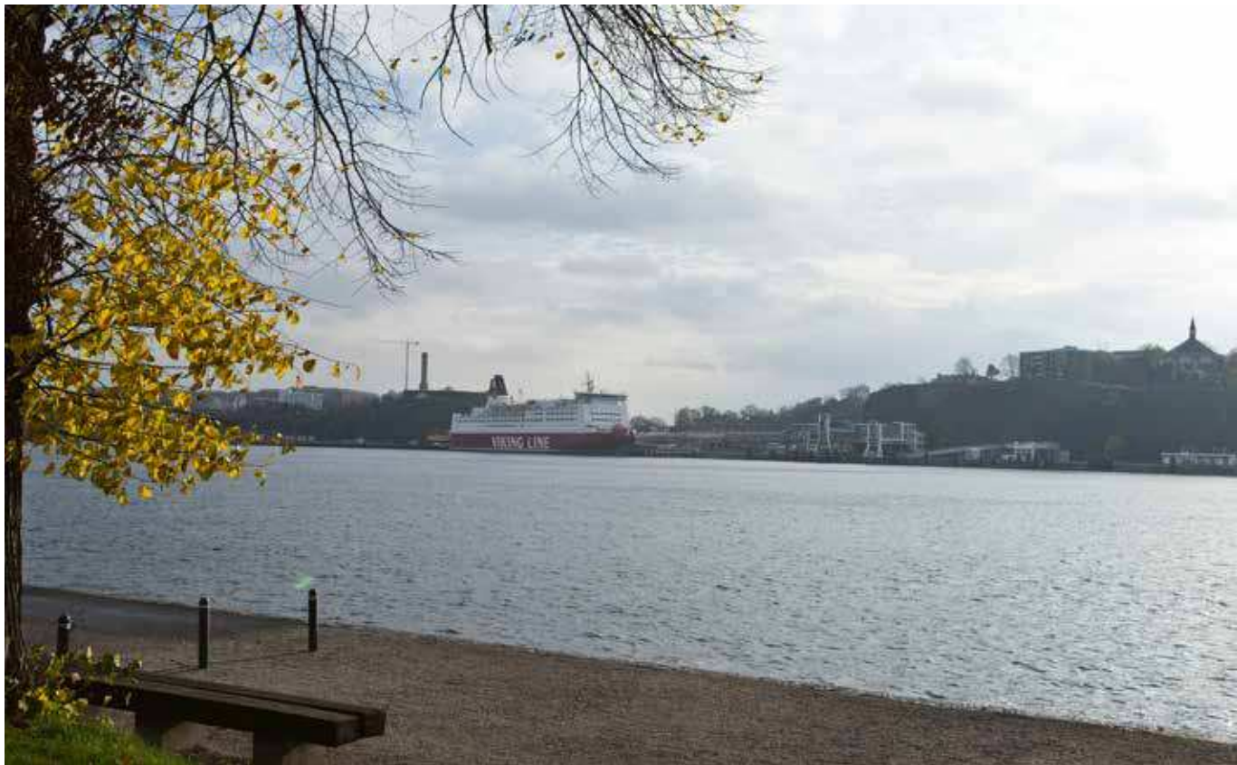
Vy från Kastellholmen (vy 3).