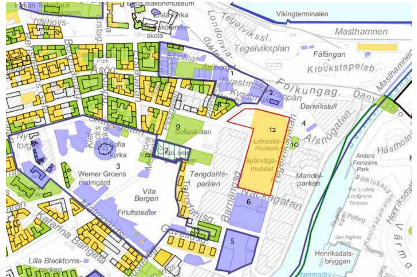
Planområdet kvarteret Persikan inom röd linje.

Kulturhistoriskt klassificerad bebyggelse inom stadsdelen: