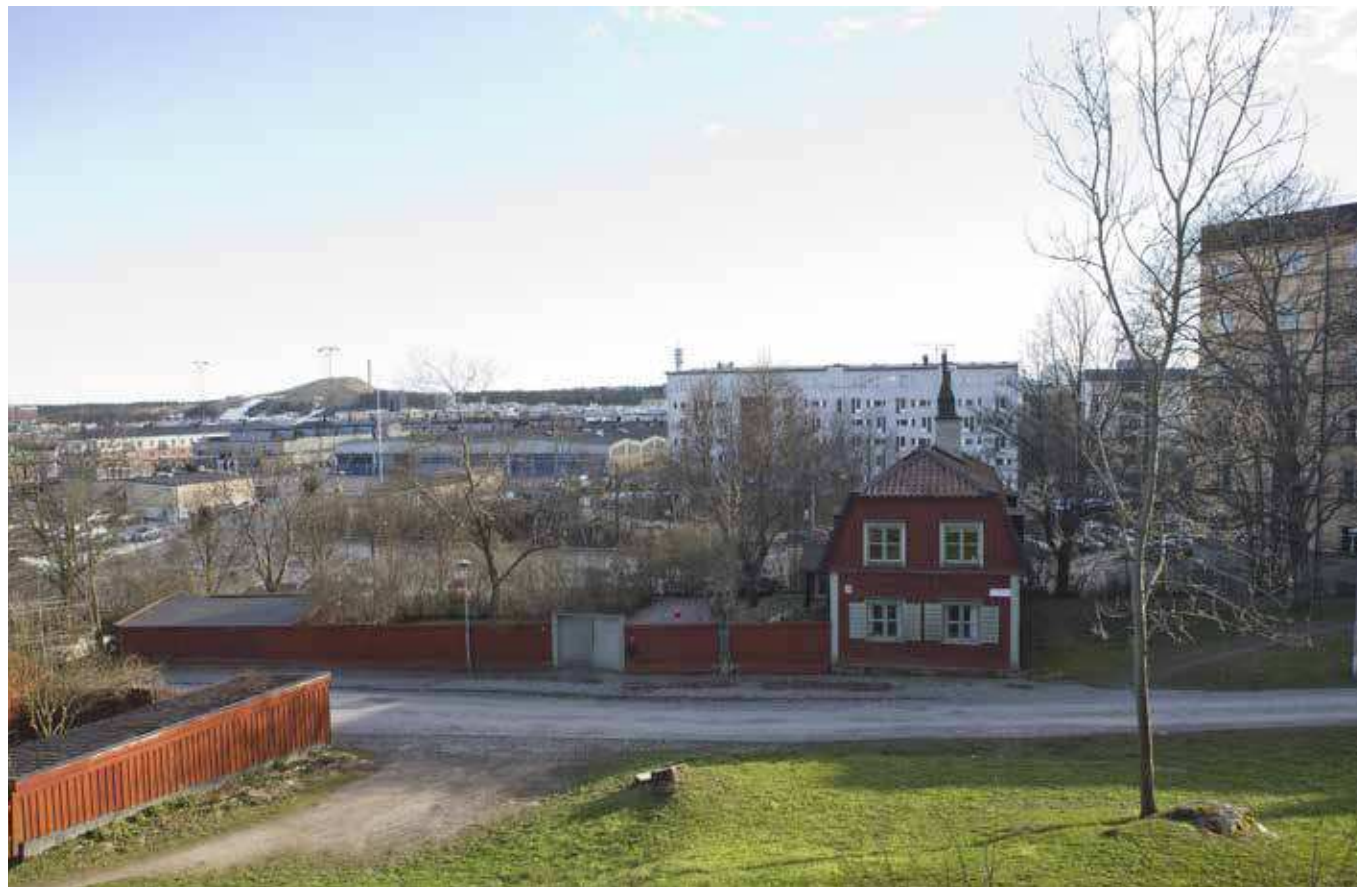
Vy söderut från Åsöberget (vy 9).