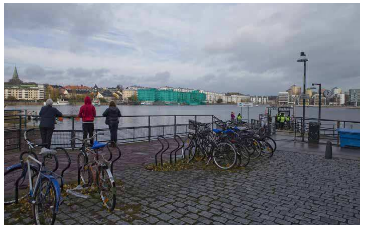
Vy från Hammarby sjö (vy 4). Montage med ny föreslagen bebyggelse. Föreslagen bebyggelsen i grönt.