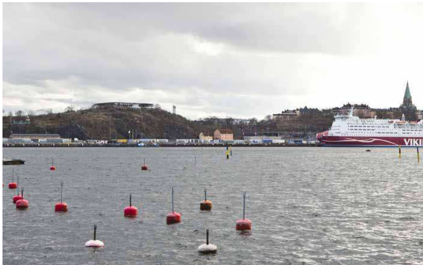
Vy från Waldemarsviken, Waldemarsudde, Djurgården.