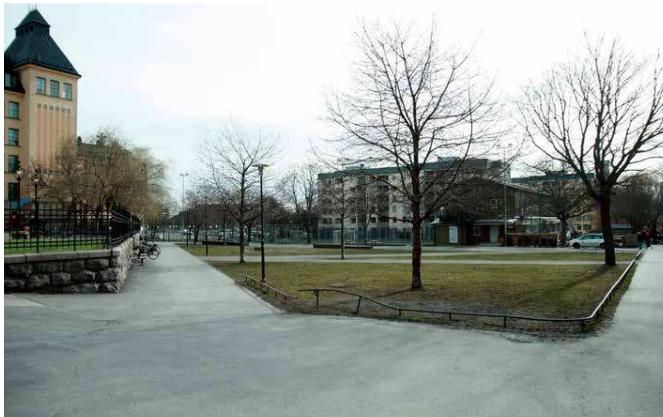
Vy från Skånegatans förlängning invid Sofia skola (vy 8).