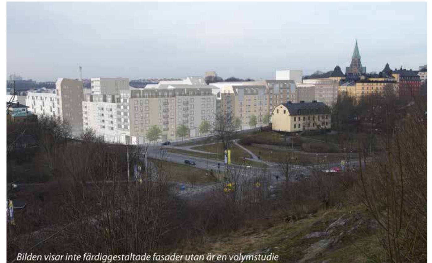
Vy från Fåfängen (vy 7). Montage med ny föreslagen bebyggelse.