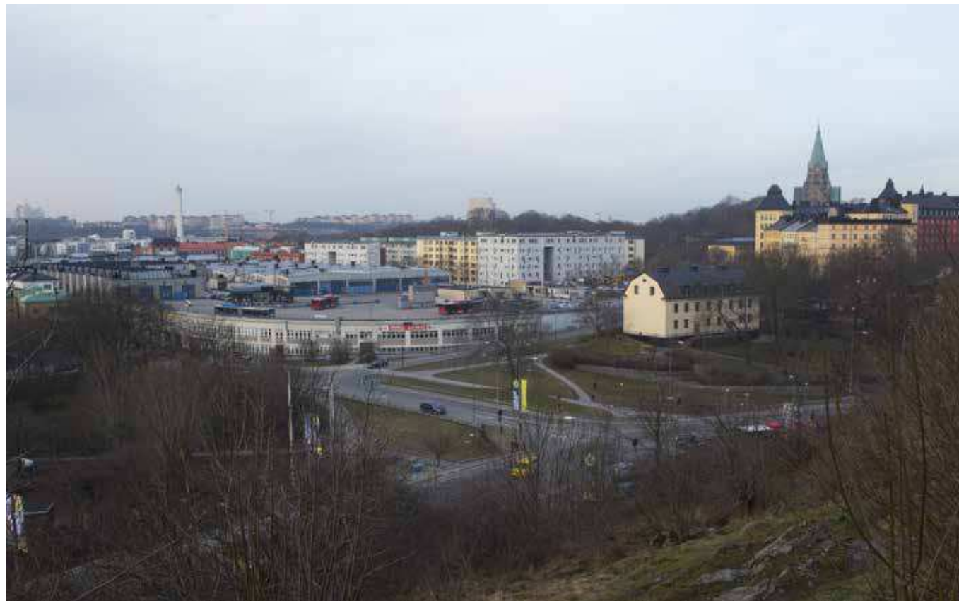
Vy söderut från Fåfängen (vy 7).