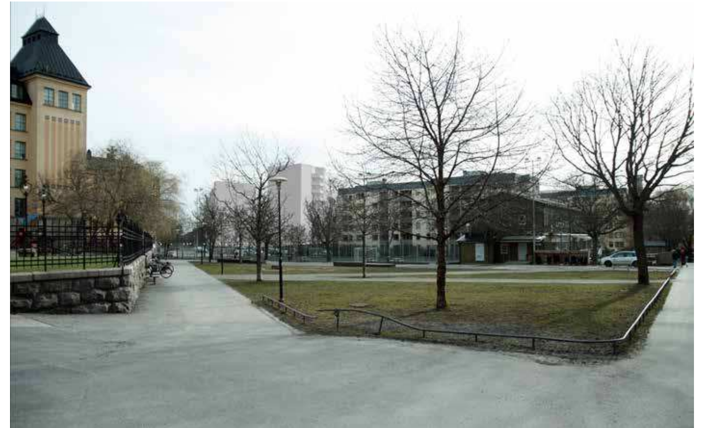
Vy från Sofia skola (vy 8). Montage med ny föreslagen bebyggelse.