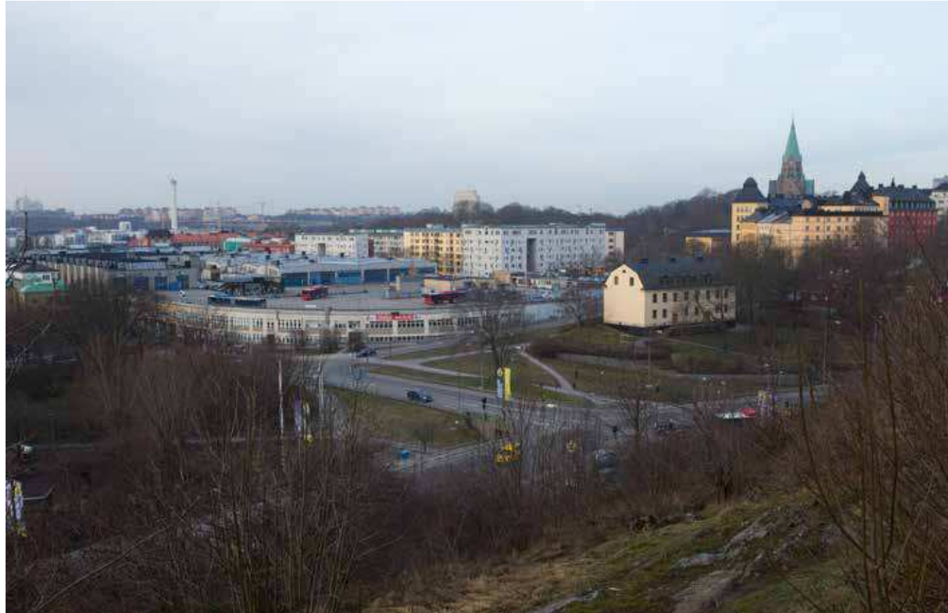
Vy från Fåfängan.