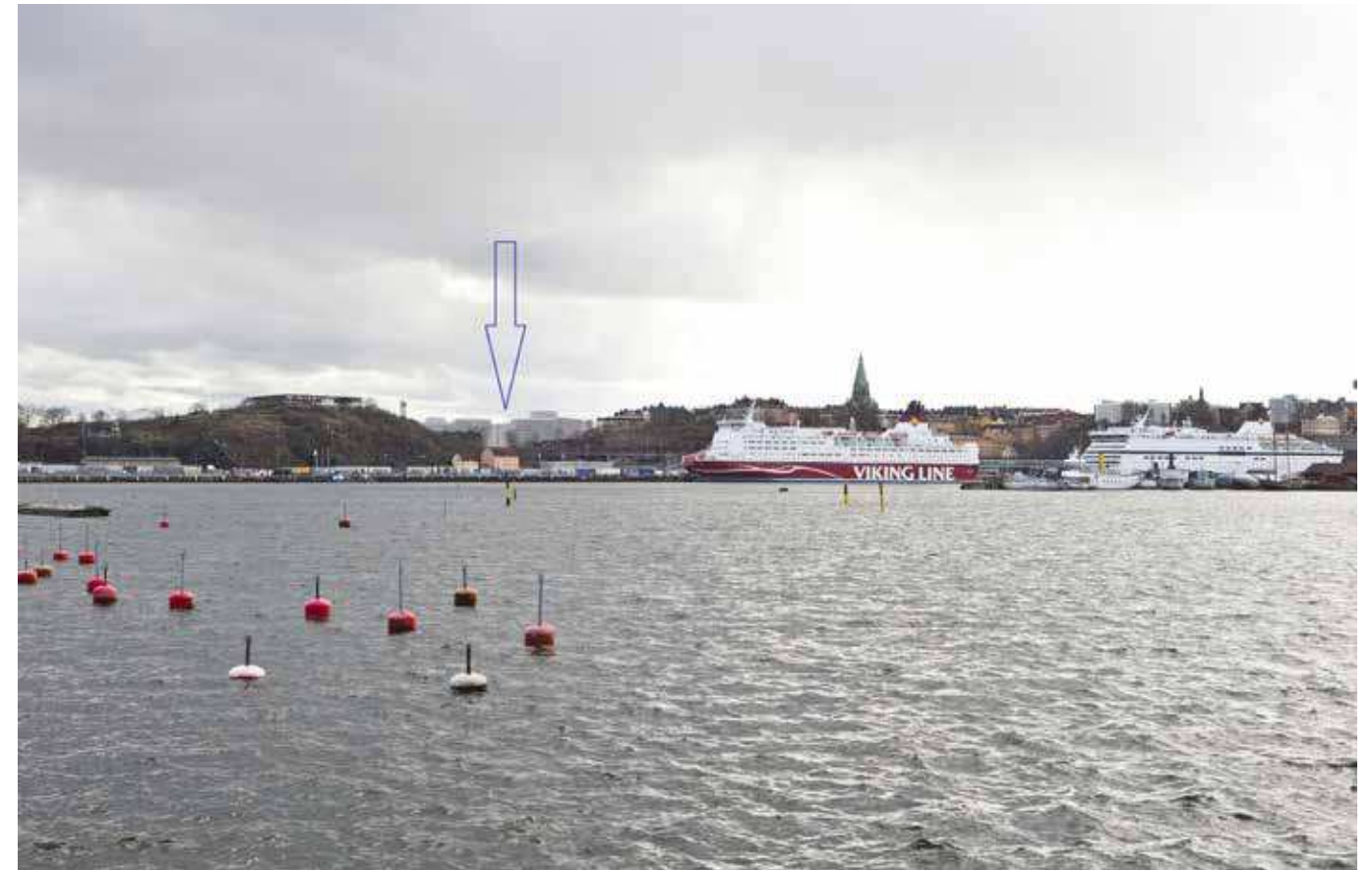
Vy från Waldemarsviken, Durgården (vy 11). Montage med ny föreslagen bebyggelse.