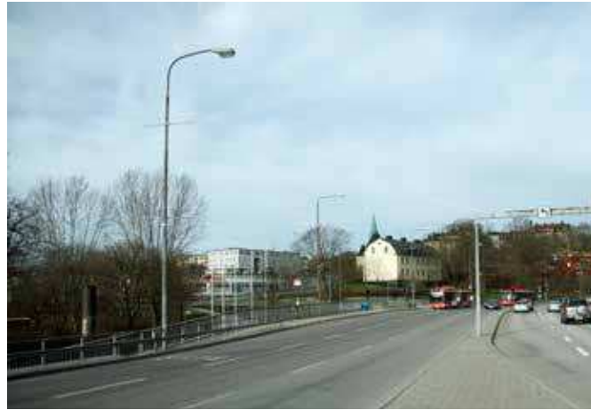
Vy från Londonviadukten (vy 5).