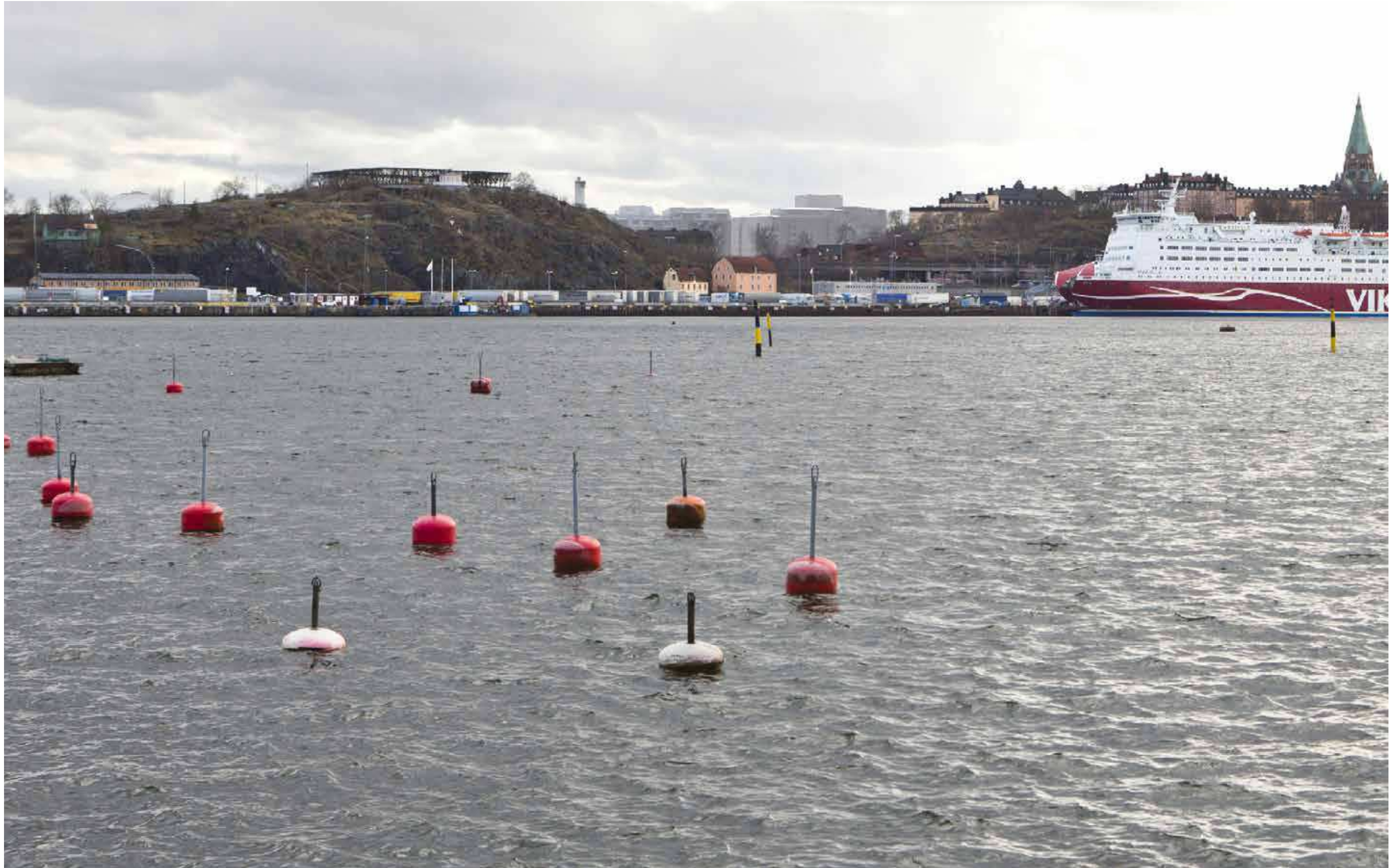
Vy från Waldemarsviken, Waldemarsudde, Djurgården, med monterad ny föreslagen bebyggelse.