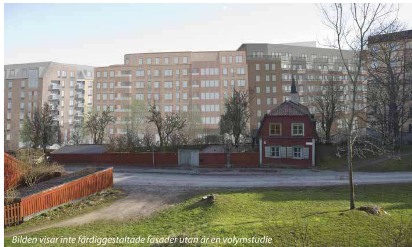
Vy från Åsöberget (vy 9). Montage med ny föreslagen bebyggelse.