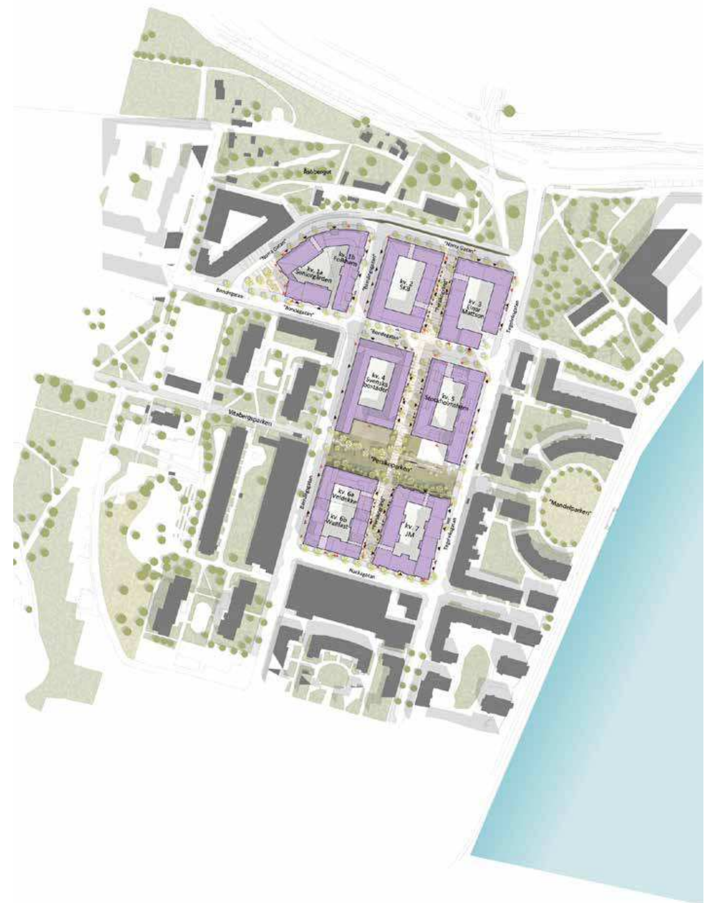
Förslaget innebär sju nya stadskvarter i kvarteret Persikan.

Den kulturhistoriska konsekvensanalysen utgår ifrån de kulturhistoriska värden som definierats i kulturhistorisk kulturmiljöanalys upprättad av Tengbom 2015. I konsekvensanalysen beskrivs vilken påverkan planförslagets byggnadsvolymer har på dessa kulturvärden. Stadsdelsområdets identifierade kulturvärden som ej bedöms påverkas av förslaget behandlas ej.