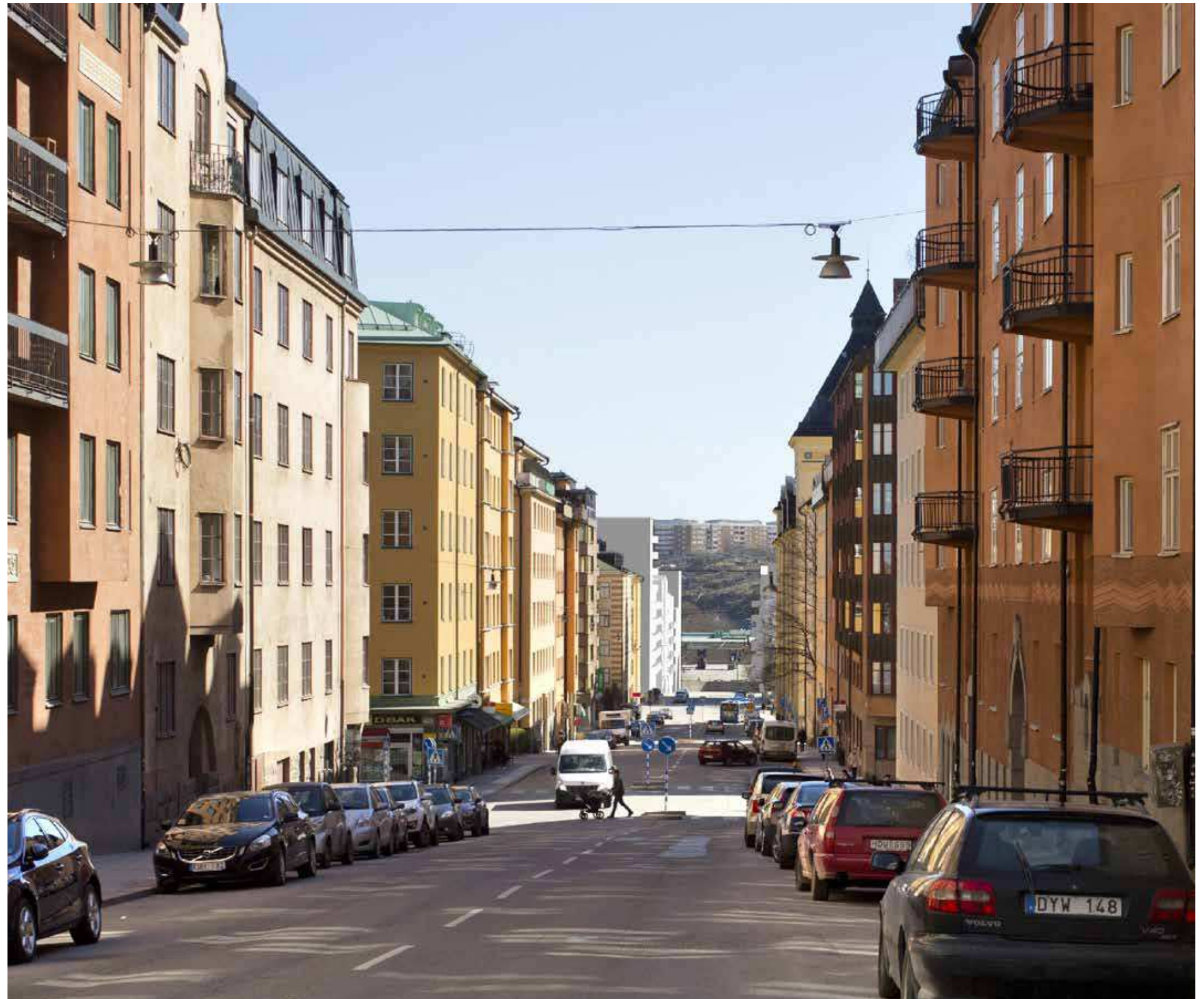
Vy från Bondegatan österut (vy 10). Montage med ny föreslagen bebyggelse.