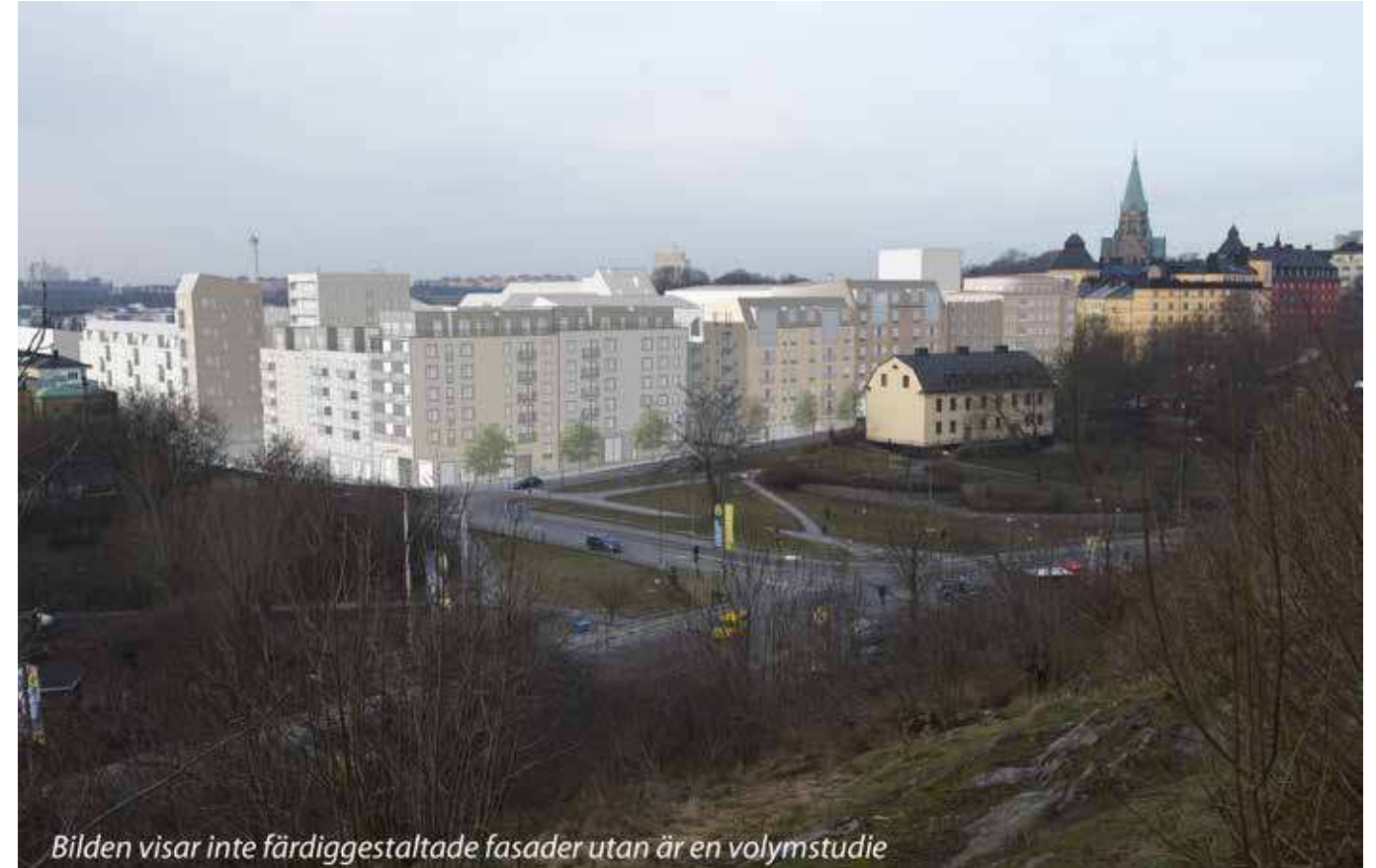
Bilden visar inte färdiggestaltade fasader utan är en volymstudie