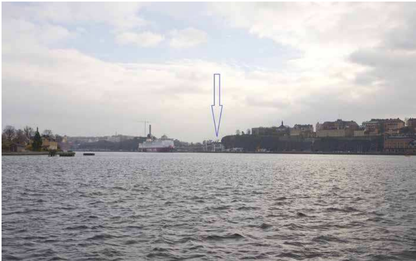
Vy från Skeppsholmen (vy 1). Montage med ny föreslagen bebyggelse.