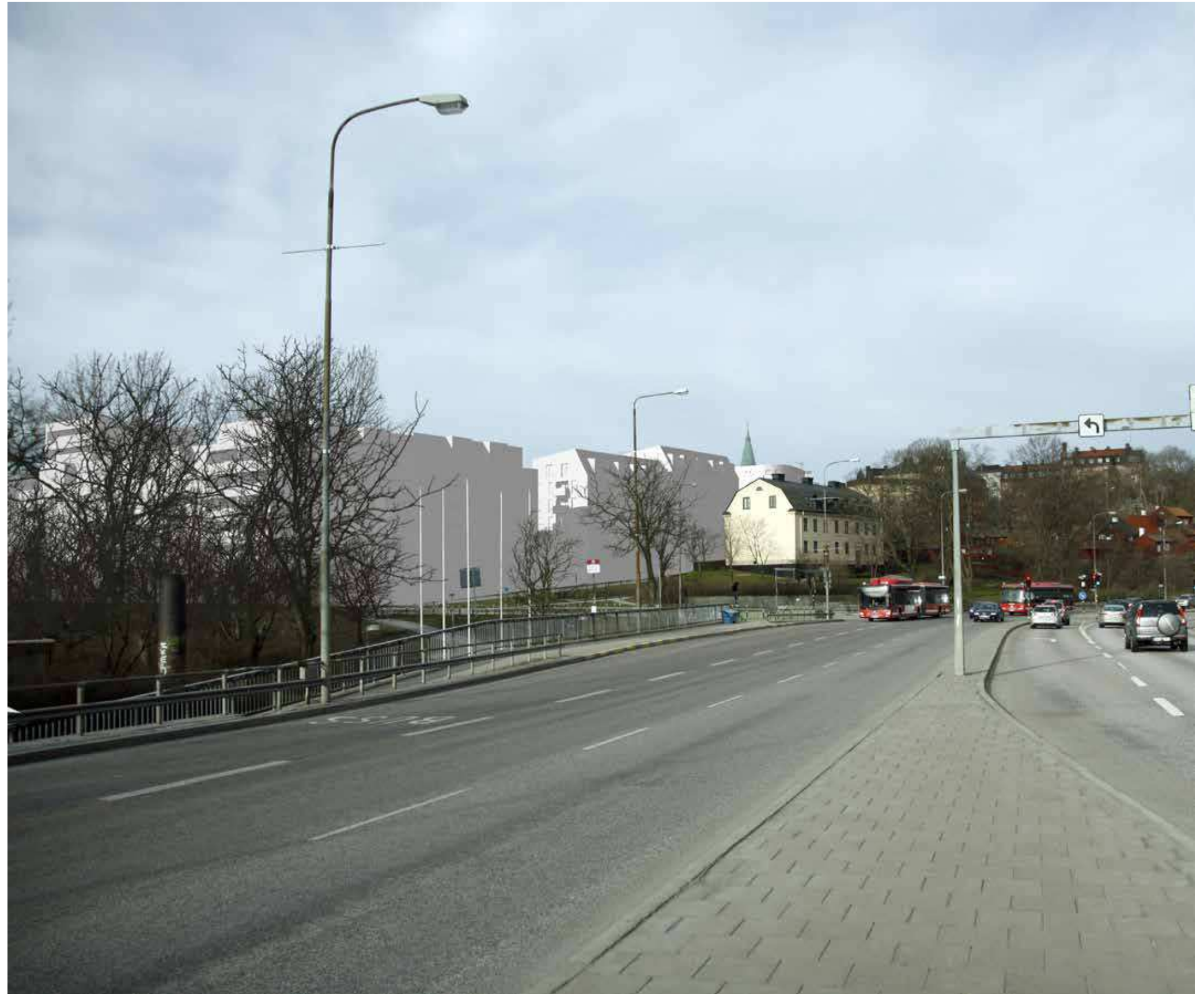
Vy från Londonviadukten (vy 5). Montage med ny föreslagen bebyggelse.