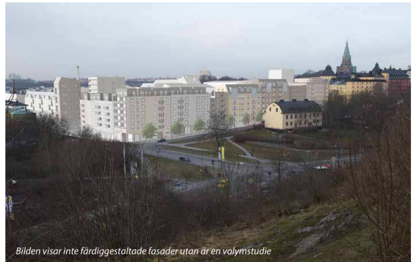
Vy från Fåfängan (vy 7). Montage med ny föreslagen bebyggelse.