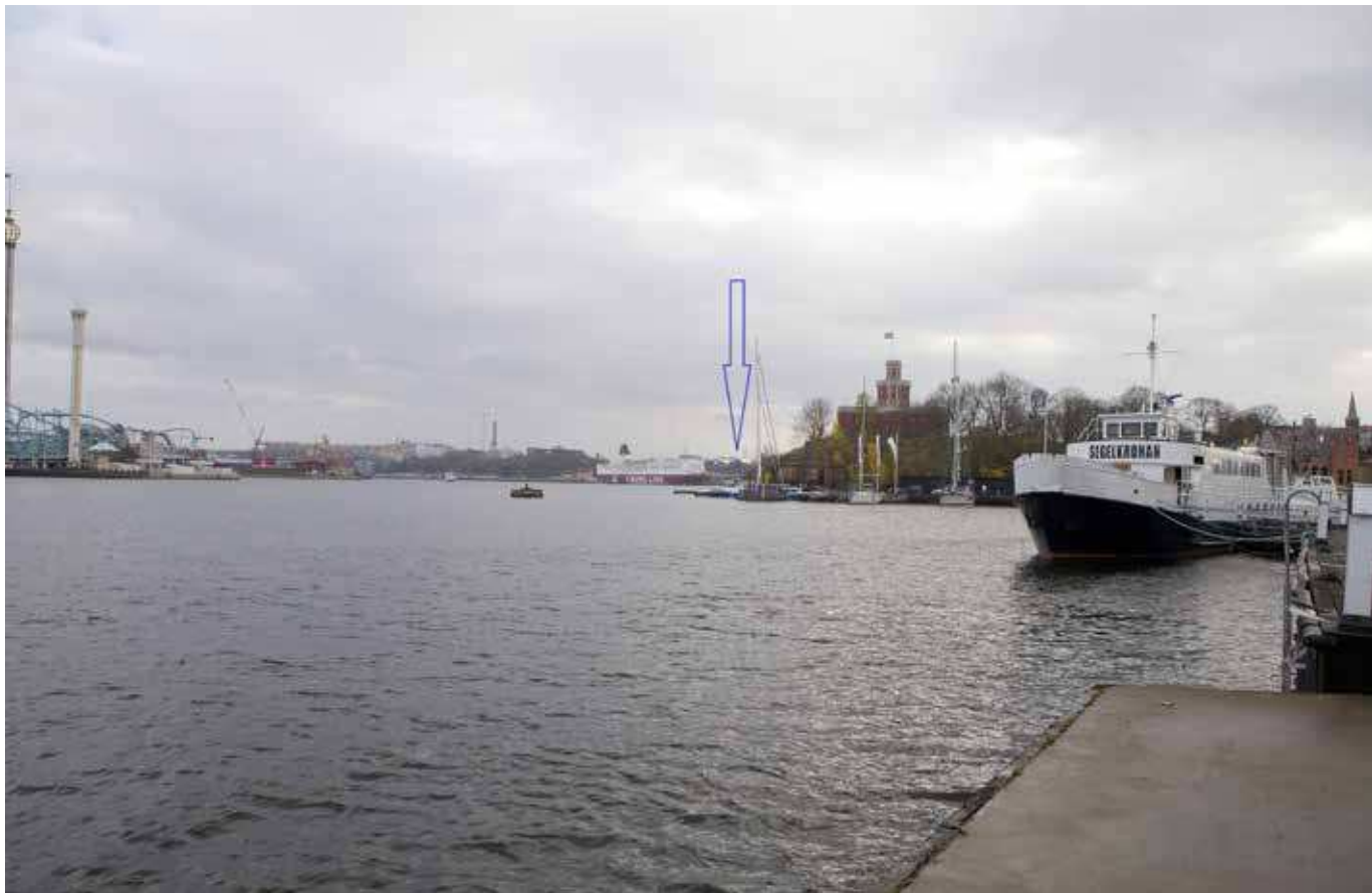
Vy från Skeppsholmen (vy 2). Montage med ny föreslagen bebyggelse.