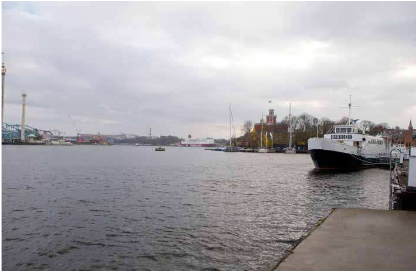
Vy från Skeppsholmen (vy 2).