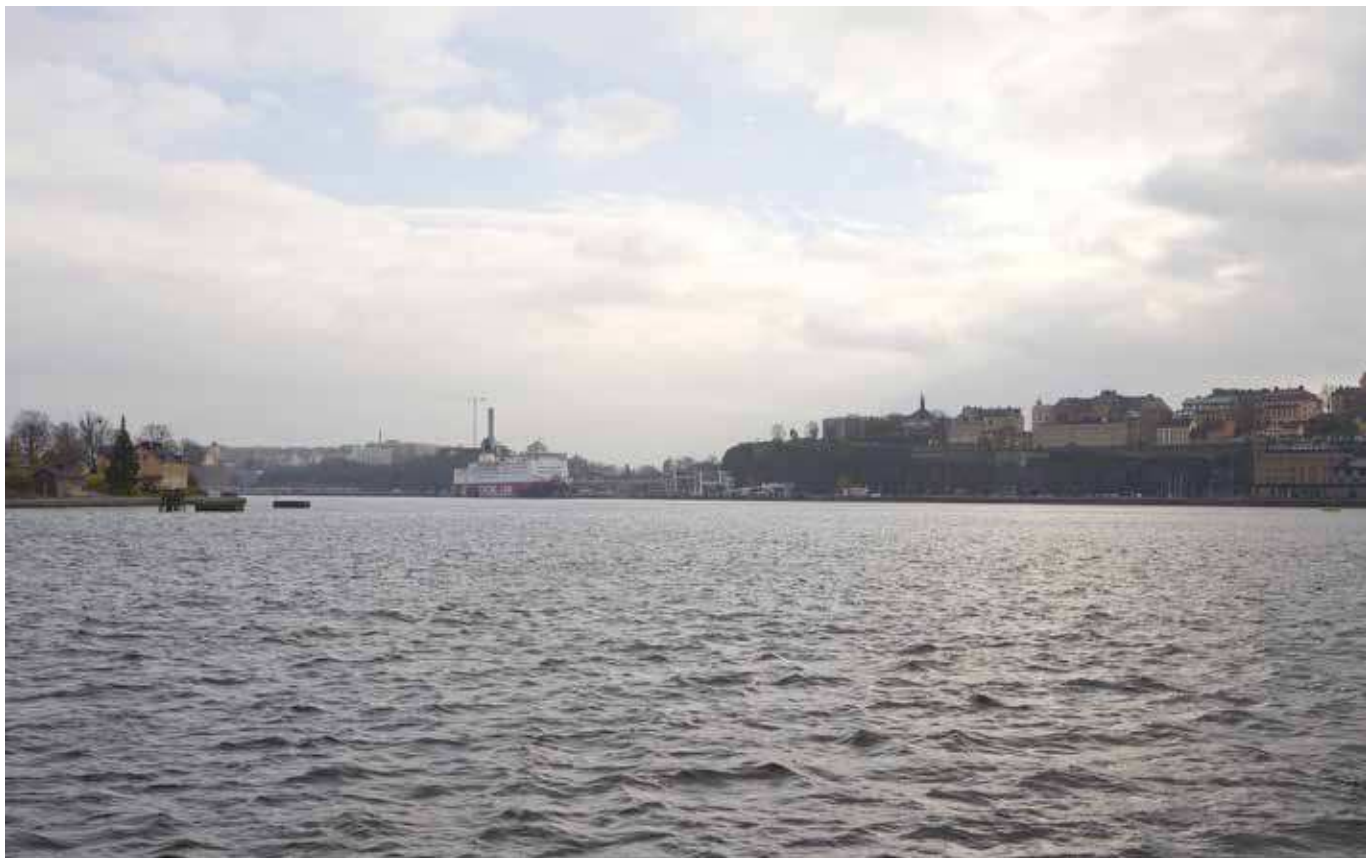
Vy från Skeppsholmen (vy 1).