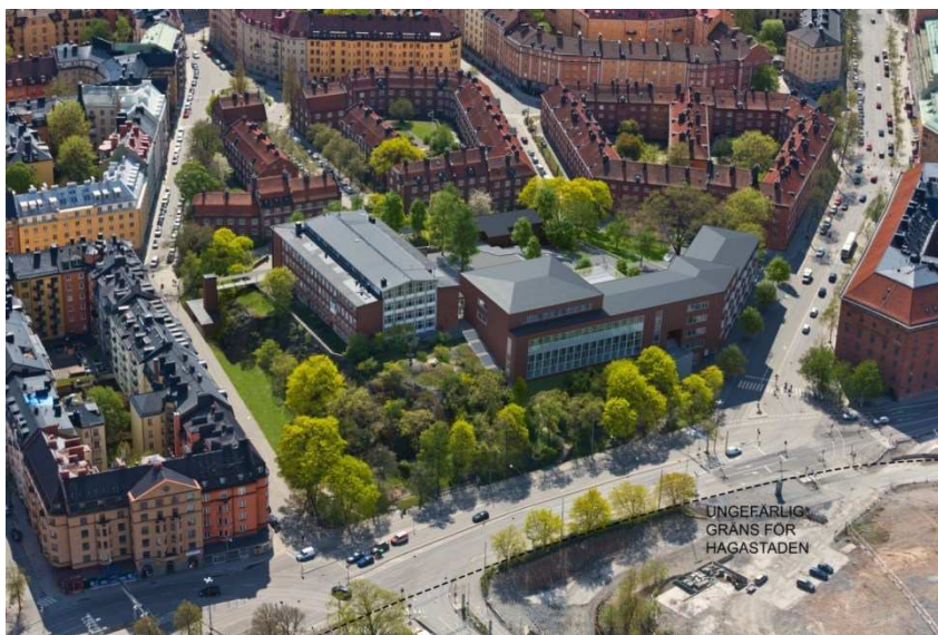
Fotomontage mot söder, helikopterperspektiv, Tengbom AB.

definition ej lämpliga för rekreation på grund av överskridna bullernivåer.