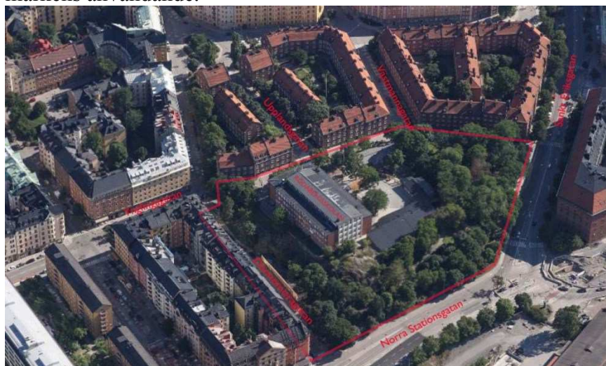
Flygbild från norr befintlig situation, planområde illustrerad med röd linje.

Enligt stadens översiktsplan berörs det aktuella området av strategi 1 som innebär att centrala Stockholm ska fortsätta att stärkas. Pågående markanvändning är skola. Kvarteret Flygmaskinen 2 ligger precis utanför värdekärnan Rödabergen men inom Riksintresset Stockholms innerstad med Djurgården. För fastigheten gäller detaljplan 88053, lagakraft år 1990. Planen anger skola, park och barnstuga som ändamål. I gällande plan beskrivs att befintlig garagebyggnad och kiosk vid Dannemoragatan strider mot markens användande.