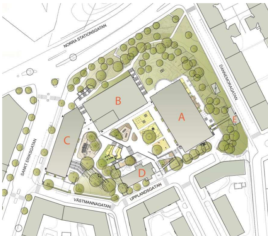
Situationsplan med föreslagen tillbyggnad av Rödabergsskolan. A: befintlig skolbyggnad –Rödabergsskolan, B: tillkommande skolbyggnad med idrottshall i souterrängvåning, C: tillkommande skolbyggnad, D: befintlig förskola, E: ny inlastning.

Den befintliga skolbyggnaden från år 1953 länkas samman med en tillkommande skolbyggnad vilka tillsammans skapar en ny helhet kring en bullerskyddad och södervänd skolgård, med en lägre halt av luftföroreningar alstrade av fordonstrafik från närliggande vägar. Skolgårdens yta fördubblas i storlek och uppnår genom tillbyggnadens placering godkända bullernivåer. En lägre befintlig tillbyggnad rivs vilket innebär att marken kan användas mer effektivt. Sankt Eriksparken utsätts idag för ett kraftigt slitage och det finns även en otydlig drift och ansvarsfördelning mellan SISAB, utbildningsförvaltningen och Norrmalms stadsdelsförvaltning på grund av parkens användning och den lekutrustning som skolan har placerad i parken. Rödabergsskolan planerar att öka antalet elevplatser med cirka 380 platser vilket sammanlagt ger en skola med cirka 1040 eleverplatser. Planförslaget redovisar parkeringsbehovet för cykel till totalt cirka 200 platser varav 30 stycken är placerade på gatumark, skolgårdsytan för elever har prioriterats. Planförslaget redovisar en tydlighet för dessa olika intressen då skolan fullt ut kan utrusta sin skolgård efter sin verksamhet och medborgarna är välkomna att använda en bullerfri och väl utformad skolgård i parkmiljö efter skolans öppettider. Grönområdena kring Rödabergsskolan är enligt Naturvårdsverkets