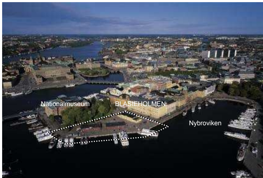
Flygvy över Blasieholmen med planområdet ungefärligt markerat.

av David Chipperfield Architects, Berlin, utsågs som vinnare. Beslut om samråd fattades i nämnden den 19 februari 2015 och redovisning av samrådet gjordes för nämnden den 15 oktober 2015.