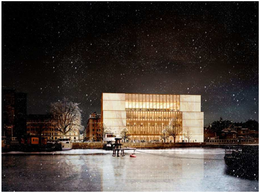
Nobel Center får en mässingsfärgad fasad av stål. Byggnadens transparenta, halvtransparenta och täta delar skapar en dynamik och ett ljusspel i fasaden. Bild: David Chipperfield Architects.