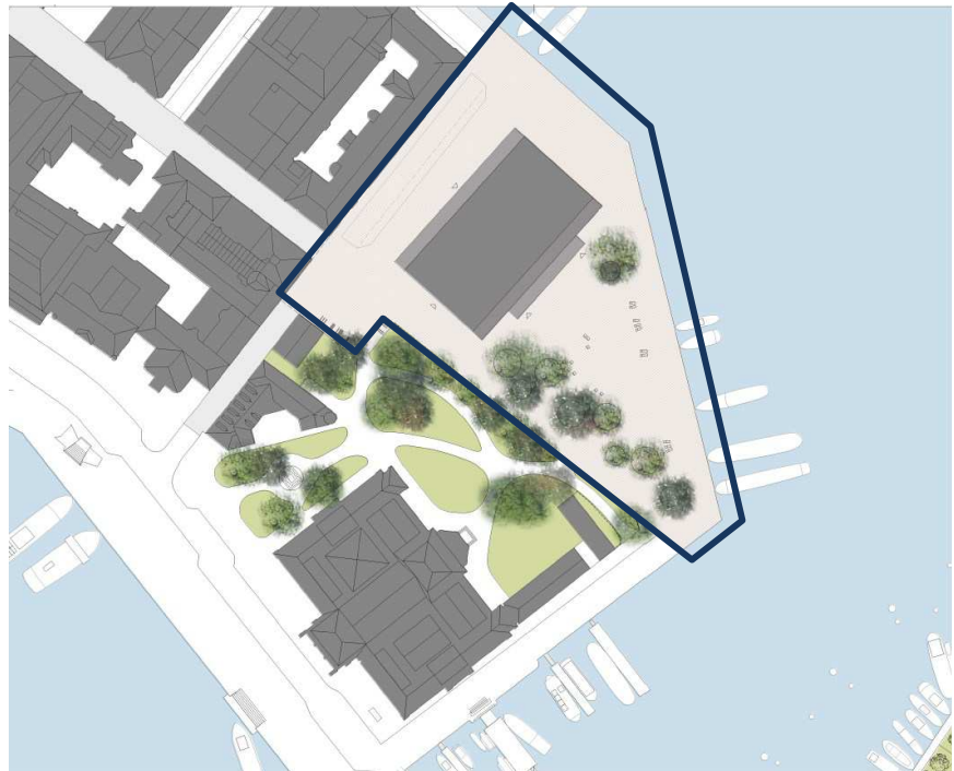
Illustrationsplan för planområdet. Illustration: Landskapslaget.

Syftet med planarbetet är att möjliggöra ett Nobel Center samt att skapa en ny offentlig plats på Blasieholmen i Stockholm. Därutöver ska kajer iordningställas för fortsatt rörlig båttrafik samt omkringliggande gatumiljöer rustas för att öka områdets attraktionskraft och värde.