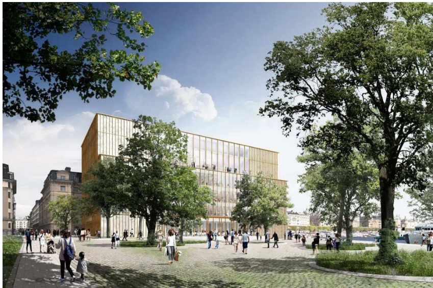
Nobel Center möts av en offentlig plats i söder. Bild: David Chipperfield Architects.

Nobel Center ska rymma en stor andel publika verksamheter som främjar stadslivet på platsen. Entréplanet med restaurang, museibutik och viss utställningsverksamhet ska vara öppet för allmänheten. Planens syfte är att byggnaden i sin karaktär, arkitektoniska utformning och kvalitet ska motsvara andra byggnader av samma dignitet vilka präglar Stockholms vatten- och stadsrum idag. Den höga arkitektoniska kvaliteten är både viktig för upplevelsen av stads- och vattenrummen samt förmedlandet av att detta är en viktig institution för Stockholm. Arkitekturen ska kännetecknas av absolut högsta kvalitet.