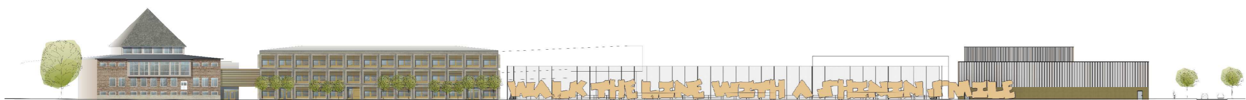
ELEVATION längs Älvsjövägen