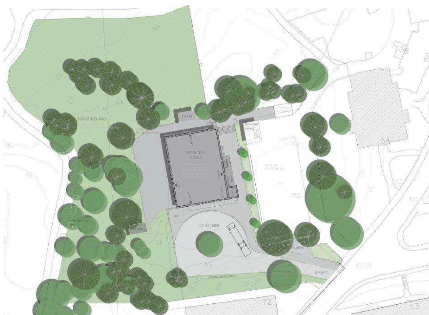
Situationsplan, ny förskola (Cedervall arkitekter).