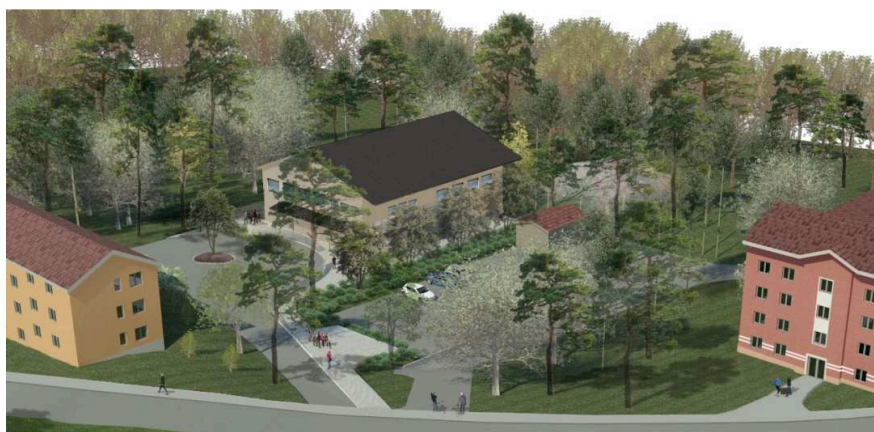
Översiktsbild (Cedervall arkitekter).

Förskolan förses med sadeltak för anpassning till närliggande bebyggelse. Plankartan reglerar förskolans placering och riktning genom att begränsa byggrättens utbredning i plan. Den styr även byggnadens totalhöjd och minsta taklutning med stöd av PBL 4 kap 11, 16 §.