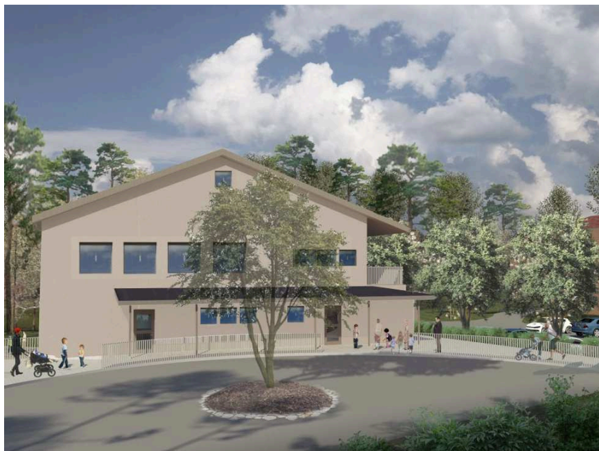
Illustration, från söder/vändplan (Cedervall arkitekter)