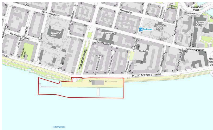
Planområdets läge och ungefärliga avgränsning.