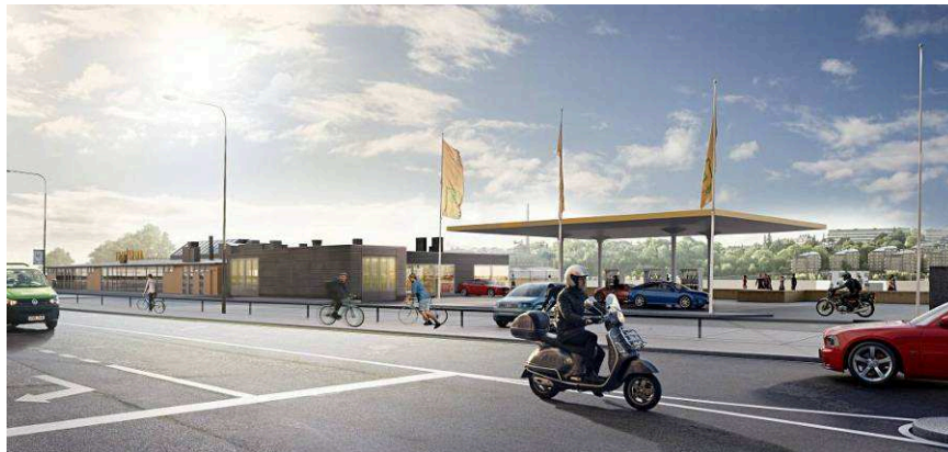
Perspektivbild från nordväst som visar den putsade murväggen i en ljus kulör som avses att bevaras.

att ansluta till stadsgasnätet och att anlägga en sjömack. Drivmedelsstationen kan därmed utvecklas och erbjuda biogas till såväl fordon som fartyg utan att gastransporter blir nödvändiga i innerstaden.