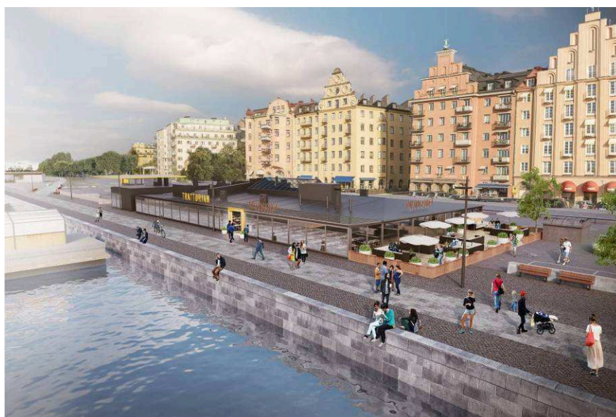
Perspektivbild sedd från sydöst. Bilden visar uppglasade fasader mot vattnet, ett enhetligt mörkt skivmaterial och den tilltänkta uteserveringen. Alla installationer på taket målas i en mörk kulör. (Bild: Tengbom)