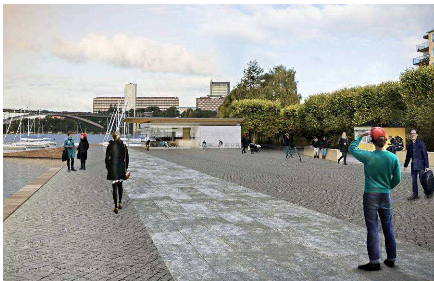
Perspektivbild från öster som visar föreslagen byggnad avsedd för hamnkontor och restaurang. Byggnaden ska vara indragen från kajkanten så att den inte försämrar för utsikten eller framkomligheten på kajen. Till vänster i bild syns en del av bryggan som ska göras tillgänglig för allmänheten.