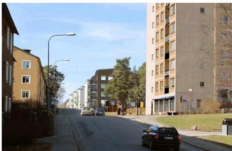
2. Kvarteret Söderarm. Perspektivbild från Söderarmsvägen. Lamellhusbebyggelse utmed Söderarmsvägen och Karlsövägen, ca 30 lägenheter.