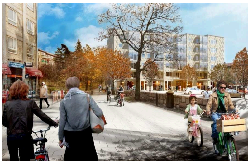
3. Kvarteret Näskubben. Perspektiv av torghuset med busstorget i förgrunden. I kvarteret Näskubben föreslås även lamellhusbebyggelse utmed Kärrtorpsvägen, totalt ca 92 lägenheter. Förslaget innebär att befintlig förskola rivs.