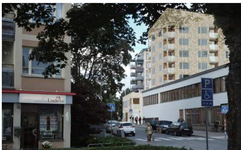
1. Kvarteret Grönskär. Perspektivbild från Lågsjärsvägen. Ny bebyggelse, punkthus med lågdel, ca 38 lägenheter. Befintlig kontorsfastighet föreslås rivas.