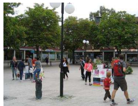
Dokumentation event Drömtorget. Kuber på torget som prövades till olika användningsområden och på olika platser.