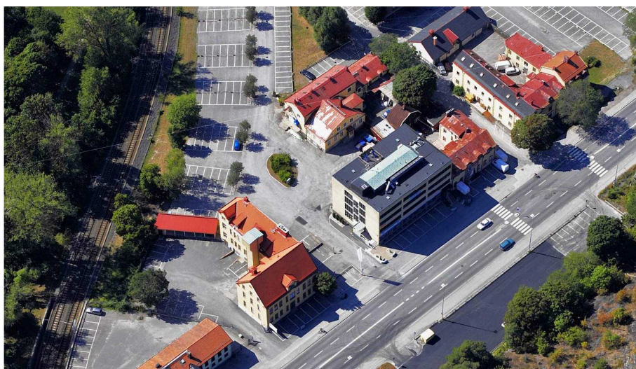
Befintlig bebyggelse inom Bolidentriangeln. Bolidenvägen i förgrunden. Lindeparken till vänster