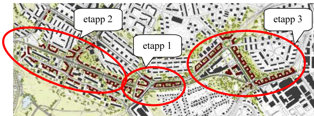
Bebyggelsestruktur enligt programmet för Årstastråket, år 2005. Etappindelning.