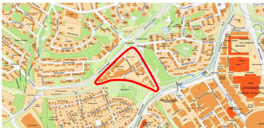
Aktuellt område, "Bolidentriangeln", strax söder om Bolidenplan