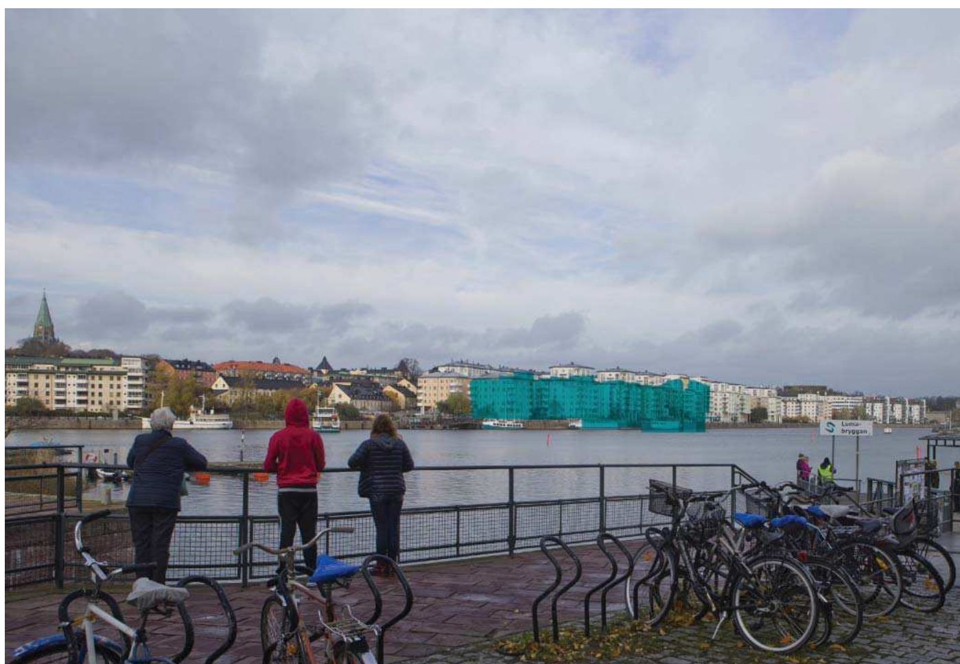
Vy4. Från Lumabryggan i Hammarby sjöstad - med planförslag