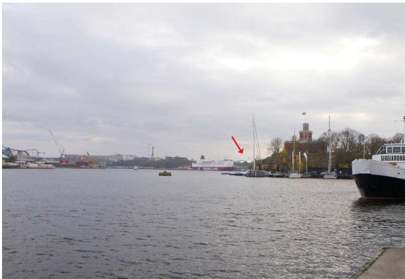
Vy2. Från båtbyggen på Skeppsholmen - med planförslag