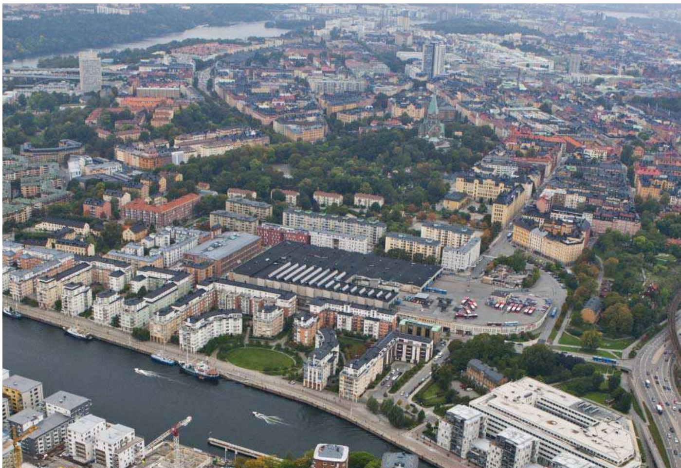
Flygvy från nordöst - nuläge