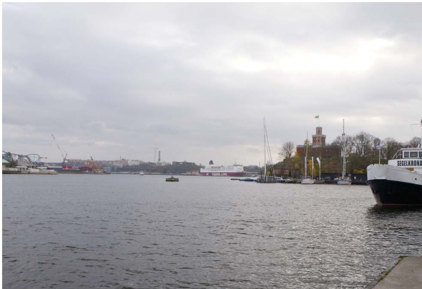
Vy2. Från båtbyggen på Skeppsholmen - nuläge