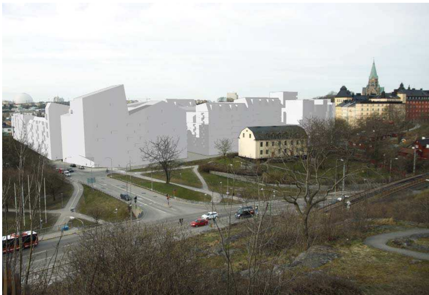
Vy 7. Från Fåfängan - med planförslag