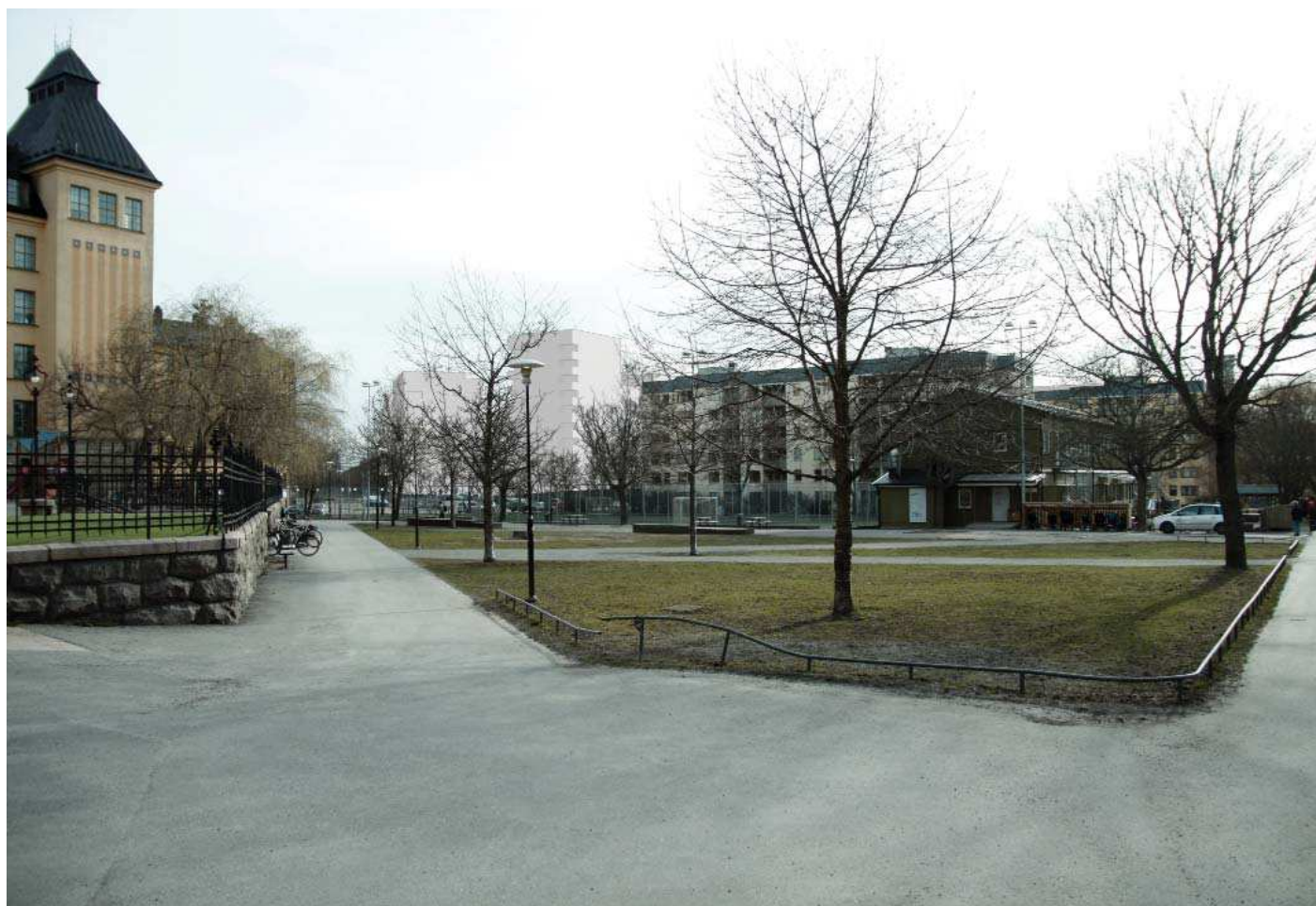
Vy8. Från Sofia skola - med planförslag