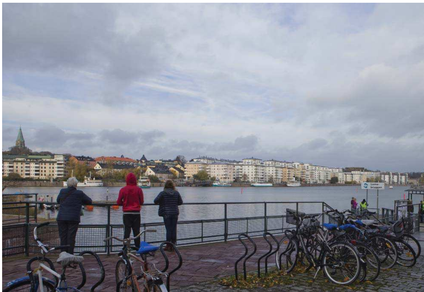
Vy4. Från Lumabryggan i Hammarby sjöstad - nuläge