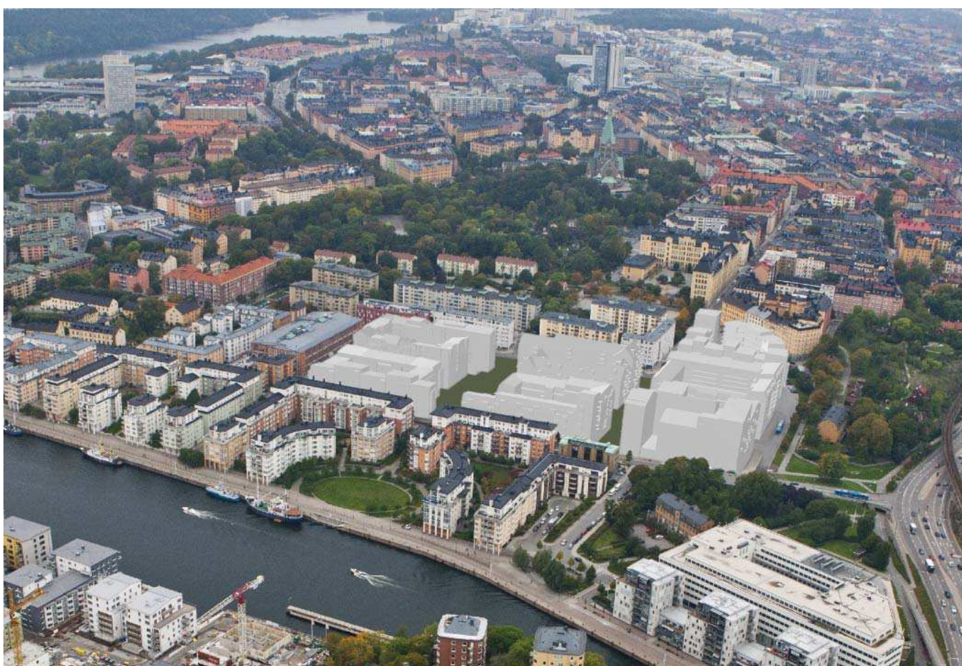
Flygvy från nordöst - med planförslag