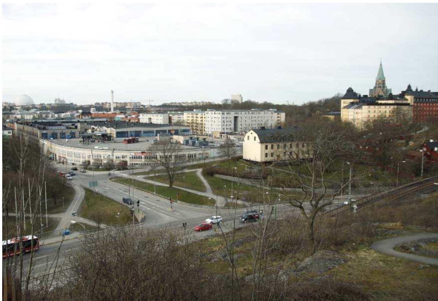
Vy 7. Från Fåfängan - nuläge