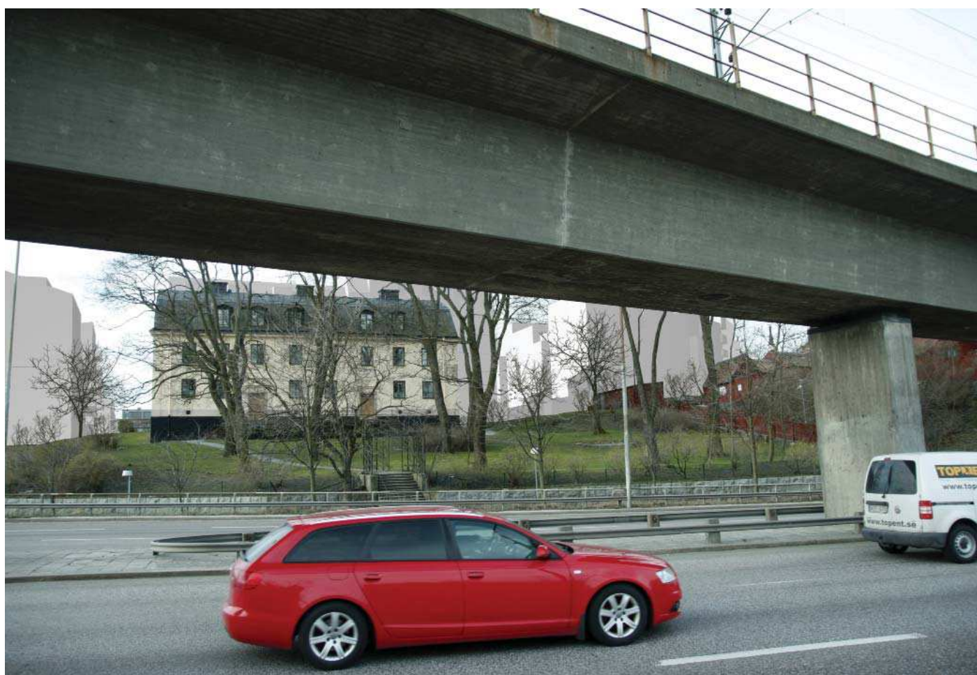
Vy6. Från busshållplats nedanför Danviksberget - med planförslag