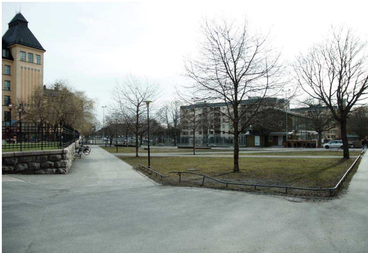
Vy8. Från Sofia skola - nuläge