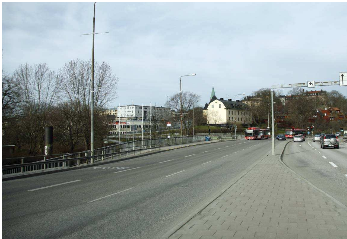
Vy 5. Från Folkungagatan nära Danvikstull - nuläge