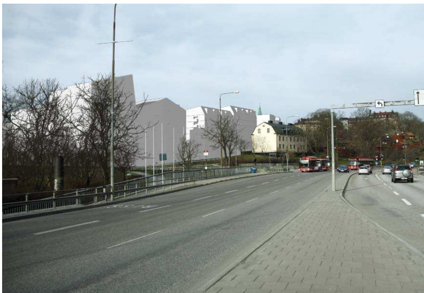
Vy 5. Från Folkungagatan nära Danvikstull - med planförslag