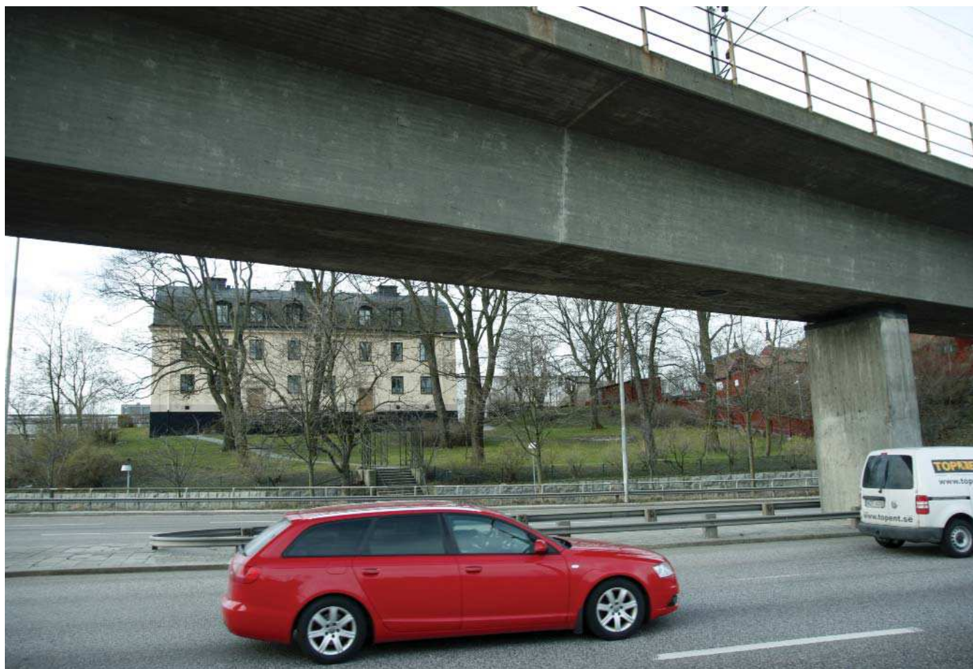
Vy6. Från busshållplats nedanför Danviksberget - nuläge