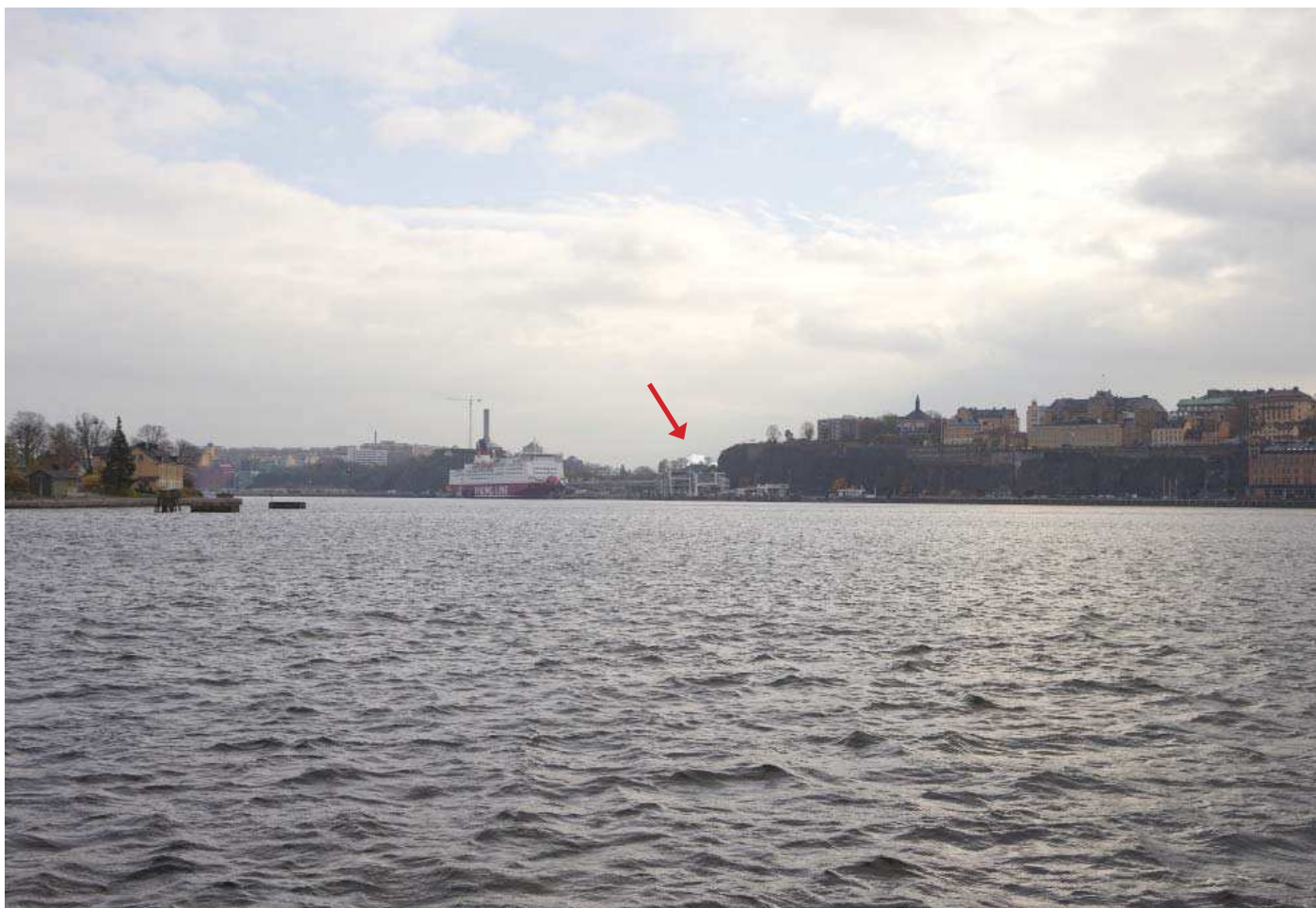
Vy 1. Från kajen på södra Skeppsholmen - med planförslag