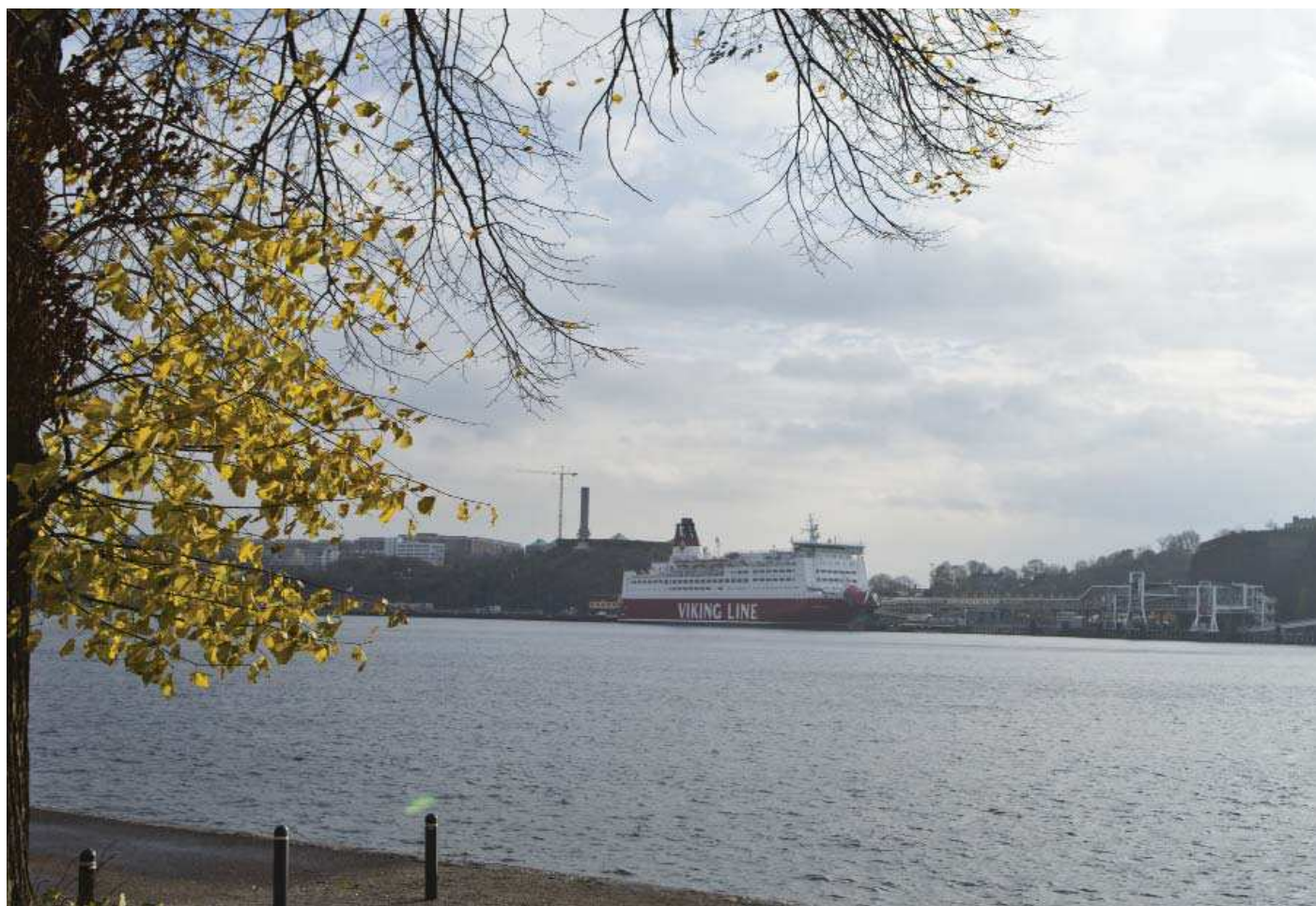
Vy 3. Från kajen på södra Kastellholmen - nuläge