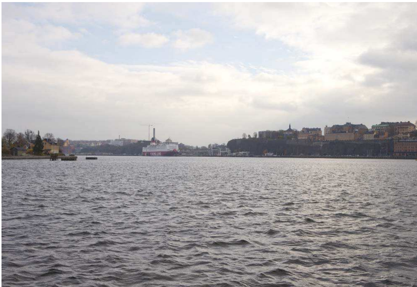
Vy 1. Från kajen på södra Skeppsholmen - nuläge