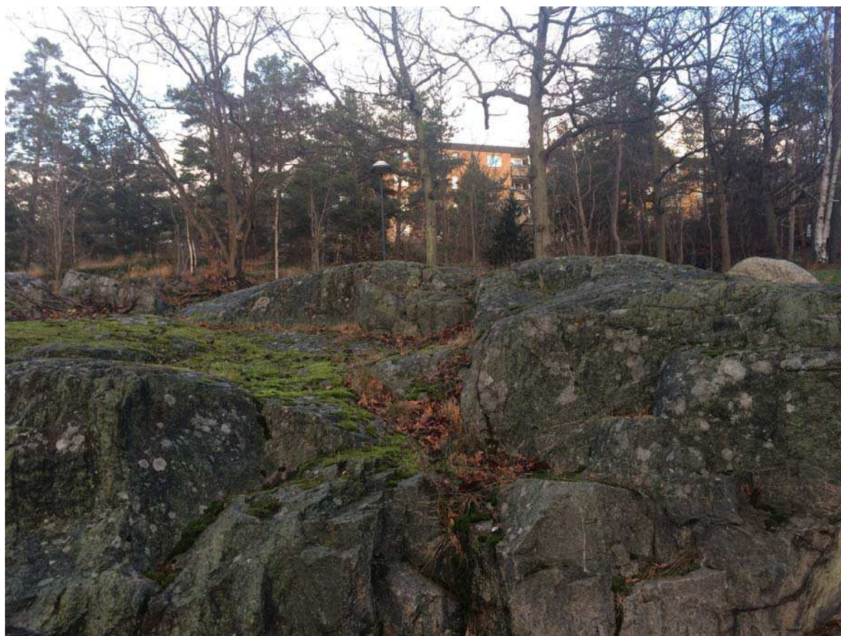
Marken öster om Vita Liljans väg åt de bruna husen är kuperad. Träden bildar ett skogsparti snarare än en park.

Då markparkeringen mellan husen tar mycket plats i anspråk har "hus i park"-idén inte genomförts fullt ut. Man kan i vissa situationer kalla det för "hus i car-park".