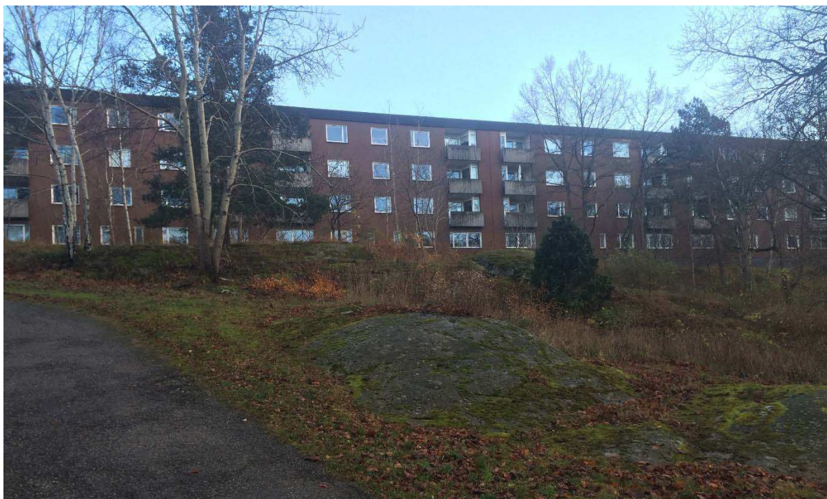
Del av kv. Sigbardiorden av arkitekt Lars Bryde

Byggnaderna är något förvanskade efter bla fasadrenovering och fönsterbyte. Interiöra ombyggnader pågår för närvarande. Husen är gulklassade av Stadsmuseet