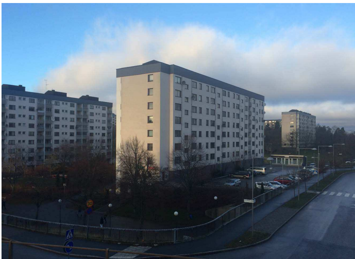
Skivhusen dominerar stadsdelen. Samtliga har samma nord-sydliga längdriktning. Här vid Bredängs allé.