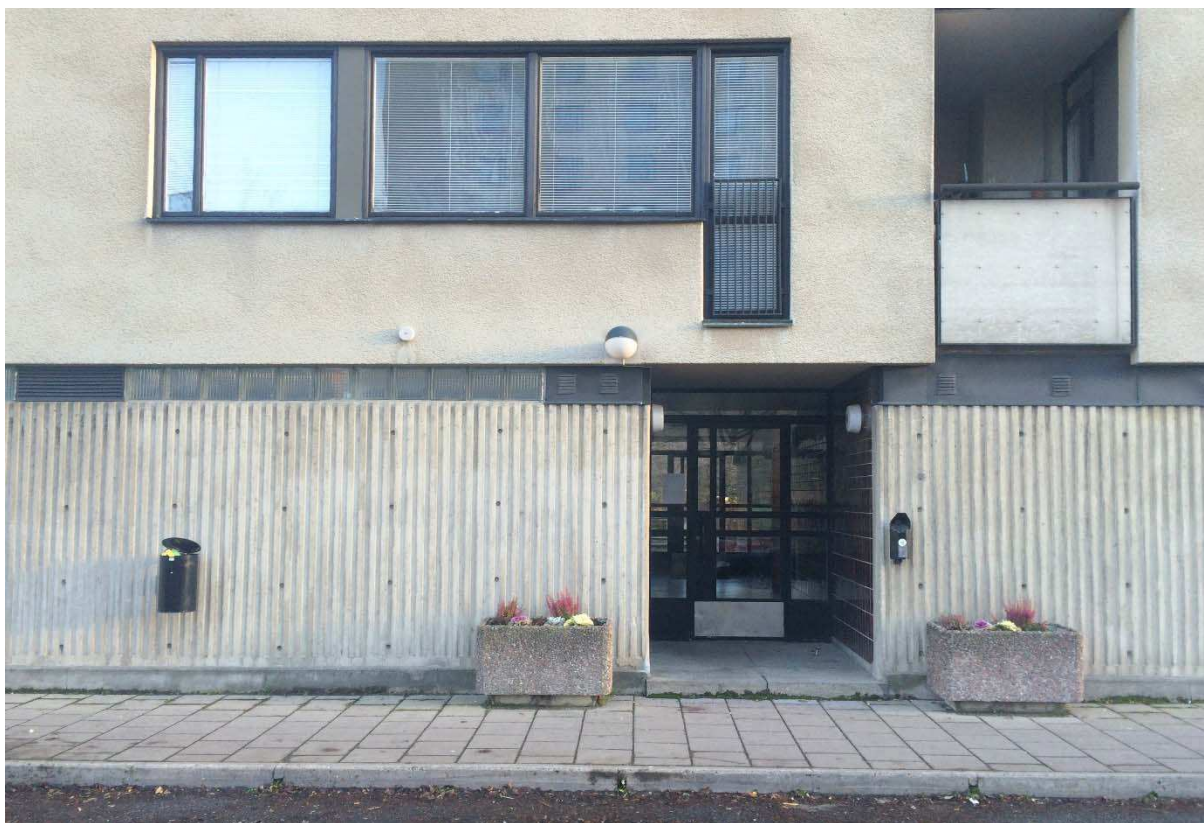
Fasadutsnitt i det av Stadsmuseet blåklassade huset, kv. Coldinuorden, Kjell Abramsson Arkitektkontor AB